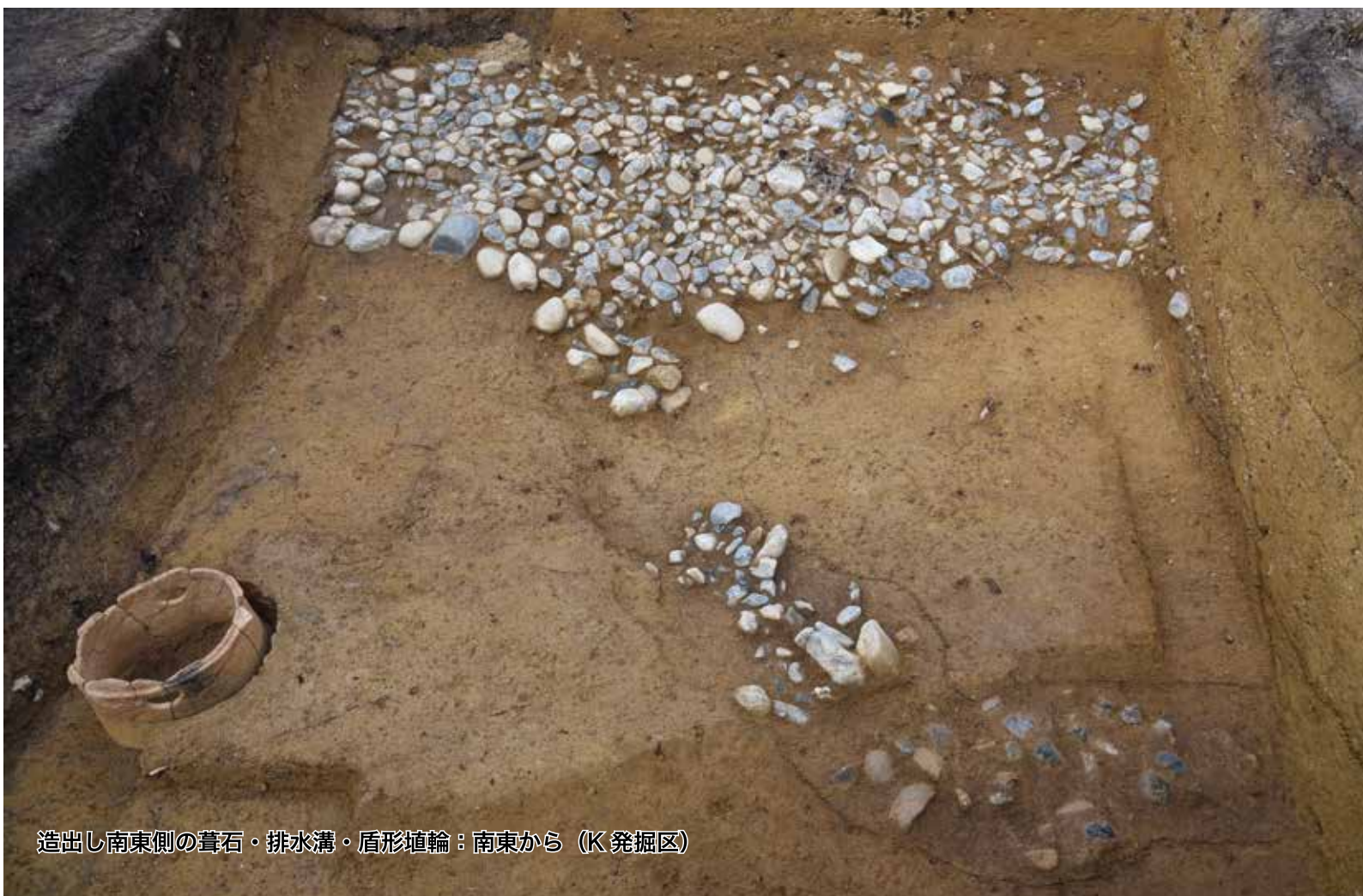
造出し南東側の葺石・排水溝・盾形埴輪：南東から（K 発掘区）