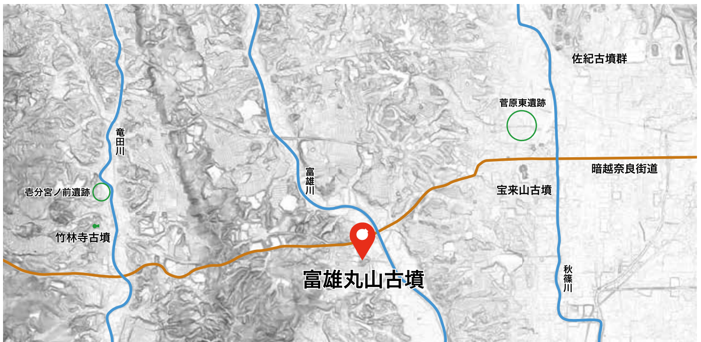
富雄丸山古墳の位置（下図は地理院地図）