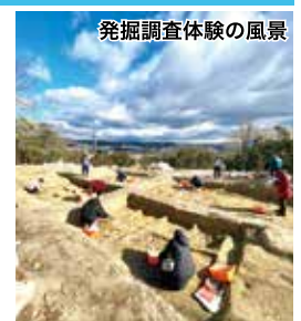
発掘調査体験の風景

また、奈良大学との包括連携協定に基づく文化財学科の学生、東京・筑波・法政・大阪大学で古墳研究を行う大学院生と協働して発掘調査を実施しました。