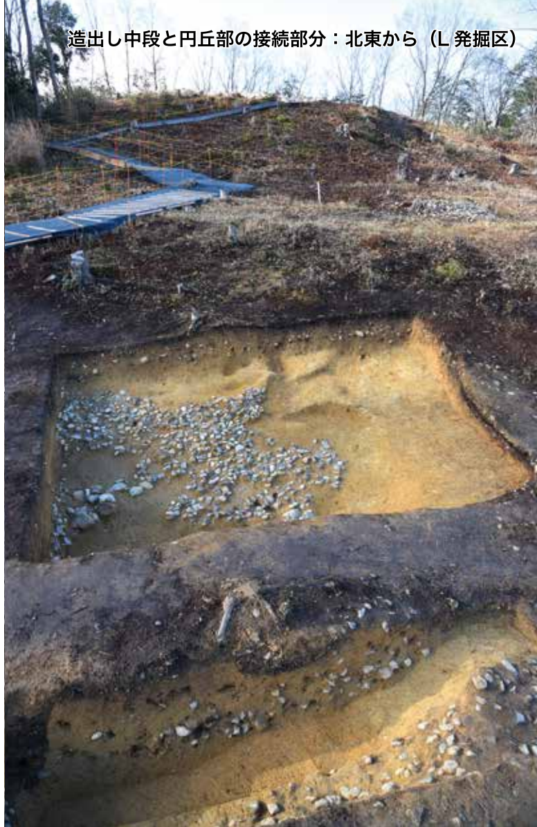
造出し中段と円丘部の接続部分：北東から（L 発掘区）