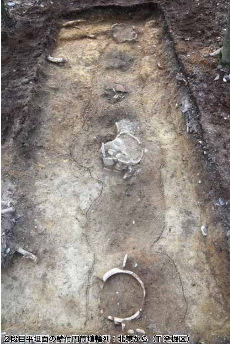
2段目平坦面の鰭付円筒埴輪列：北東から（T 発掘区）