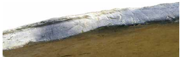
2号墓陶棺蓋端面にみられる段差

の口縁部形状と合致します。また、棺蓋の口縁部端面外周に沿って成形台の輪郭を示す段差が一部残っており（写真）、その輪郭を追っていくと蓋受けの外形線と一致しました。水平な成形台の上で棺蓋をつくるのが通例で、棺身蓋受けを利用した棺蓋製作の確認例は初めてです。