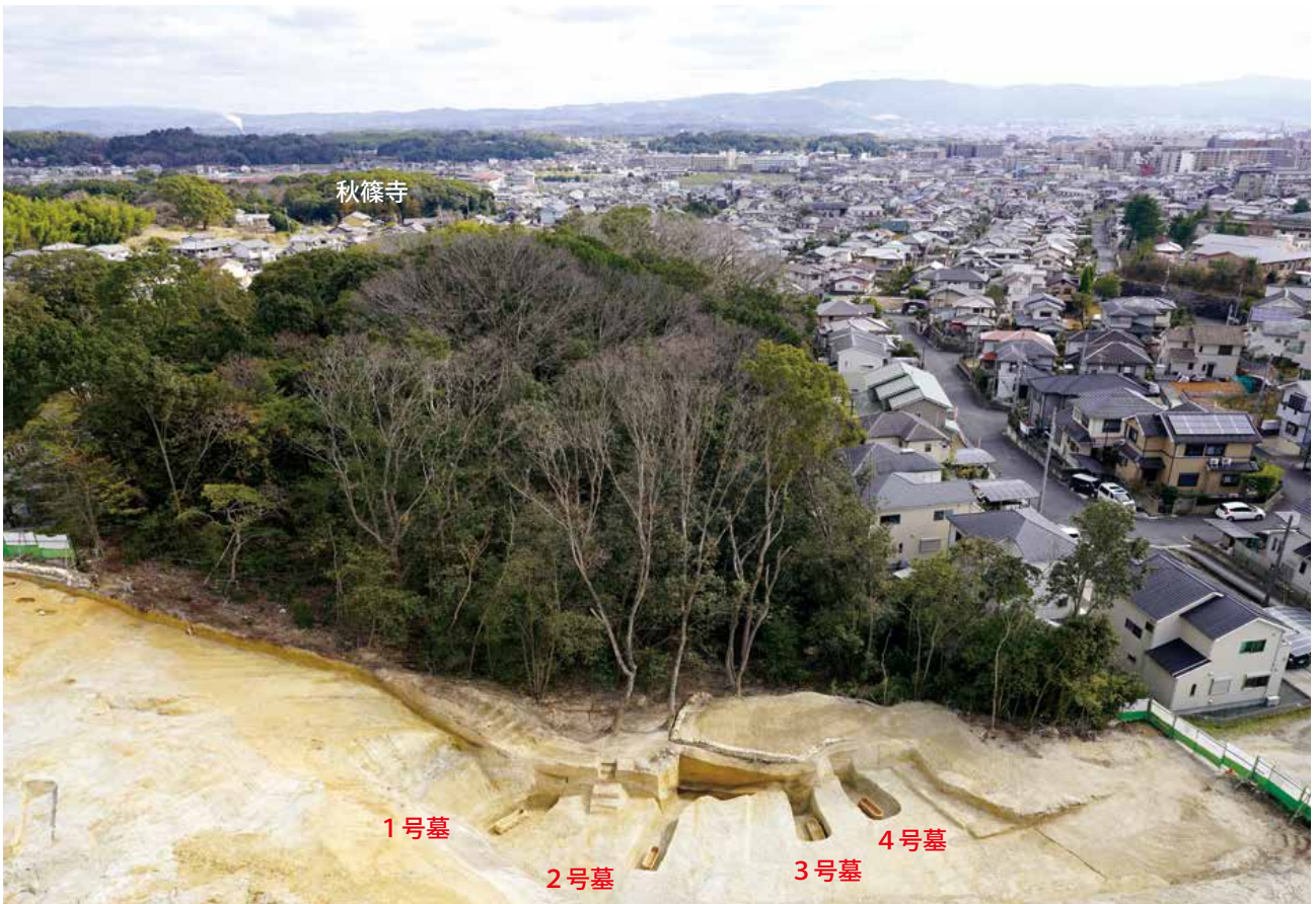
秋篠阿弥陀谷横穴墓群全景 (西から)

杯身8点・杯蓋2点・高杯1点・短頸壺1点、4号墓で陶棺内から耳輪1点・陶棺外から須恵器杯身4点・杯蓋2点・高杯1点・台付長頸壺1点が見つかりました。特に3号墓は副葬品の配置から亀甲形陶棺の他に木棺が2基あったと推定され、追葬が行われていたと考えられます。