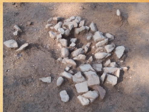
縄文時代の集石遺構

鍋倉第2遺跡は、加久藤盆地の東の縁近くの丘陵上に位置しています。調査の結果、丘陵の平坦地に集石遺構が3基作られており、時期差はあるものの丘陵斜面に陥し穴状遺構が2基確認されました。人間の滞在を裏付ける遺構等は、丘陵頂上部の狭小な平坦面のみに分布していました。本遺跡の遺物は希薄で、おそらくこの場所は、縄文時代早期のごく短期間の滞在の跡で、必要に応じて集石遺構で食料の加工、調理を行うキャンプサイト的な利用をしていたと考えられます。