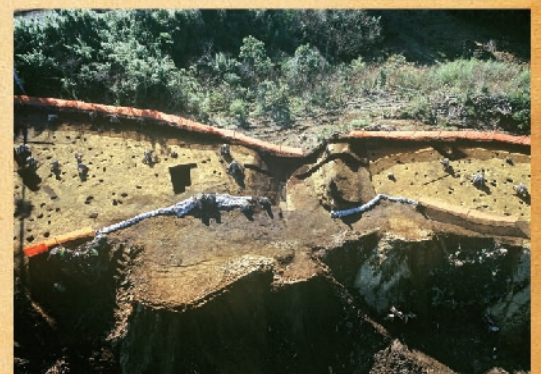
第2次調査区の土塁と堀切