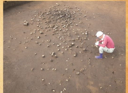
集石遺構と周辺の散磔

中床丸遺跡では、主に縄文時代早期と縄文時代後期～晩期の遺構・遺物が確認されています。特に、縄文時代早期の地層からは、集石遺構が9基、陥し穴が1基見つかりました。また、縄文時代草創期の土器片も見つかりました。これらの遺構や遺物は、当時の人々の生活の様相を物語り、火山灰層が厚いため縄文時代早期の調査があまり行われていなかった都城 うめきた 市域の縄文文化の解明に大きな役割を果たすものと考えられます。