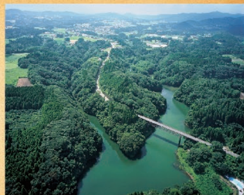
戸崎城跡を南東より撮影(手前は野尻湖)

戸崎城跡は、自然の地形を巧みに組み入れて防御機能を高めた中世の山城です。今回の調査で、曲輪内連絡通路や曲輪の裾を巡る道路状遺構・堀底がV字状を呈する堀切・土塁を確認しました。また、それぞれを改変し防御性を強めていたことも分かりました。遺物は、主に中国製の陶磁器が出土しており、15世紀から16世紀にかけて山城として大きな役割を担っていたのではないかと考えられます。その他、西南戦争の塹壕状遺構を確認することができました。