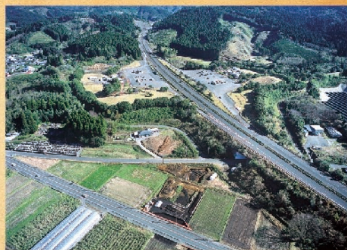
一本松遺跡を北西より撮影(奥は山之口サービスエリア)

一本松遺跡は、都城市山之口町麓地区の国道269号線沿いにあり、宮崎自動車道山之口サービスエリアの西側に位置しています。調査の結果、南北が主軸の中世の柱穴列が検出され、その並びから、堀の一部であった可能性があります。また、中国から輸入された青磁や唐津、備前系の陶器などが出土しました。さらに、鉄製品や鉄を生産する際に出る鉄のくず(鉄滓)、鞆の羽口などの鍛冶関係の遺物も出土しています。遺物の出土状況から、この周辺で何らかの形で鉄生産が行われていたと推測されます。