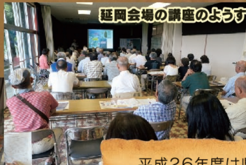
延岡会場の講座のようす