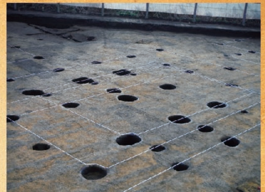
第1次調査区の掘立柱建物跡の柱穴

第2次調査の調査区では、中世の土塁・堀切・溝と推定される遺構や、陶磁器類や宋銭などの遺物が確認されました。出土した陶磁器類には、当時高級品であった、中国製の青磁や白磁が数多く含まれており、有力者が暮らしていたと推測されます。こうした遺構や遺物の性格から、中世には城館跡 じょうくわんあと であった可能性があります。その他、縄文時代後期～晩期頃の土器片や石斧などの石器類、弥生時代の土器片なども出土しています。