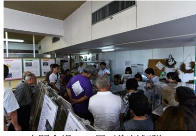
串間会場での展示資料解説