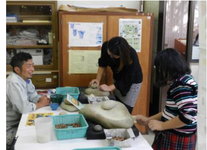
施設公開（ドングリつぶし体験）