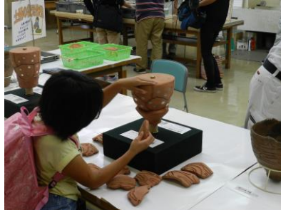
施設公開（土器復元体験）