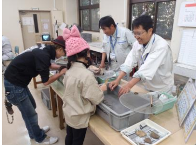
施設公開（土器水洗体験）