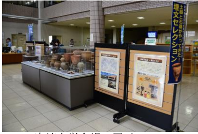
宮崎大会場の展示