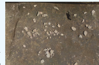
縄文時代の集石遺構

遺物は、縄文時代早期の貝殻条痕土器や黒曜石、チャートの石鏃、剥片、縄文時代晩期の黒色磨研土器が出土しました。特に、霧島牛の脛火山灰(下部)の中で見つかった集石遺構2基は、宮崎県下でも調査例の少ないものです。火山灰が降る中、縄文時代の人々が生活していた様子がうかがえます。