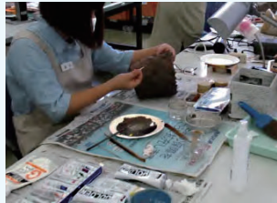
土器の復元・修復のようす

小迫遺跡は、都城市の中心部から南に約11kmの梅北町にあり鹿児島県との県境付近に延びる丘陵の尾根筋に立地します。特に縄文時代早期、中期～後期にかけての良好な資料が数多く確認された遺跡です。