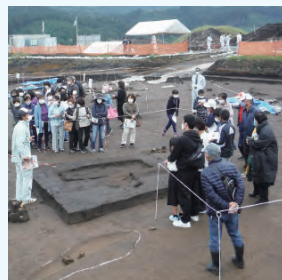
現地説明会のようす