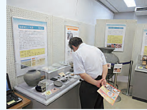
高鍋会場(高鍋町歴史総合資料館)

展示は、各会場所在地の遺跡から選りすぐりの逸品を約200点展示しました。都城市立図書館での展示では、平成27年度から始まった都城志布志道路金御岳工区工事ともなう発掘調査(上高遺跡・小迫遺跡・保木島遺跡ほか2遺跡)の成果展示も併せて行い、地元の方々の関心を集めました。