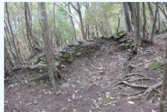
石積みの台場(北東より)

また、耳川左岸の鳥川台場群(薩軍)には、土塁内側に石を積み上げて土留めを行っている台場(写真参照)も見つかっており、台場の構造を知る上で非常に重要なものです。