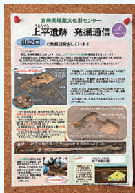
近隣の小学校に掲示した発掘通信