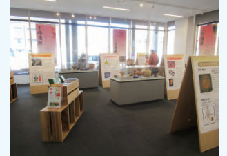
都城会場(都城市立図書館)