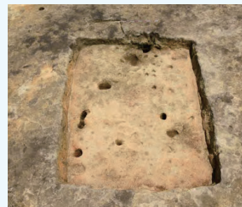
古墳時代の竪穴住居跡

花木池平遺跡は、河岸段丘上東側緩斜面の下に立地しています。調査の結果、縄文時代から近世にかけての遺跡であることがわかりました。