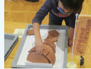
日向会場(日向市役所)セレクション講座