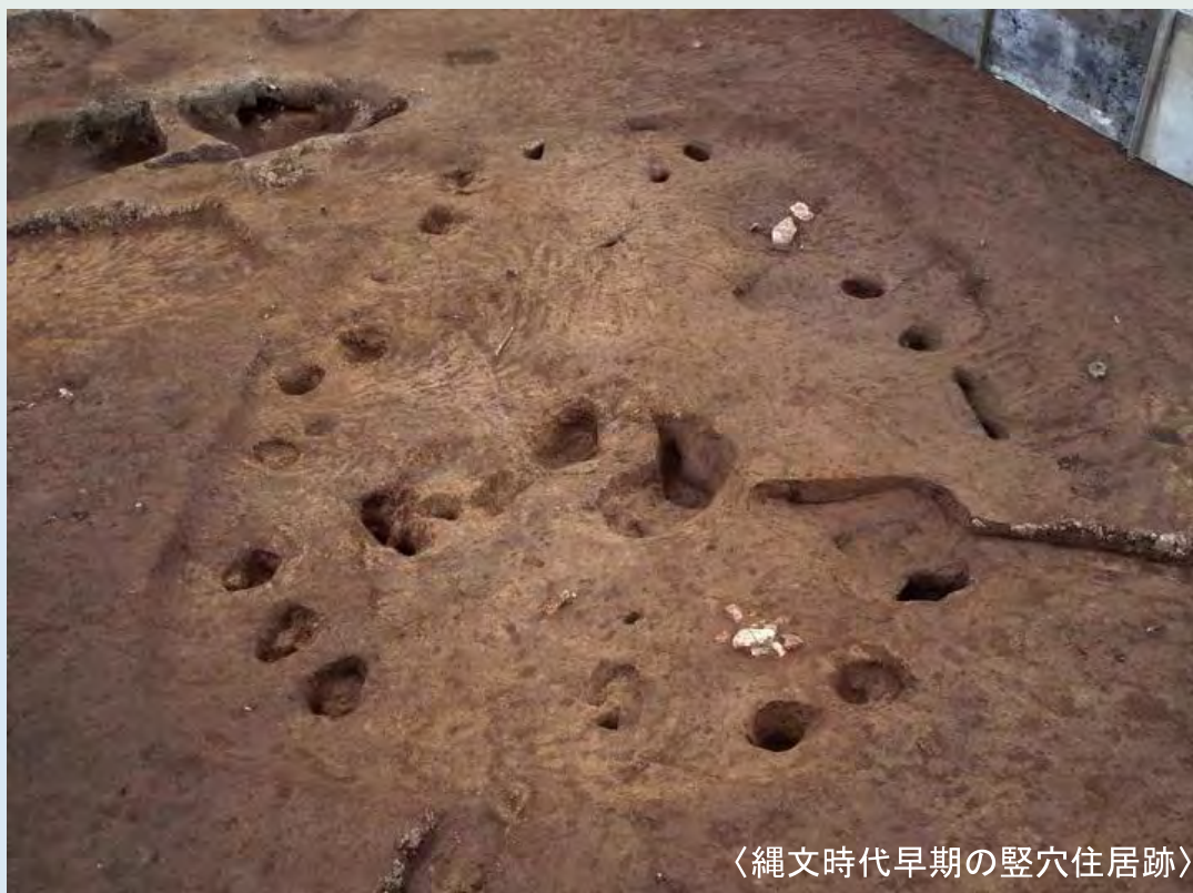
〈縄文時代早期の竪穴住居跡〉