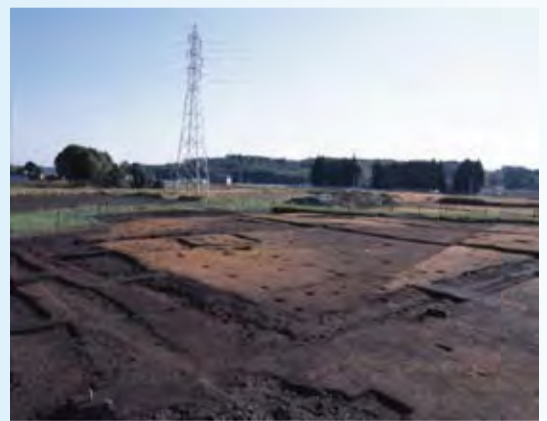
区画溝と掘立柱建物跡

弥生時代終末の周溝状遺構や中世から近世の掘立柱建物跡、溝状遺構、中世墓等を検出しました。中世から近世の集落を区画するための区画溝も検出され、これらは掘立柱建物跡と同じ時期に作られた可能性が考えられます。調査区全体からは中世から近世の陶磁器(輸入・国産陶磁器)が豊富に確認され、当時の生活の様子を知ることができます。