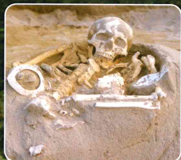
広田川 Hirota River

青年男性で右腕にオオツタノハ貝輪を7つはめ、左腕にヤコウガイ容器が副葬されていた。背骨に磨製石鏃が1つささっていた。 On the right arm of the young man 7 Limpet shell bracelets and on the left a Green Turban shell spoon were found. In between his lumbar vertebrae, a polished stone arrowhead was discovered.