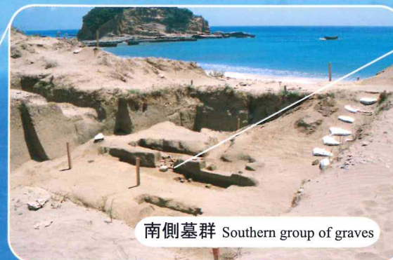
南側墓群 Southern group of graves