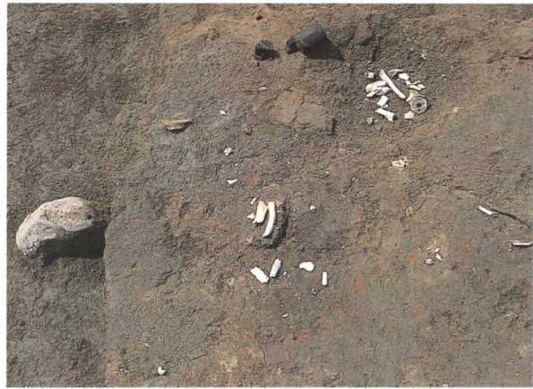
ⅦEの墓地—43GPの骨と六道銭

第3次調査で発掘された遺構・遺物は、ⅦEの包含層（黒色土）中の骨と渡来銭、ⅨD出土の人形木製品等である。ⅦEには、幅約4m、延長約10mの範囲に骨と渡来銭が伴出した箇所と、骨だけを出した箇所がそれぞれ4カ所づつあった。黒色土中に骨と渡来銭が位置していたため、墓穴などの土壌は確認することはできなかったが、一塊の骨と5枚の渡来銭が伴出した