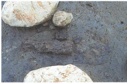
第66号住居跡床面の炭化材