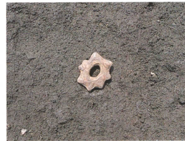
VI F - 9f 出土の鏢形土製品