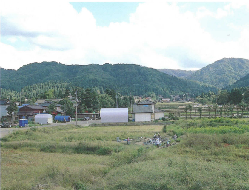
中道遺跡から東の下道古銭出土地・栖吉城跡を望む

中道遺跡は、信濃川右岸の東山丘陵から西に向かって流れ出る栖吉川の扇状地に位置する。栖吉川沿岸にはいずれも15世紀代の松葉遺跡、三貫梨墳墓、三貫梨館跡、14世紀半ばの下道古銭出土遺跡など中世遺跡が多数位置している。また、集落の背後には15世紀末から16世紀初めに、古志長尾氏が蔵王堂城跡から拠点を移した栖吉城跡が存在する。縄文時代の遺跡には、前期の土器を出土した三貫梨遺跡、早期・中期の集落跡の松葉遺跡、晩期の大明神遺跡などがある。