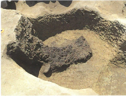
トチの実ピット (VI F-P64)