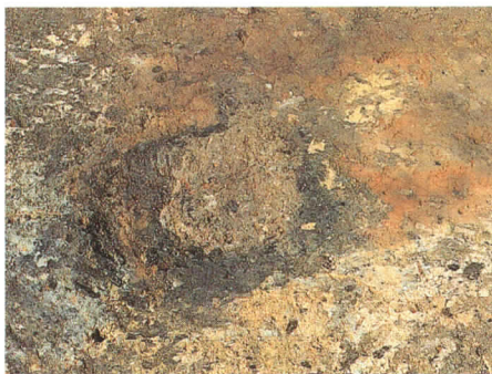
第66号住居跡の焼けた柱？