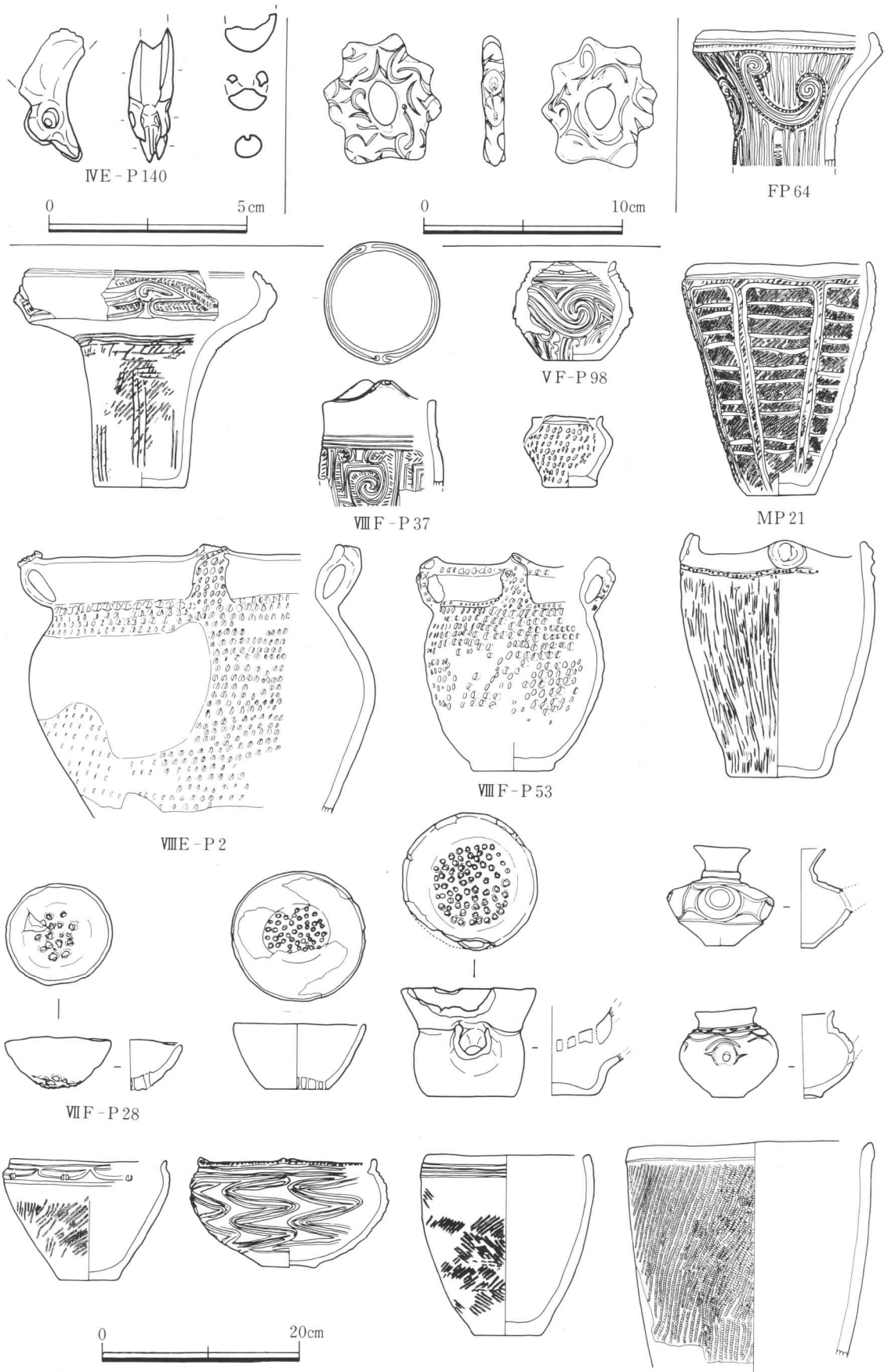
第3図 第3次発掘調査出土品 特に指示していない出土品は、包含層出土