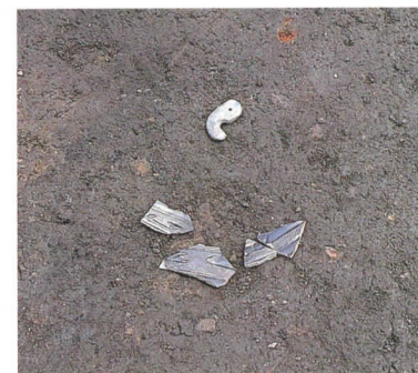
大洞C1式土器と勾玉・石鏃