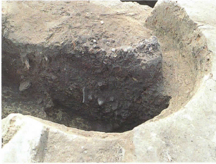
トチの実ピット (VI E-P61)