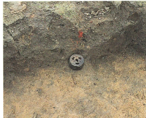
第61号住居跡群出土の土製耳飾り