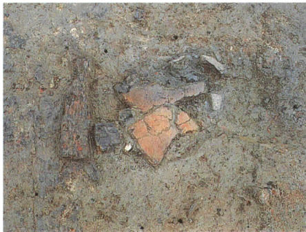
第66号住居跡床面の炭化材