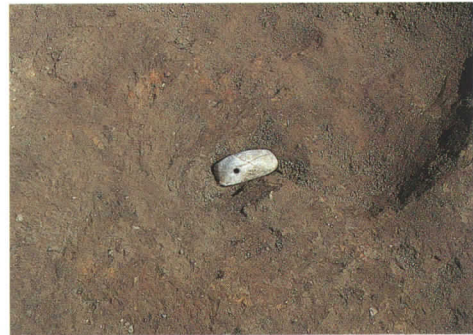
第61号住居跡群出土の玉

第61号・第62号・第71号住居跡 3軒の平面円形の住居跡が重なった状態で検出された。第61号住居跡は約10m、第62号は約12mの直径で、第71号は約11mと推定される。いずれも10mを超える大きさで、7m近い直径の第22号住居跡をはるかに上回っている。第71号の床面は、遺構の確認面と同じレベルで、第71号の床面より10～15cmほど低い第62号と、35cmほど低い第61号住居跡の覆土中に地山土を貼って床面としている。第62号住居跡も20cmほど低い第61号の覆土中に床を貼っている。貼床の状況から、第61号→第62号→第71号住居の順で改築が行われたと考えられる。なお、第2図で示した貼床の範囲は、調査で平面的に確認できた部分である。第62号の床面の一部に、黒くガチガチに堅くなった面が見られた。ガチガチの面は、確認できた第71号の貼床の全面にも広がっていた。炉は、第61号のほぼ中央にある地床炉が確認されただけである。第61号住居跡群の覆土から晩期中葉の大洞C1式の土器が出土した。