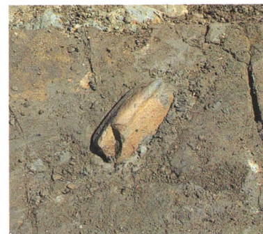
第63号住居跡群出土の石冠

第2号建物跡は、棟持ち柱が付く掘立柱建物跡で、根固め石を伴う柱穴だけから構成される。規模は、梁間1間（約3.5m）、桁行2間（約3.3mの等間隔）である。妻側から棟持ち柱までの張り出しは約1mである。第3号建物跡は、第61号住居跡群に一部が重なった、梁間1間、桁行2間の棟持ち柱が付かない掘立柱建物跡である。なお、第2号・第3号ともに、柱穴出土の土器から、時期を推定することは困難である。