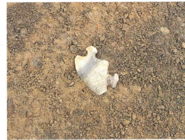
IX E - 1b 出土の石匙