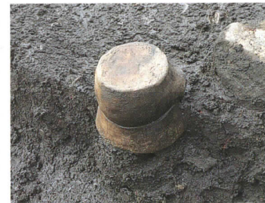
多孔底付注口土器の出土状況