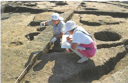
住居跡土層断面の実測