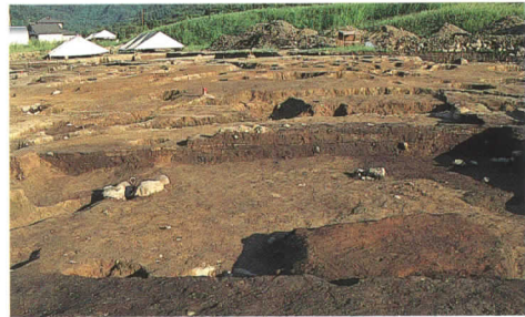
第61号住居跡群土層断面

第1次調査で検出された晩期の第22号住居跡から東へ約80mほどのところに、住居跡10軒がまとまって位置していた。そのうちの1軒は、床面に焼けた痕跡が見られた。