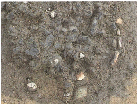
トチの実ピット (VII F-P2)