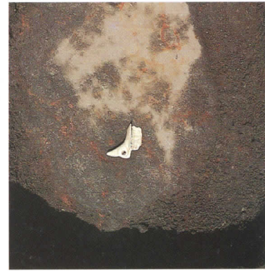
VI E - P142出土の弓筈

第2次調査で出土した『多孔底付注口土器』が第3次調査でもVIII F - 6dの包含層で倒立した状態で出土した。多孔底付注口土器の出土例は、管見ではこれで3例目とごく僅かである。新潟県内では中道の2例だけである。第2次調査出土例は、多孔底部の多くが欠損していたが、第3次の出土例は注口の上部和、注口の直上にあたる多孔底の一部が欠損しただけである。残存部から注口と多孔底部とが橋状に結ばれていた可能性がある。