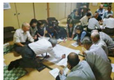
伊勢街道に関する聞き取り調査を行っています。