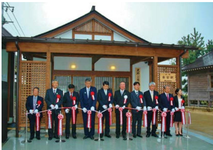
斎宮駅史跡公園園口完成式典 3月19日＝斎宮(サイクー)にオープンしました!

平成26年度は斎宮駅北側に史跡公園園口休憩所を建設し、3月19日にオープンしました。また、町道坂本斎宮線の一部に歩道と側溝をつけ、道幅を広げ、道路の一部をカラー舗装にし、ガードレール、カーブミラーも景観に配慮した色彩にしました。そして、長年の課題となっていました冠水対策工事にも着手しました。他にも、史跡公園内の案内看板を増設し、散策していただきやすくするなど、史跡斎宮跡内の整備に力を入れました。