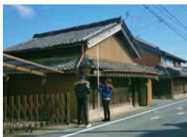
伊勢街道沿いの歴史的建造物調査を行っています。

地域みなさんが住みやすく、観光客の方に喜んでいただけるような史跡斎宮跡をめざして取り組んでまいります。引き続き、みなさんのご理解とご協力をよろしくお願いいたします。