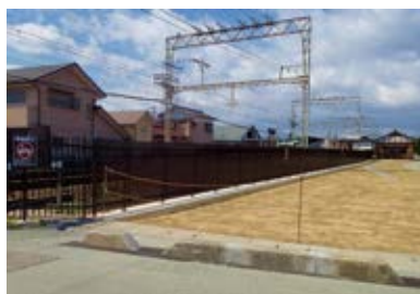
鉄道沿線のフェンスを新調し芝生を植え、駅周辺の美化・緑化も進めています。

平成27年度も引き続き史跡斎宮跡内の道路のカラー舗装、冠水対策等の整備工事を進めるとともに、3棟の復元建物完成にむけ、史跡公園園口休憩所や復元建物周辺の整備を進めます。