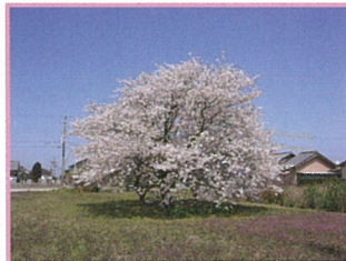
「孤高の桜(齋王地区内)」 風格のある幹の周囲を整地しました。お花見に最適な場所です。