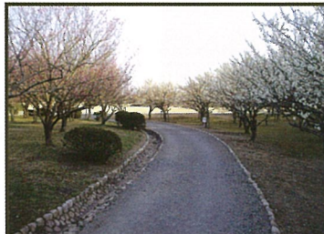
「梅林(博物館体験広場)」 散策道を挟み、紅梅と白梅が時期を分けあって開花します。

※開花する植物、場所及び開花時期は、年度ごとの植栽計画により異なる場合があります