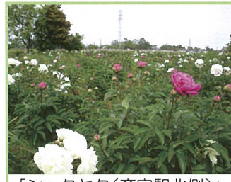
「シャクヤク(齋宮駅北側)」 白と桃の花びらが慎ましく開花するも時期が短い為、お見逃しの無いように。