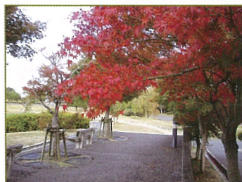
「紅葉(ふるさと芝生広場)」 色付いた枝葉を眺めながら、ベンチでの休憩がお勧めです。