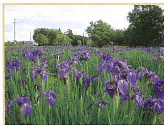
「ノハナショウブ(ロマン広場)」 1万本余りの紫紺の花弁が初夏の史跡内に彩りを加えます。