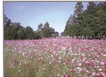
「コスモス畑(古代伊勢道周辺)」 秋風を感じながらの散策はとてもさわやかで心地良いです。