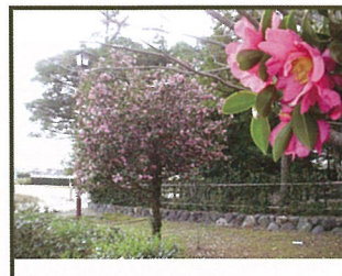
「サザンカ(齋王の森)」 春が近づくと、カーペットのように地面に散る様子も鮮やかです。