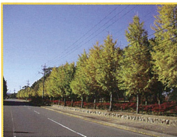
「イチョウ並木とドウダンツツジ」 博物館前の県道沿いが、黄と赤に彩られる景観は、落ち着いた晩秋の季節の訪れを感じます。