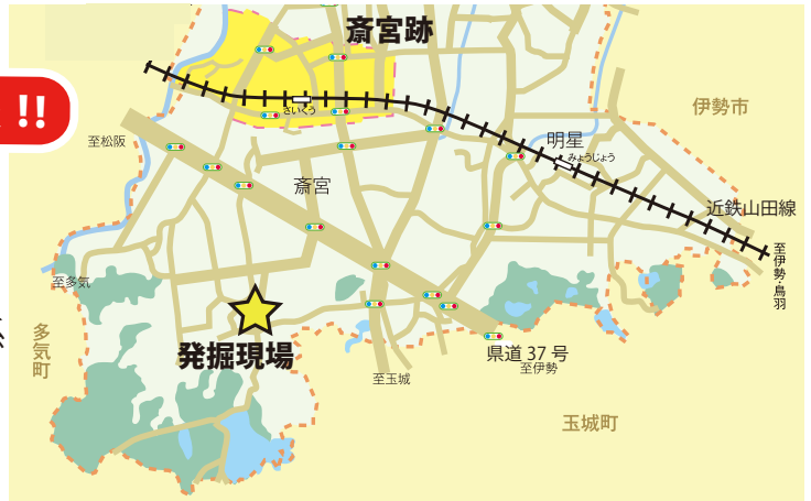
はじきしょうせいこう