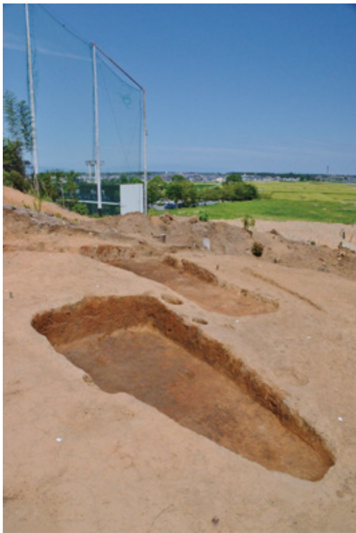
見つかった焼成坑、田んぼの向こうに齋宮跡が見えます

今回の調査で見つかった焼成坑を加えると、戸峯A・B遺跡では合計 132 基にのぼり、北野遺跡の 228 基に次いで町内で2番目に多い数です。また、町内でこれまでに見つかった焼成坑は、572 基（平成 29 年 11 月現在）で、三重県内でもほとんどが明和町に集中しています。