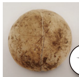
杯の底にヘラで記号が描かれています。 生産地を示すものでしょうか。

はくり 焼成坑からは、表面が剥離するなど失敗品 と思われる土器も出土しています。