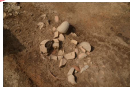
溝から大量に出土した土器