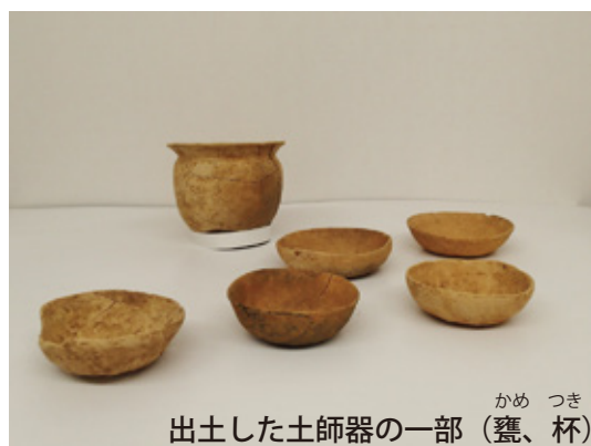
かめ つき 出土した土師器の一部 (甕、杯)