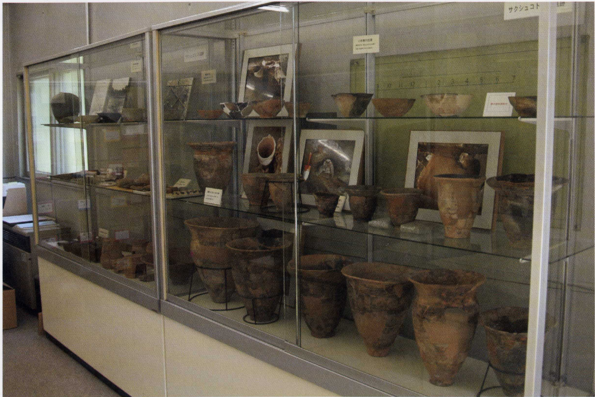
▲展示室に並べられている擦文土器 恵迪寮地点から出土したもの