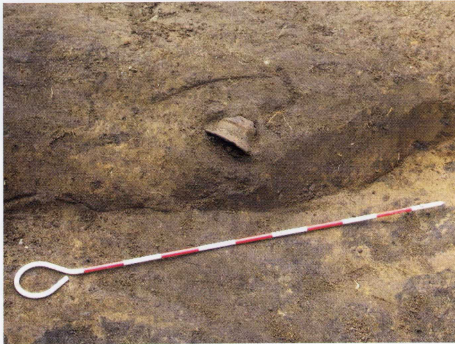
▲地中から擦文土器が発見されたときの状況