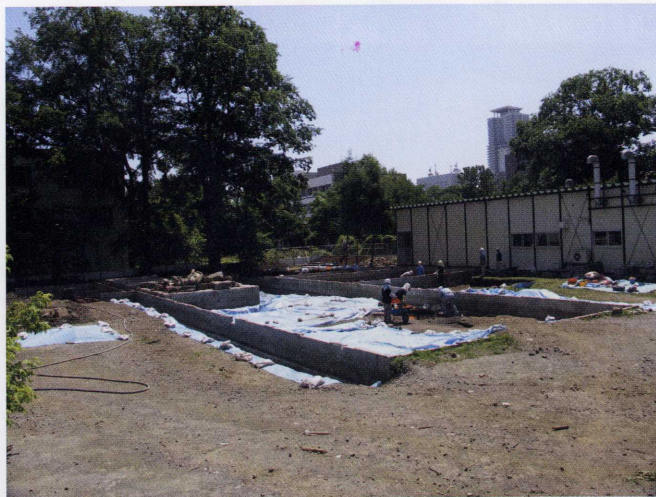
▲発掘調査遠景 北西より

発掘調査では、地下に埋まっている埋蔵文化財を慎重に掘り出し、詳細な記録をとっていくことが必要となります。人為的に動かされたと思われる表層の土をバックホーなどで取り除いたあと、自然に堆積した土を手作業で根気強く掘り下げていくと、現地表下約90cmの深さに擦文文化の頃に堆積した黒色土層が姿を現してきました。