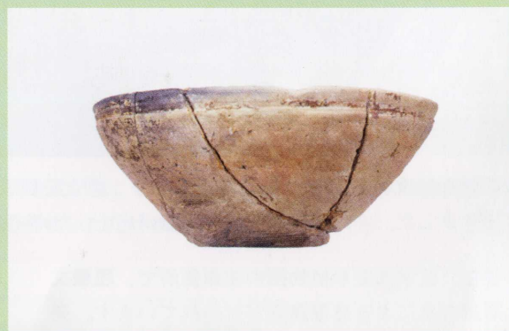
▲擦文土器 坏（つき）と呼ばれるもの

北海道を中心にして、およそ7世紀から13世紀頃にかけて広がっていた文化のことです。土器の表面に擦った跡がみられることが、名前の由来です。擦文文化を残した人々は、河川の河口部や内陸の小河川沿いに集落をかまえ、カマド付きの竪穴住居に暮らしていました。主要な利器は、石から鉄を素材とするものに切り代わっており、アワ・ヒエなどの雑穀農耕や河川でのサケ・マスなどの漁撈活動がさかんにおこなわれていたことがわかっています。