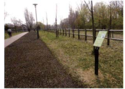
サテライトNo.10 エルムトンネル地点 (擦文文化の木製道具)

擦文中期の竪穴住居址(10世紀頃)は、屋 根や壁の木材が燃えて炭化した状態で発見 された。住居址内からは、炭化した種子が見 つかっている。