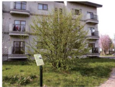
サテライトNo.9 桑園国際交流会館地点 (農場の遺跡)

に散在する自然・遺跡・建造物・民俗行事などを、サテ 「民俗遺産」として認識・研究・整備・保護して、そ 地域生活・地域文化を活性化し、よりよい状態で次世 体の総体です。この「人類遺跡トレイル」は、キャン あるキャンパス・エコミュージアム構想の一環として ミュージアムを中継地点として、情動的にネットワーク