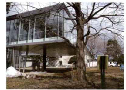
サテライトNo.16 工学部共用実験研究棟地点 (川辺のキャンプ場と集落遺跡)

出土した木柱列は、17世紀頃に作られた、川 の流れをせき止めて魚を捕獲する定置漁撈施 設であったと考えられる。