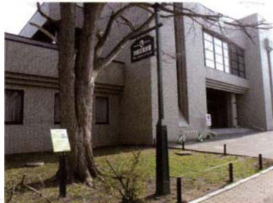
サテライトNo.6 学術交流会館地点 (北大式土器と小竪穴)

続縄文後半期の土坑墓7基と屋外炉址が見つかった。第1号墓からはガラス玉、第4号・第5号墓からは滑石製の平玉が出土した。