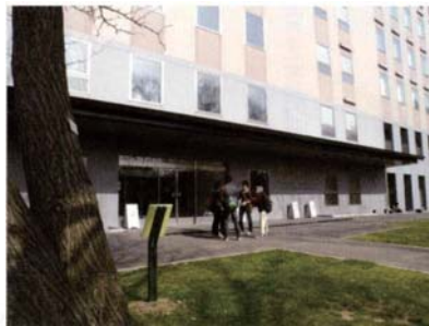
サテライトNo.13 人文・社会科学総合教育研究棟地点 (キャンプ地から集落遺跡へ)

縄文後半期の屋外炉址が発見されたほか、 擦文文化の住居址の存在が確認され、現状の まま保存されている。