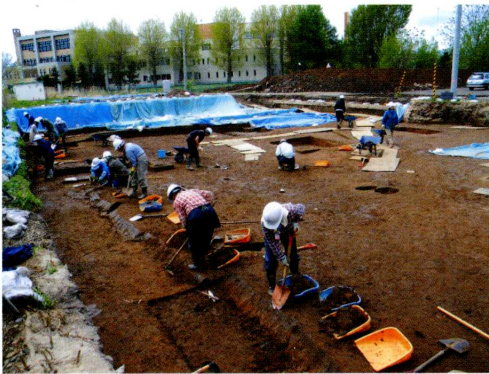
▲K435遺跡 南新川国際交流会館地点発掘調査の様子

調査の成果は、現地説明会や調査室のホームページ（URLは下記参照）で随時、お知らせします。