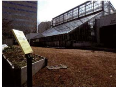
サテライトNo.4 農学部附属植物園地点 (集落遺跡と湧泉地)

「夫」の字が刻まれた東北地方で制作された環が出土した。埋没していたセロンペツ川には、幅12mにわたって定置漁撈施設として利用された木柱列が残されていた。