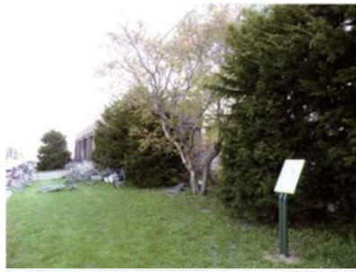
サテライトNo.2 サークル会館地点 (土師器の系統を引く擦文土器)

明治～昭和にかけての調査で、住居址と思われるくぼみが多数確認され、現在でも地表から観察できる。