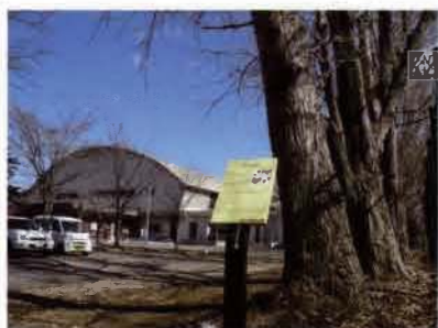
サテライトNo.7 学生部体育館地点 (後北C2-D式土器)

続縄文終末の北大Ⅲ式の深鉢形土器(7世紀頃)が出土した。小竪穴は住居址の可能性が考えられる。