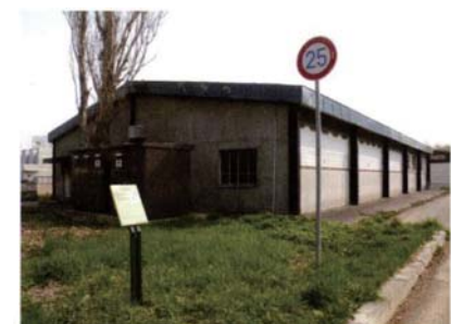
サテライトNo.12 第2農場倉庫地点 (川辺のキャンプ場)

擦文前期から後期にかけて継続する集落遺 跡。埋没河川(旧河道)からは舟材・わらじ・か んじきなど、多数の木製道具が発見された。