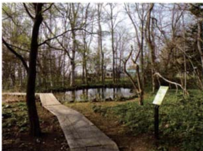
サテライトNo.5 ポプラ並木東地区地点 (ガラス玉と滑石製平玉)

セロンペツ川の源流となっていた湧泉地の周囲に、集落が展開していたと考えられる。現在でも地表面できぼみとして観察できる竪穴住居址が3基ある。