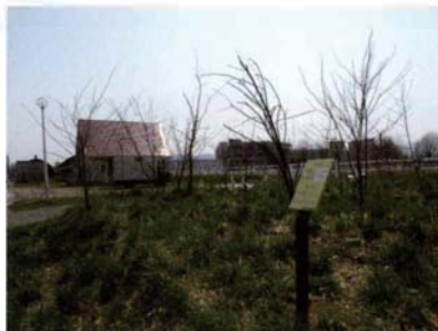
サテライトNo.11 K435遺跡馬場地点 (保存された竪穴住居址)

農地改良のためのプラウ耕(表土の切削・反 転・砕土)の痕跡が見つかった。畜力プラウで なく、トラクタプラウによるものと考えられる。