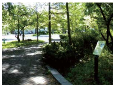
サテライトNo.8 ゲストハウス地点 (2000年前のキャンプ地)

続縄文後半期の後北C2-D式土器がまとも出土した。屋外炉址からは、石器、動物骨の小片や植物の種子などが発見された。