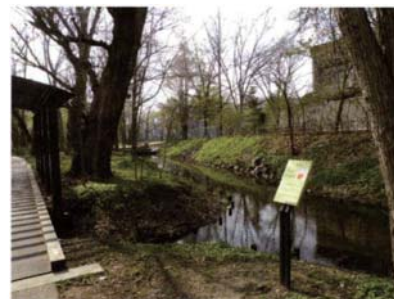
サテライトNo.15 弓道場地点 (焼失住居址)

縄文晩期の季節的なキャンプ場から縄文 前半期の竪穴住居や土坑墓を伴う集落へと 変遷する過程が明らかになった。