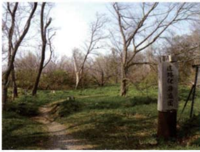
サテライトNo.1 遺跡保存庭園地点 (川の合流点に展開する集落)

明治～昭和にかけての調査で、住居址と思われるくぼみが多数確認され、現在でも地表から観察できる。