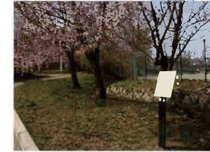
サテライトNo.14 付属図書館本館北東地点 (川辺に打ち込まれた木柱列)

調査区東側で発見された埋没河川(旧河道) に面して、屋外炉址・焼土粒集中・炭化物集中 が発見された。