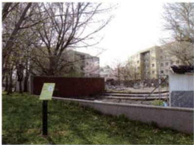
サテライトNo.3 恵迪寮地点 (刻書土器)

「夫」の字が刻まれた東北地方で制作された環が出土した。埋没していたセロンペツ川には、幅12mにわたって定置漁撈施設として利用された木柱列が残されていた。