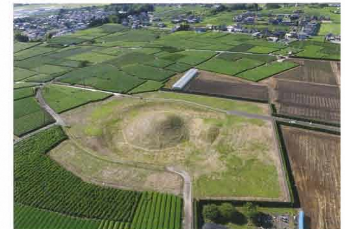
吉岡大塚古墳 工事着手前 北から

30年度は、墳丘の造成工事に着手します。古墳を保護するために盛土をし、古墳が造られた当時の姿を部分的に復元していきます。