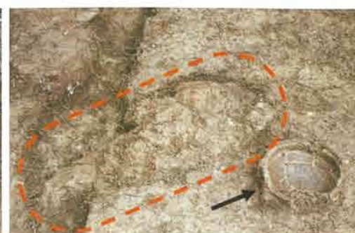
竪穴住居跡内 焼土・土器