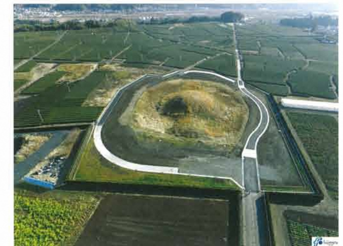
29年度工事終了 西から