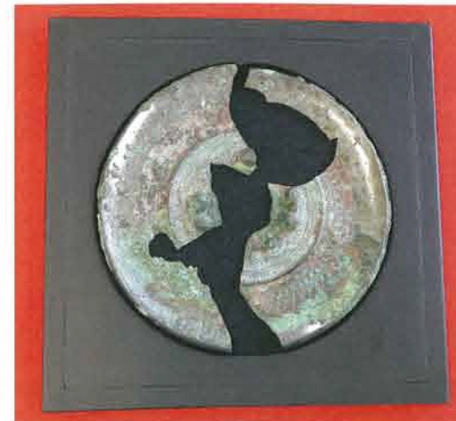
保存処理された変形獣文鏡

西岡津古墳は直径約13mの円墳で、鏡は開墾によって発見されました。古墳は昭和41年(1966)、東名高速道路建設に先立ち調査され、ガラス小玉、鉄斧、須恵器片 すえき が出土しました。古墳時代中期末(5世紀末)に造られたと考えられています。