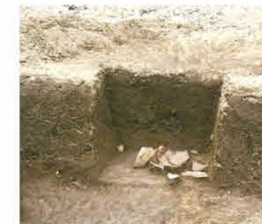
竪穴住居跡2内出土土器