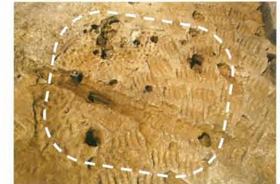
竪穴住居跡1 南から