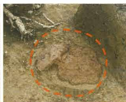
竪穴住居跡内 炉跡