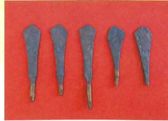
保存処理された鉄鍬

昭和57年に保存処理を行いました さび が、30年以上経過し錆が進んできたため、平成28年、29年度の2ヶ年で鉄鍬 てつこ 、鉄銚 てつほこ 、鉄斧 てつぼ の再処理を行いました。