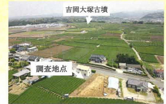
調査地点全景 南から

今回の調査で見つかった土器は少ないですが、壺や甕、高坏の破片が見つかりました。甕は煮炊き、壺は食べ物の貯蔵、高坏は食べ物などを盛り付けるために使われたと考えられています。その他に、祭祀に使われたと考えられている小型の土器の破片や、漁網の重りに使われた土錘などが見つかりました。