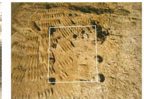
掘立柱建物跡 北から

めいわ 明和7年(1722)5月21日(陰暦)、現在のながやこでがや 地区において銅鐸一口が発見され、掛川藩に届け出されました。掛川市教育委員会では、この日を記念して、市民の埋蔵文化財に対する理解と保護・保存しようとする意識の向上を願い、出土文化財展を開催しています。