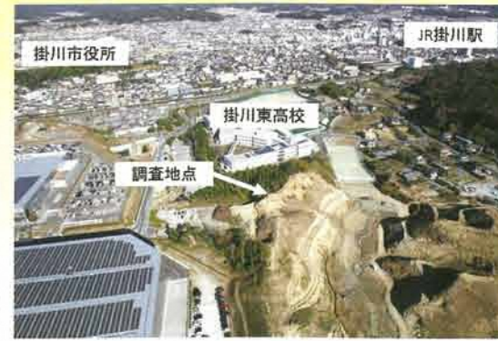
調査区遠景 南から

発見された竪穴住居跡は、出土した土器から平成9年度の調査で発見された竪穴住居跡と同時期のものであり、集落がさらに南まで展開していたことがわかりました。竪穴住居跡内からは煮炊きに使われた炉や土器が見つかりました。今回発見された竪穴住居跡の特徴として、一般的な竪穴住居跡にみられる、4本の柱を立てた穴が見つかりません。平成9年度の調査で発見された竪穴住居跡からは見つかりしている点が興味深いところです。また、調査地中央付近では幅1.5m程の溝が、尾根を断ち切る方向で2本並んで発見されました。この溝を境に、南側では住居跡は存在しなかったことから、居住区の境を示すための溝だった可能性が考えられます。