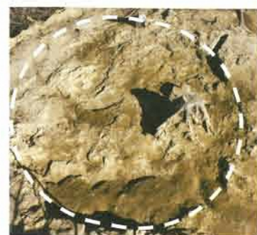
竪穴住居跡 南から