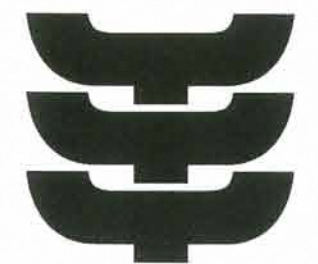
文化財愛護シンボルマーク

めいわ 明和7年(1722)5月21日(陰暦)、現在のながやこでがや 地区において銅鐸一口が発見され、掛川藩に届け出されました。掛川市教育委員会では、この日を記念して、市民の埋蔵文化財に対する理解と保護・保存しようとする意識の向上を願い、出土文化財展を開催しています。