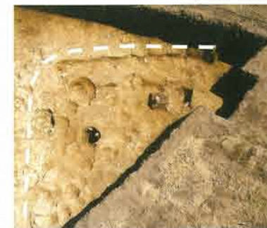
竪穴住居跡2 北西から