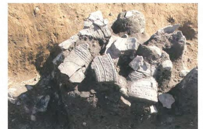
深鉢形土器が出土した様子