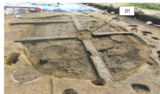
弥生時代後期の竪穴住居跡