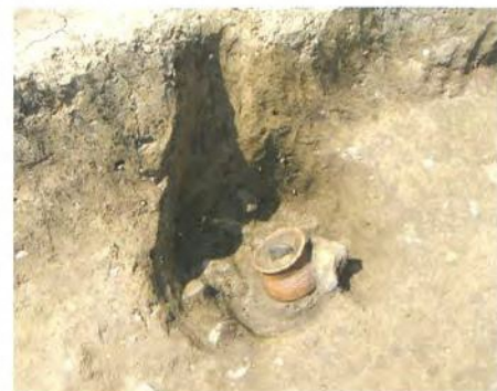
壺の出土した様子