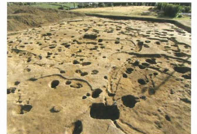
重なり合う竪穴住居跡