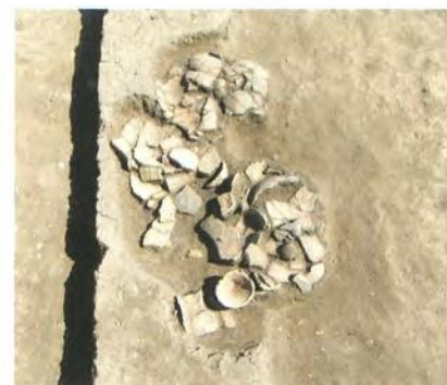
壊れた状況で出土した甕

盛り付け用の高坏 たかつき が出土しました。住居跡は、重なり合って確認され、同じ場所で建て替えが行われていたと考えられます。