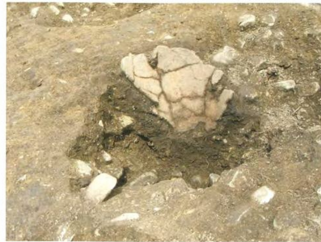
縄文時代早期の土器出土の様子