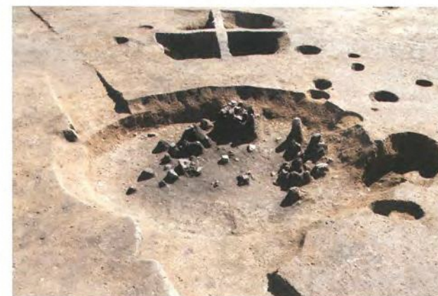
竪穴住居跡の土器が出土した様子