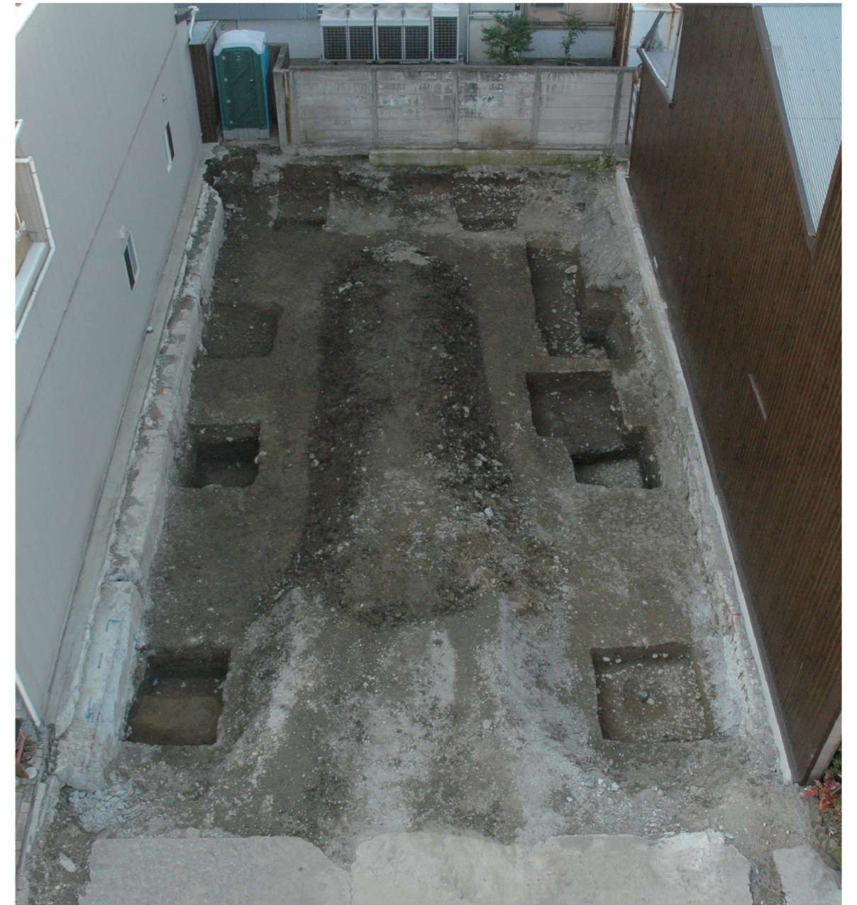
調査地全景(東から)

編 集 姫路市埋蔵文化財センター 〒671-0246 兵庫県姫路市四郷町坂元 414番地1 発 行 姫路市教育委員会 〒670-8501 兵庫県姫路市安田四丁目1番地 発 行 日 平成25年(2013年)3月31日 印刷・製本 松尾印刷株式会社 〒671-0222 兵庫県姫路市別所町小林494