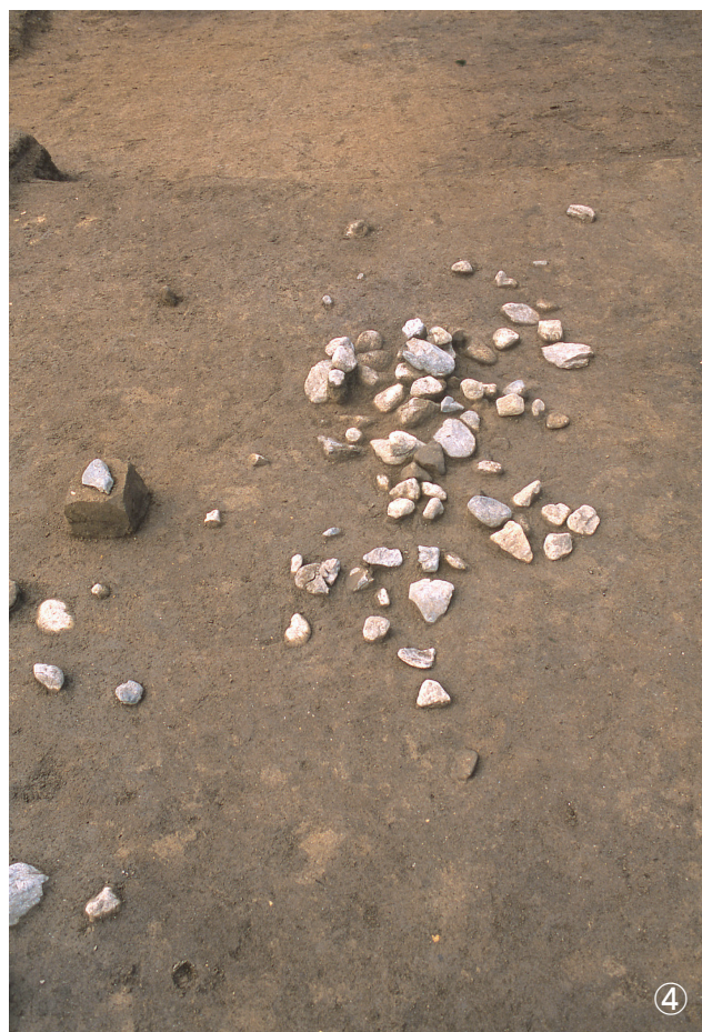
①集石 56号・集石 68号 検出状況 (56号写真左部・68号写真右部) ②集石 57号 検出状況 ③集石 59号 検出状況 ④集石 58号 検出状況