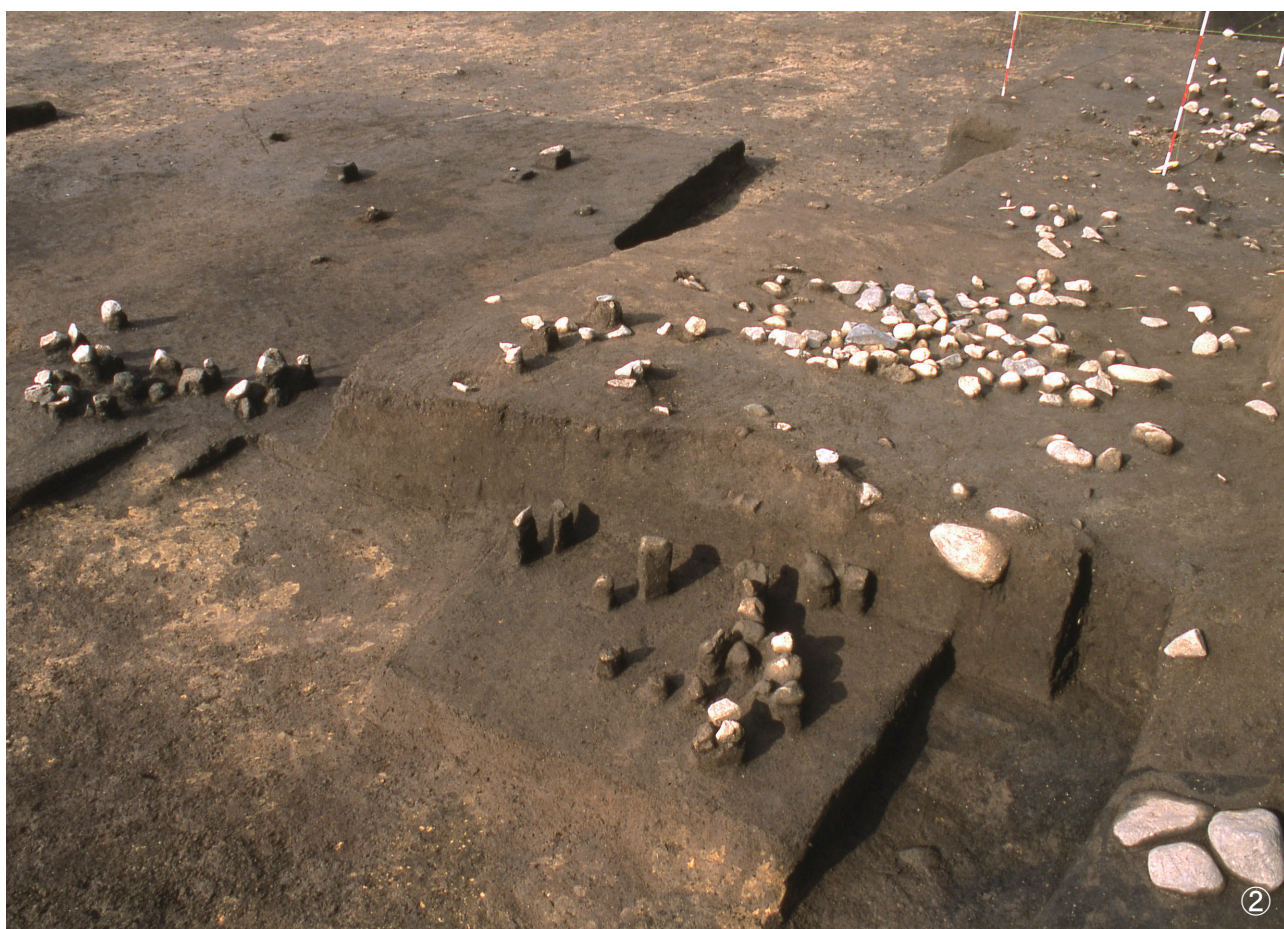
①集石 17号・集石 18号・集石 19号 検出状況（17号写真右下・18号写真中央下部・19号写真右上部） ②集石 20号 検出状況（写真下部）