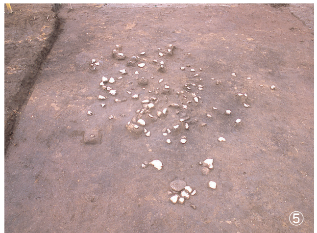
①集石 79号 検出状況 ②集石 80号 検出状況 ③集石 81号・集石 97号 検出状況 (81号写真中央部・97号写真左上部) ④集石 82号 検出状況 ⑤集石 83号 検出状況