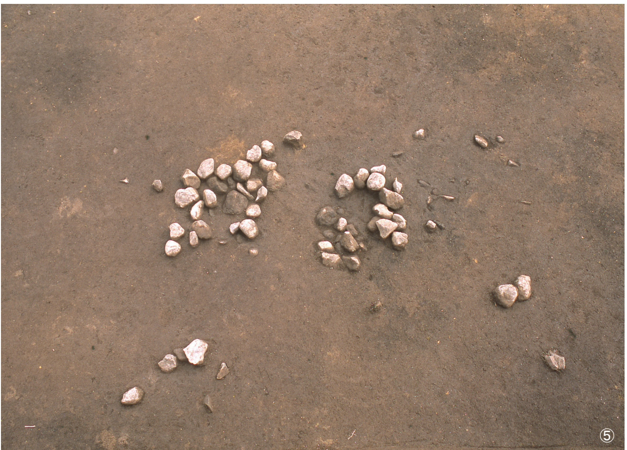
①集石 67号 検出状況 ②集石 69号 検出状況 ③集石 70号 検出状況 ④集石 71号 検出状況 ⑤集石 72号・集石 101号 検出状況 (72号写真左部・101号写真右部)