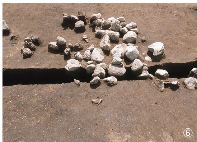
①集石 84号 検出状況 ②集石 86号 検出状況 ③集石 89号 検出状況 ④集石 90号 検出状況 ⑤集石 91号 検出状況 ⑥集石 92号 検出状況