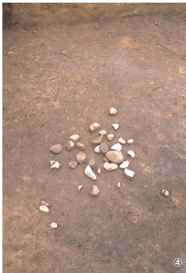
①集石7号 検出状況（写真下部） ③集石11号 検出状況