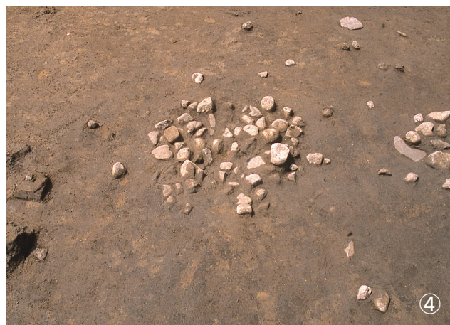
①集石 48号 検出状況 ②集石 53号 検出状況 (53号写真上部) ③集石 52号 検出状況 ④集石 55号 検出状況