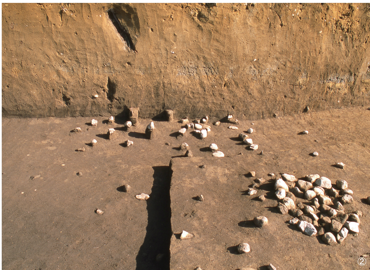
①集石 21号・集石 24号・集石 175号 検出状況 (21号写真左下部・24号写真右部・175号写真中央右部) ②集石 26号 検出状況 (写真中央部)