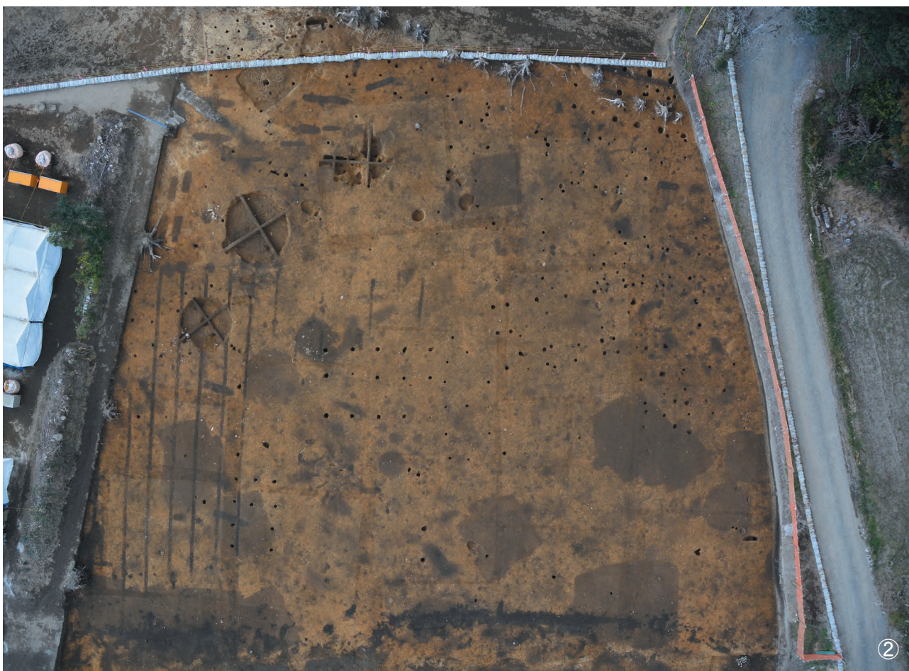
①遺跡遠景（手前 川久保遺跡 ・ 奥 小牧遺跡） ②A地点 北西部