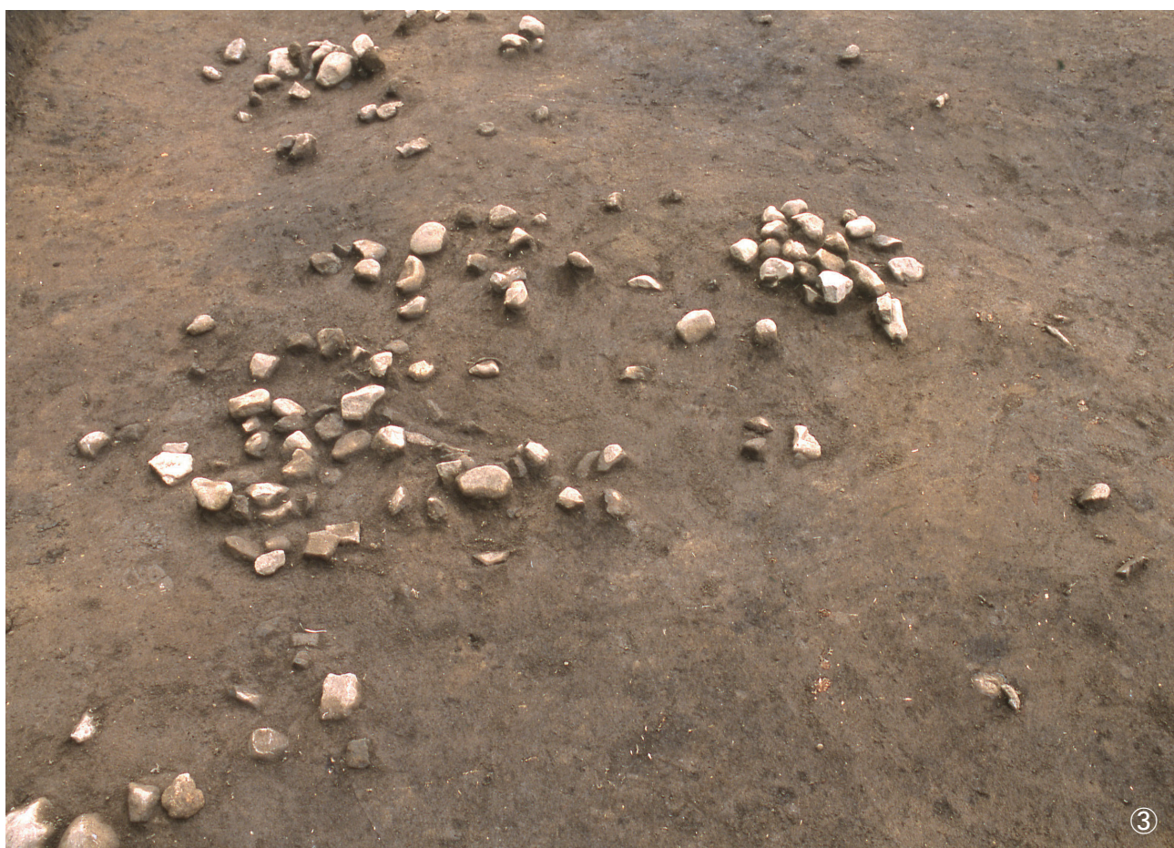
①集石 14号 検出状況 ②集石 16号 検出状況 ③集石 15号 検出状況 (写真 中央右側)