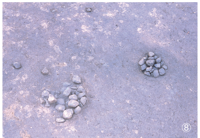
①集石 35号 検出状況 ②集石 36号 検出状況 ③集石 37号 検出状況 ④集石 38号 検出状況 ⑤集石 39号 検出状況 ⑥集石 40号 検出状況 ⑦集石 41号 検出状況 ⑧集石 42号・集石 43号 検出状況 (42号写真右部・43号写真左部)