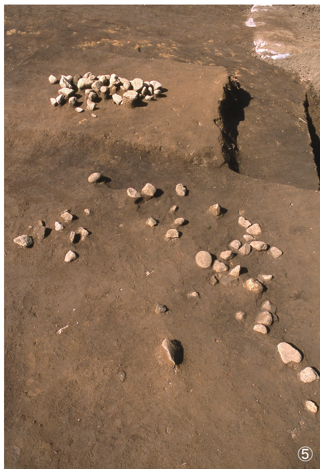
①集石 93号 検出状況 ②集石 99号 検出状況 ③集石 94号 検出状況 ④集石 95号 検出状況 ⑤集石 98号 検出状況