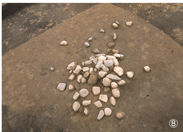
①集石 25号 検出状況 ②集石 28号 検出状況 ③集石 29号 検出状況 ④集石 30号 検出状況 ⑤集石 31号 検出状況 ⑥集石 32号 検出状況 ⑦集石 32号 半掘状況 ⑧集石 34号 検出状況