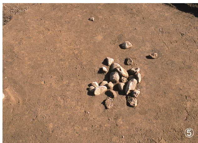
①集石 73号・集石 76号・集石 149号 検出状況 (73号写真右部・76号写真左下部・149号写真左上部) ②集石 74号 検出状況 ③集石 75号 検出状況 ④集石 77号 検出状況 ⑤集石 78号 検出状況