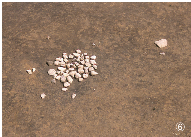
①集石 60号 検出状況 ②集石 61号 検出状況 ③集石 62号 検出状況 ④集石 63号 検出状況 ⑤集石 64号 検出状況 ⑥集石 66号 検出状況 ⑦集石 65号 検出状況