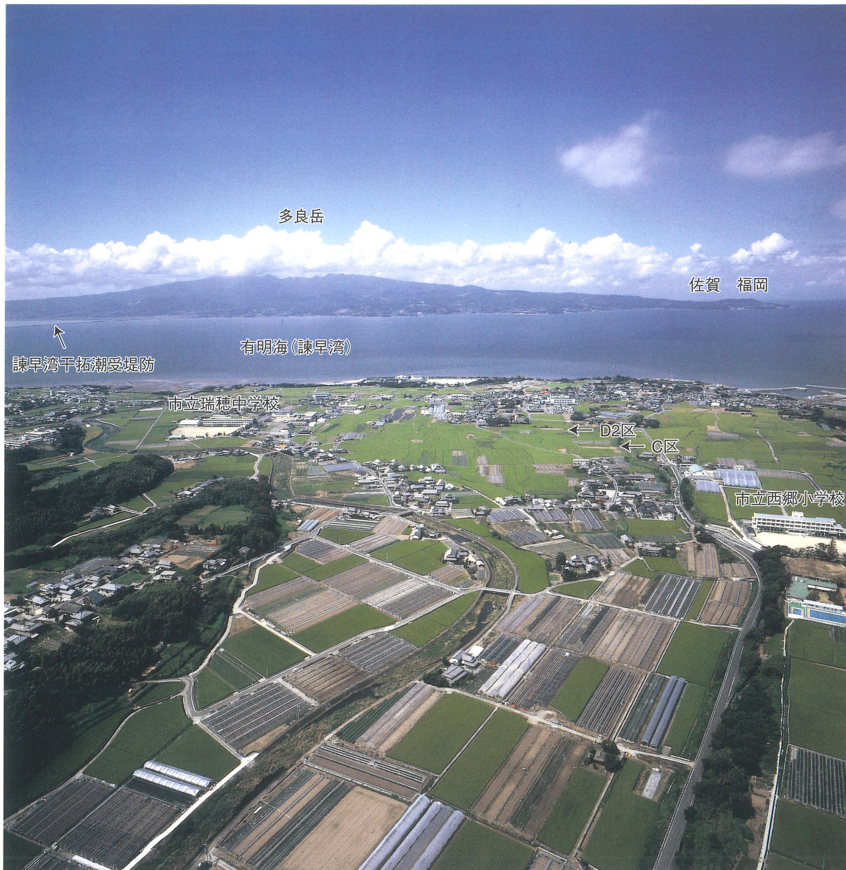
遺跡上空より有明海を望む（中央に流れる西郷川）