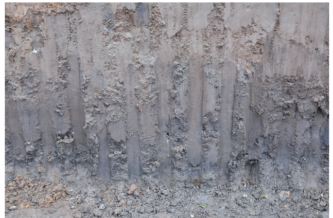
⑧ 東壁5層検出状況（南西から）