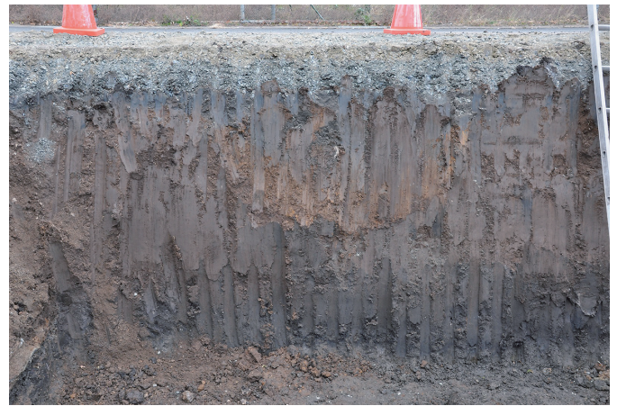
⑥ 東壁断面状況（南西から）