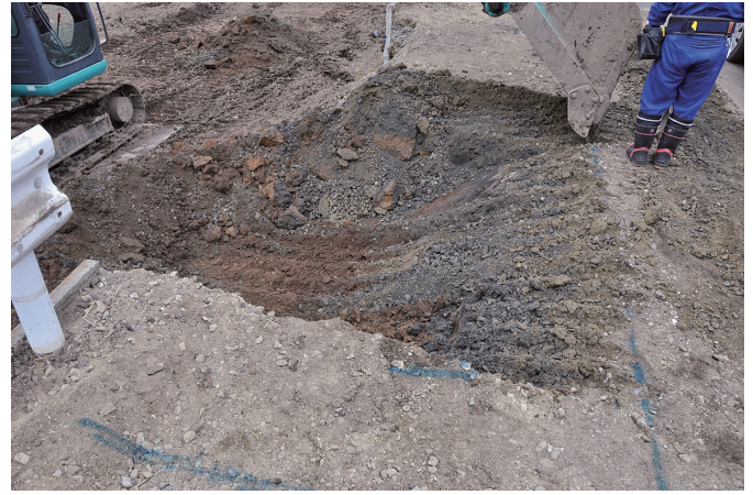
② 路盤掘削状況（南東から）