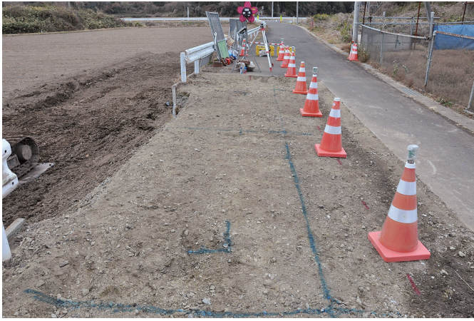
① 掘削前状況（南東から）