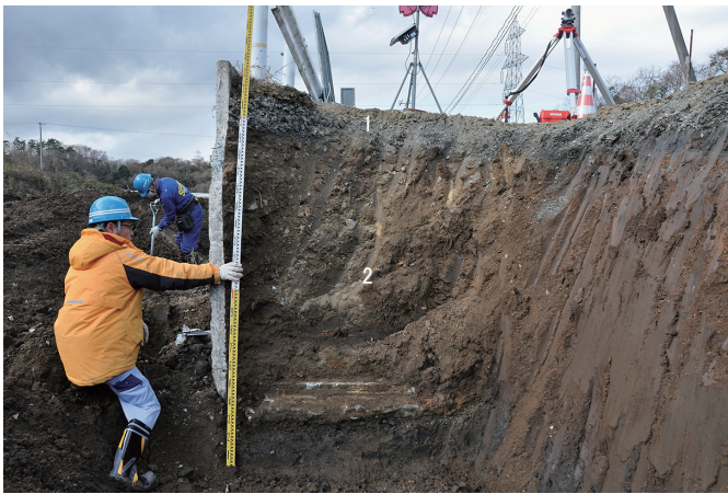
⑤ 北壁断面状況（南東から）