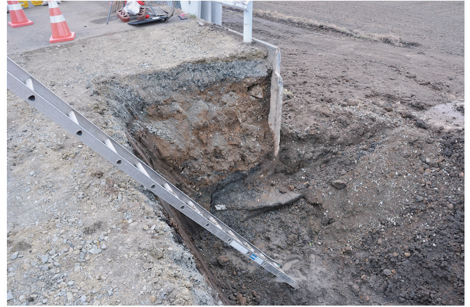
④ 南壁断面状況（北西から）