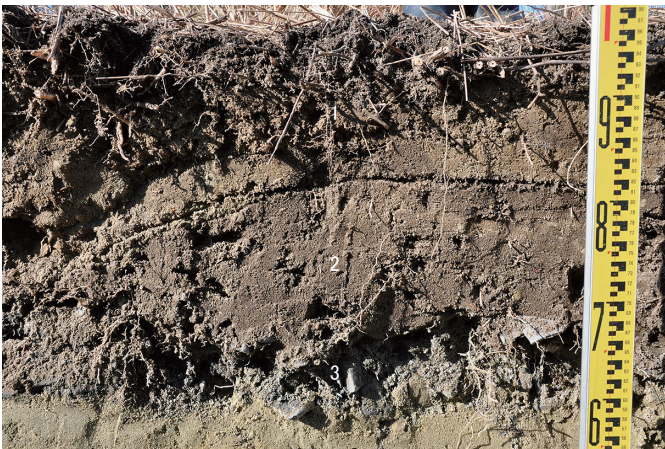
⑤ 27トレンチ 北壁1～3層状況（南から）