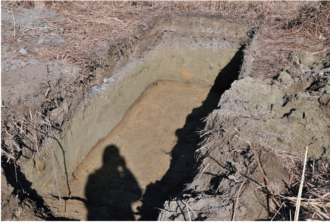
③ 27トレンチ 完掘状況（南西から）