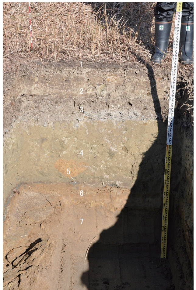
⑦ 27トレンチ 深掘東壁1～7層状況（西から）