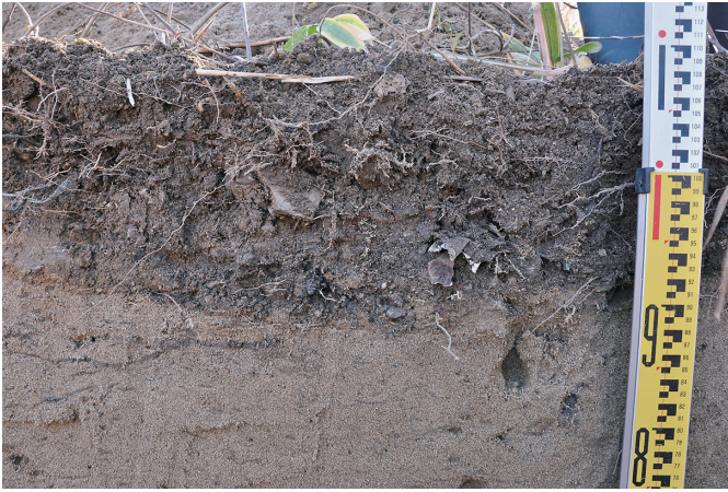
① 26トレンチ 南東壁1・2層上面状況（北西から）