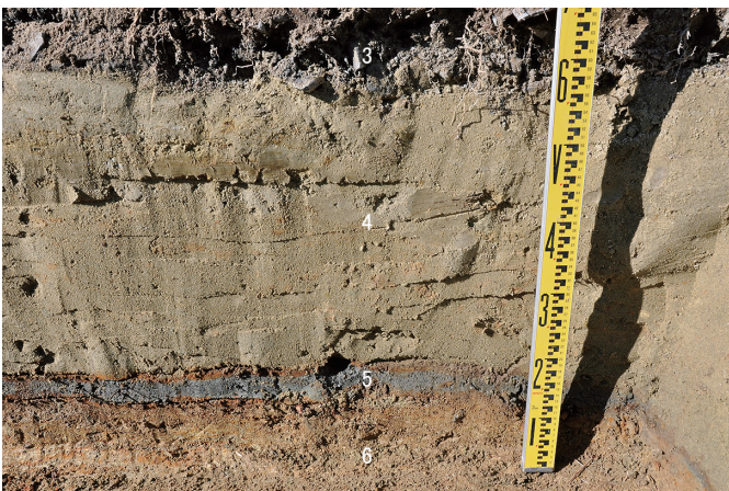
⑥ 27トレンチ 北壁3～6層状況（南から）