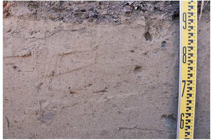
② 26トレンチ 南東壁2層状況（北西から）