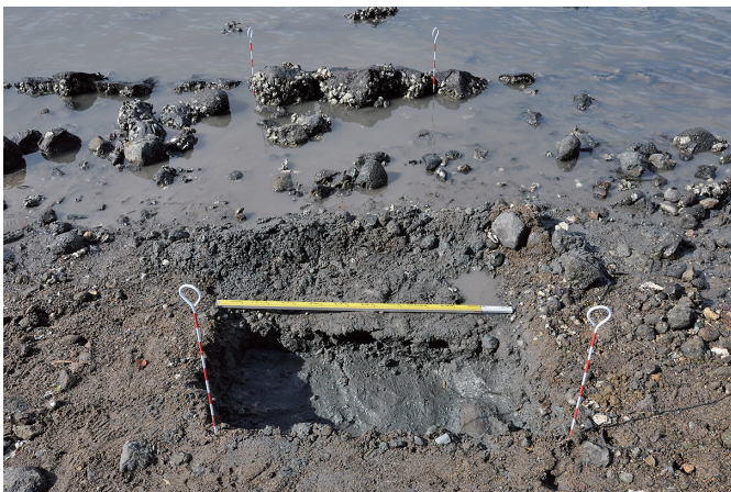
⑦ 1トレンチ 完掘状況（1）（東から）