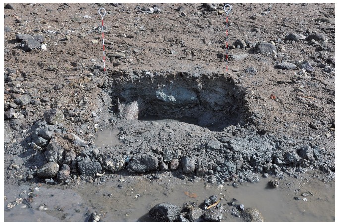
⑧ 1トレンチ 完掘状況（2）（西から）