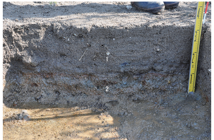
⑥ 2トレンチ 東壁断面状況（西から）