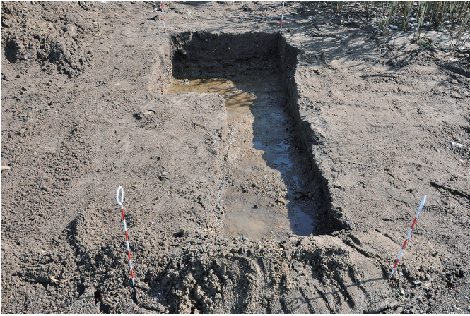
③ 2トレンチ 完掘状況（2）（西から）