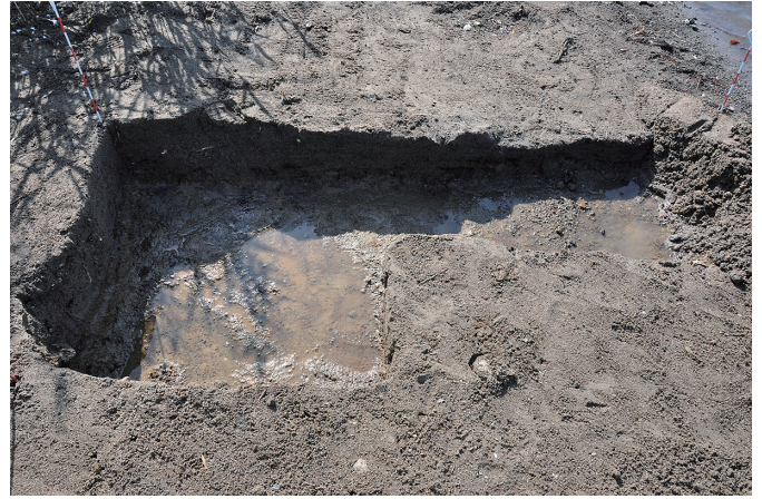
④ 2トレンチ 完掘状況（3）（北から）