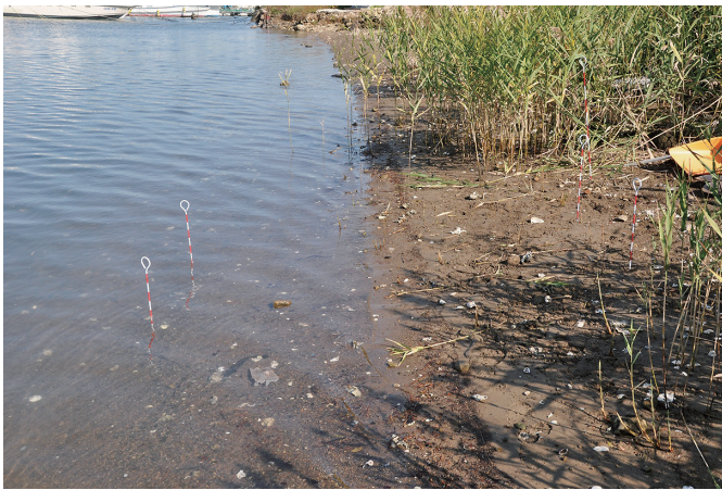
⑤ 2トレンチ 調査前状況（近景・南から）