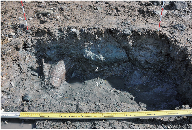
① 1トレンチ 東壁断面状況（西から）