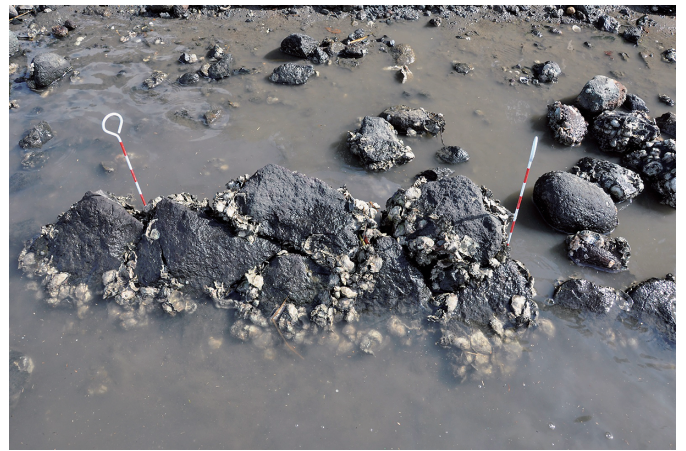
⑥ 1トレンチ 石積み露出状況（西から）