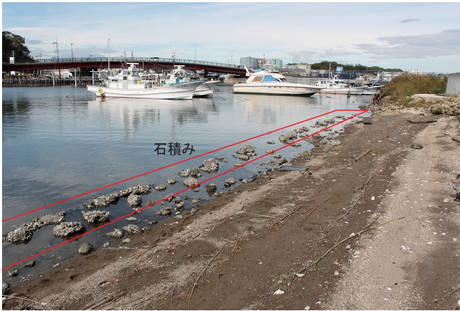
③ 2トレンチ付近 調査前状況（南東から）