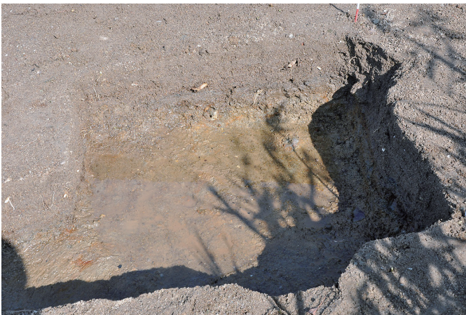
⑤ 2トレンチ 完掘状況（4）（南から）