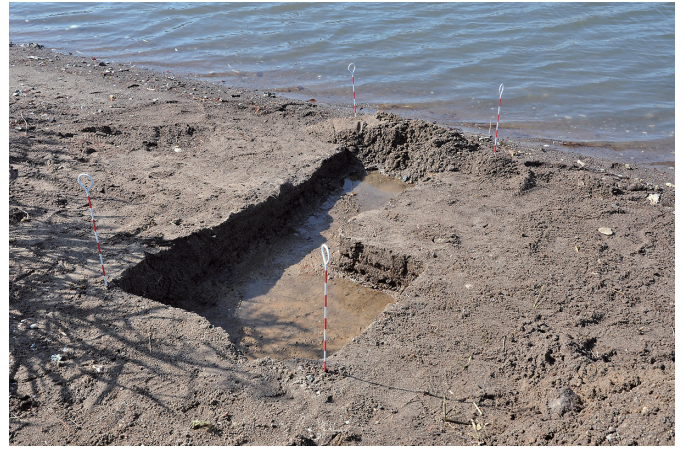
② 2トレンチ 完掘状況（1）（北西から）