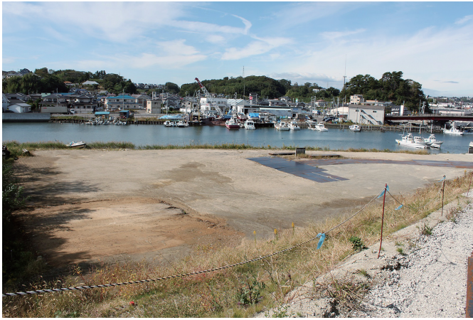
① 調査前状況（遠景・南東から）