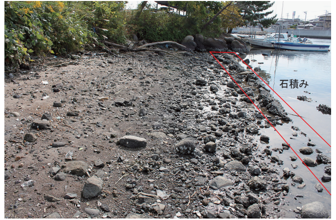
② 1トレンチ付近 調査前状況（北から）