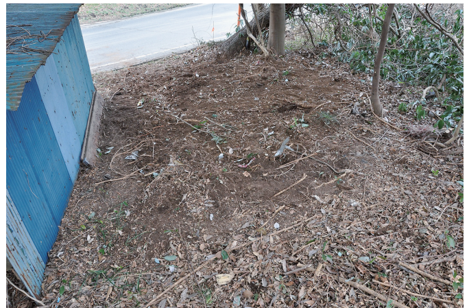
⑥ 8トレンチ 埋め戻し完了状況（南東から）