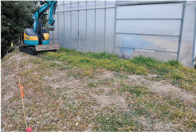
① 7トレンチ 調査前状況 (1) (南西から)