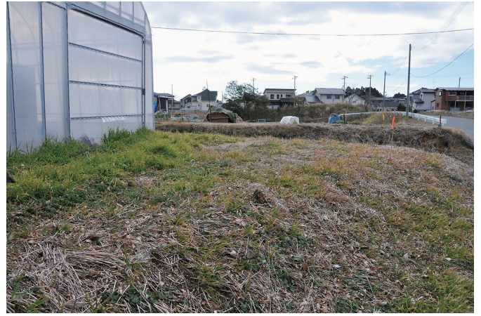
② 7トレンチ 調査前状況 (2) (北西から)