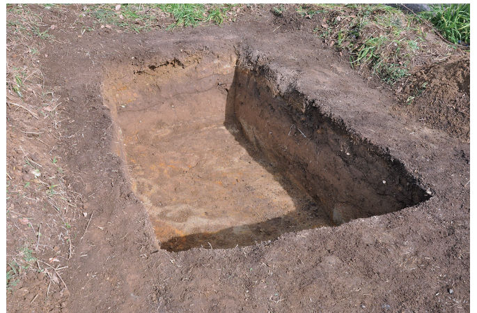
⑥ 7トレンチ 完掘状況 (2) (南西から)