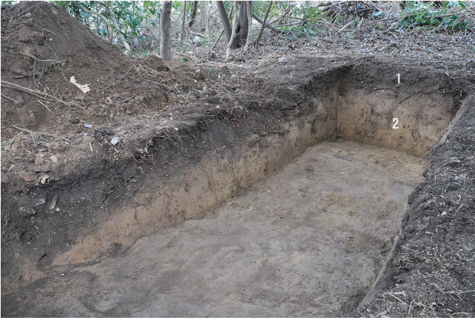
③ 8トレンチ 南東壁・南壁断面状況（西から）