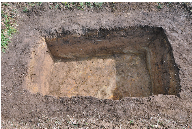
⑦ 7トレンチ 完掘状況 (3) (西から)