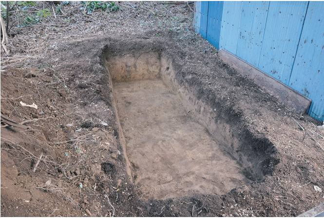
① 8トレンチ 完掘状況（北西から）