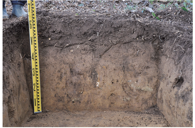
④ 8トレンチ 南東壁断面状況（北西から）