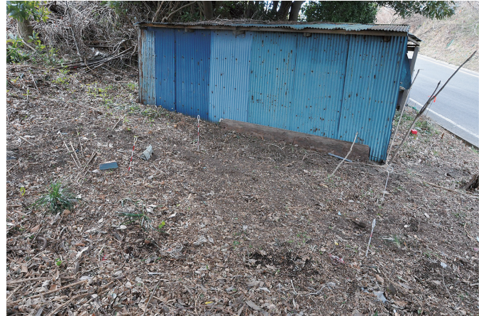
④ 8トレンチ 調査前状況 (2) (北から)