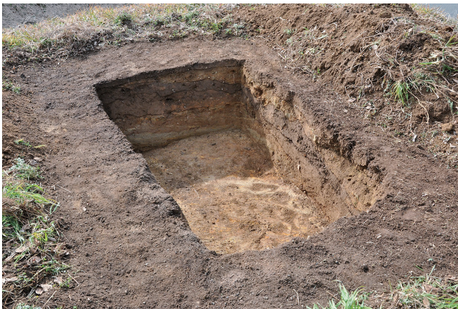
⑤ 7トレンチ 完掘状況 (1) (北東から)