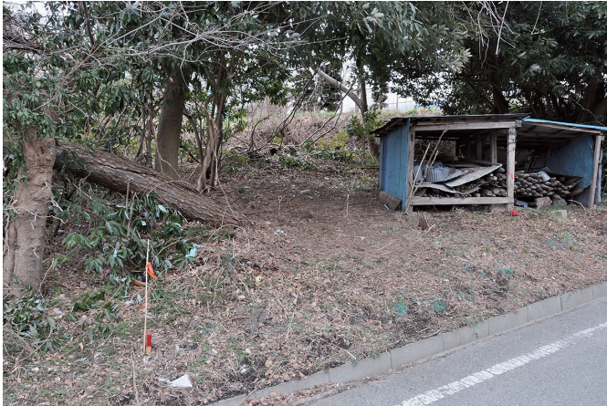
③ 8トレンチ 調査前状況 (1) (北西から)