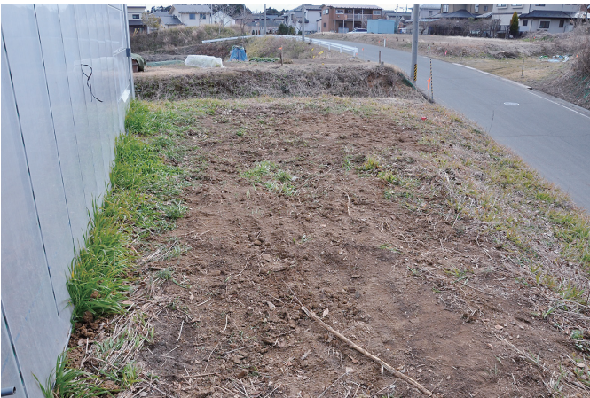
⑤ 7トレンチ 埋め戻し完了状況（北から）