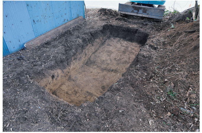
② 8トレンチ 完掘状況（東から）