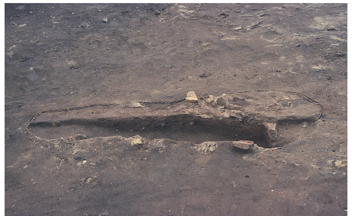
⑥ 3次調査 SL14炉跡断面状況（西から）