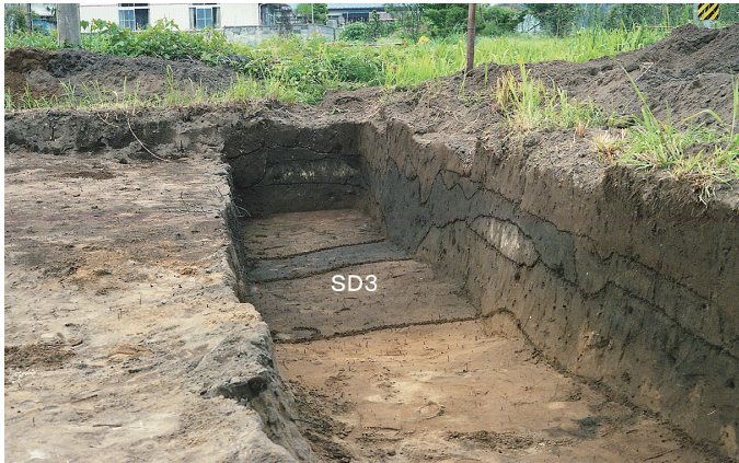
③ 2次調査 東トレンチSD3溝跡検出状況（南から）