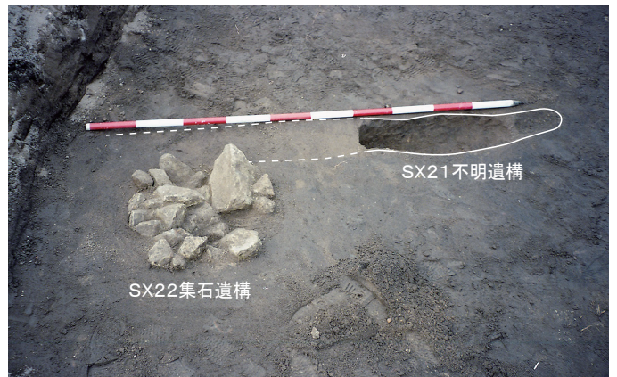
⑧ 4次調査 不明遺構・集石遺構検出状況（南から）