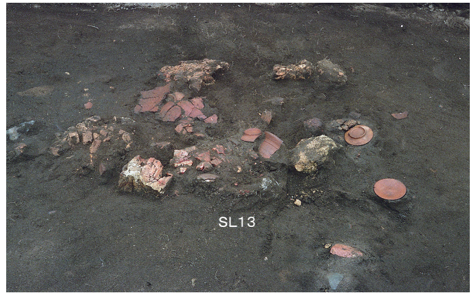
② 2次調査 SL13炉跡検出・遺物出土状況（東から）