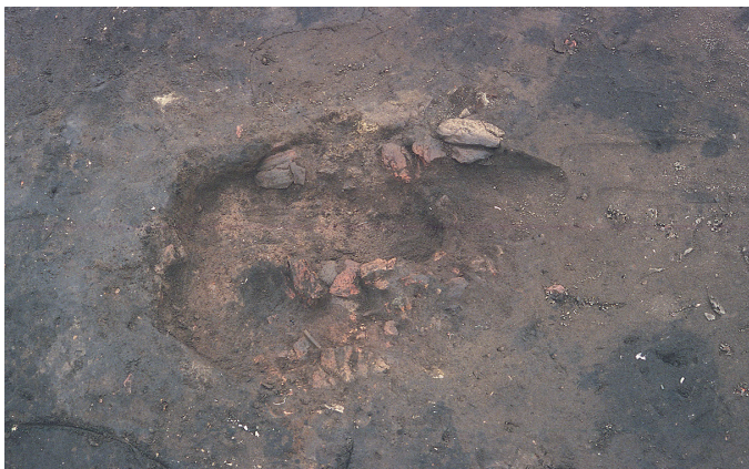
⑦ 3次調査 SL15炉跡完掘状況（南から）