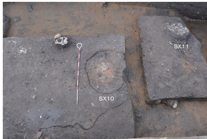
② 29トレンチ SX10・11検出状況（南東から）