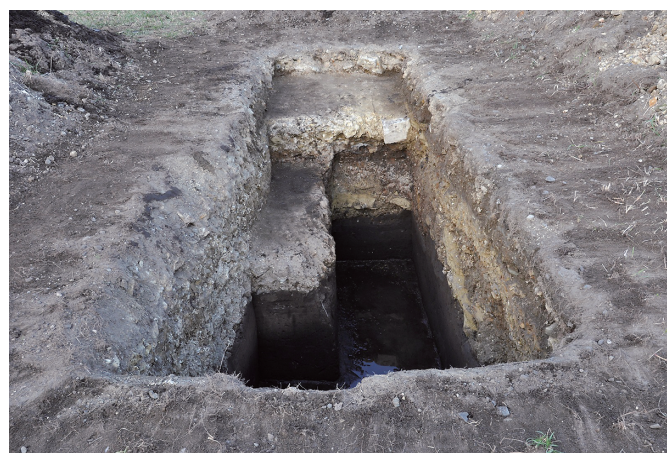
⑥ 31トレンチ全景（南西から）