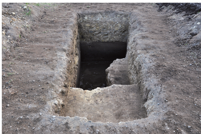
⑦ 31トレンチ全景（北東から）