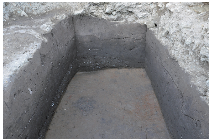
④ 30トレンチ 地山検出状況（南西から）