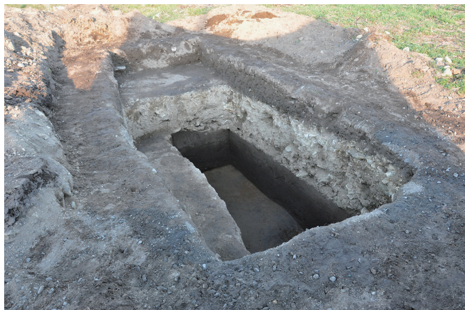
③ 30トレンチ全景（西から）