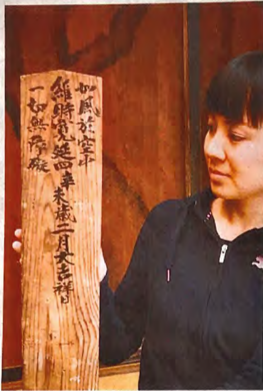
「寛延四年」の文字が確認できる棟札。西之表市の旧上妻家住宅

上妻家は島を治めた。床の間が板壁と種子島家の筆頭家老。子島特有の造りで、県住宅は木造一部2階建。内唯一の丸太造りの武