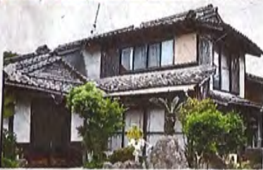
国登録有形文化財「旧上妻家住宅」

市は昨年、同住宅を2900万円で購入した。保存活用策を検討し、文化・観光施設として整備する計画。鉄砲館110997（23）3215。（山本輝志）