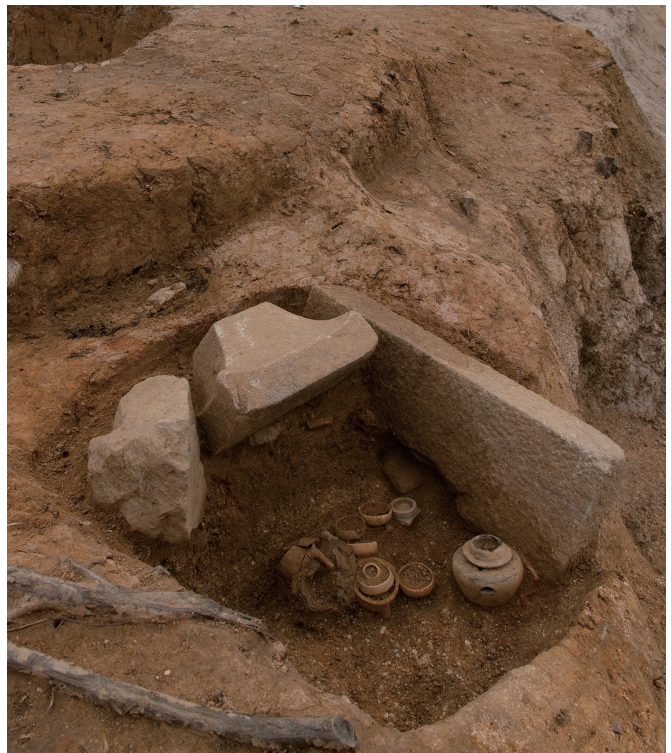
ミニチュア土器を副葬した墓

こどもの戒名を刻む「舟形五輪塔」 この火葬墓の東側約3 mの位置で検出された舟形五輪塔には「天正十七（1589）年 十月十日 尊壽童女」というこどもの戒名が刻まれていました。「童子」、「童女」といったこどもの戒名は、大和では16世紀に出現し、舟形五輪塔の増加と軌を一にして増加していきます。16世紀には墓塔の大量生産が可能となり、それに伴ってより下層の階層の人々が墓を造営することができるようになります。こどもの墓を造営できるのは、それでも一般