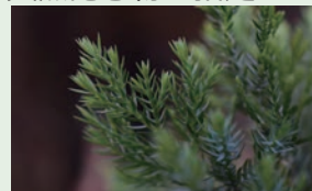
トゲトゲした若木の葉

ビャクシンは、イブキの別名で、ヒノキの仲間です。養分の少ない岩場などに生育している厳しい環境に強い植物です。大瀬崎には、樹齢数百年と言われるビャクシンの大木が多く生育し、昭和7年に国の天然記念物に指定されています。