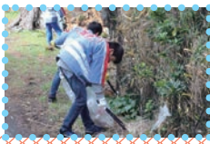
2020年1月の清掃活動と放水訓練の様子

令和3年1月23日(土)に天然記念物大瀬崎のビヤクシン樹林で防火訓練が行われました。昭和24年1月26日に、奈良県の法隆寺が火災によって一部焼けてしまったことから、文化財を火災などの災害から守ることを目的として1月26日を「文化財防火デー」としたもので、沼津市では大瀬崎のビヤクシン樹林において毎年1月下旬に防火訓練を行っています。