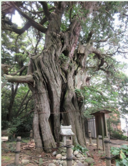
大瀬崎の先端にある御神木

ビャクシンは、イブキの別名で、ヒノキの仲間です。養分の少ない岩場などに生育している厳しい環境に強い植物です。大瀬崎には、樹齢数百年と言われるビャクシンの大木が多く生育し、昭和7年に国の天然記念物に指定されています。