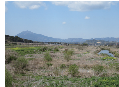
国道六号にかかる恋瀬橋から東雄がふるさとを思い眺めたと思われる恋瀬川と筑波山の風景