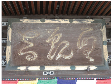
善応寺観音堂にかかげられてある「聖観音」の扁額

そのような影響もあってか、国学者としての東雄は、水戸藩をはじめ全国の尊攘派志士との交流も深まり、特に藤田東湖の門弟・櫻任蔵などはしばしば善応寺を訪れ、寝食を共にしたという。藤田からは水戸藩への出仕も勧められたが、「我既に主あり、二心あるべからず」とこれに応じなかった。