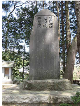
東雄神社境内の従四位記念碑

※参考・引用「八郷町史（平成17年3月25日 八郷町史編さん委員会）」、「佐久良東雄（昭和57年3月25日 八郷町教育委員会）」、「佐久良東雄伝（明治27年3月26日 佐久良巖）ほか」