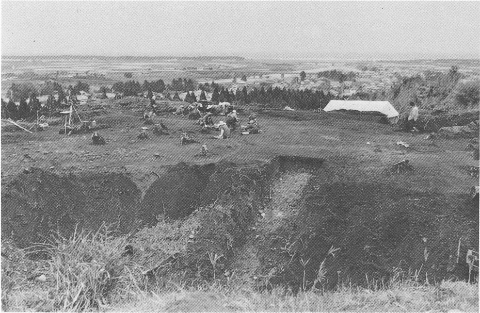
第2曲輪作業風景（南より）