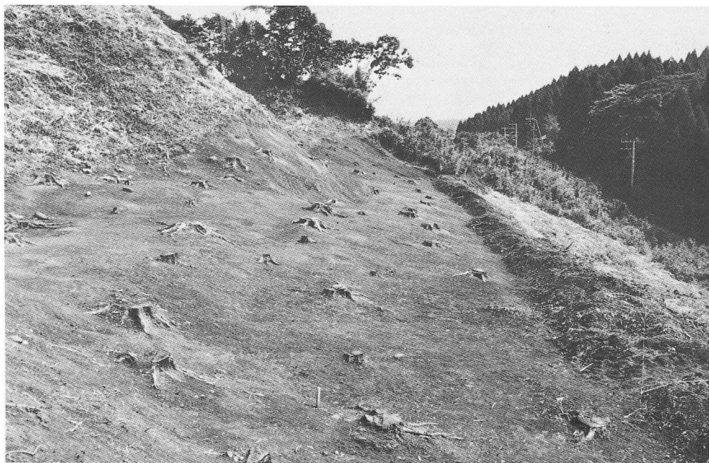
第1曲輪南側下方の平坦面