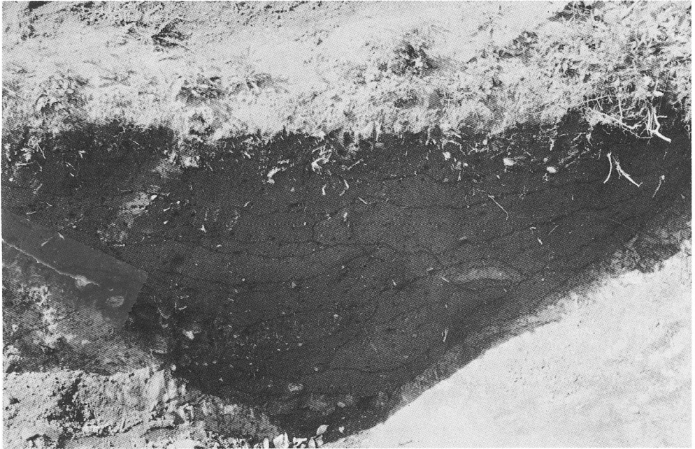
第6トレンチ南壁土層断面