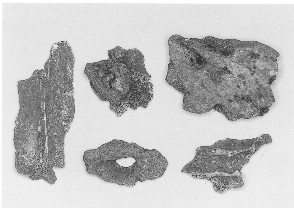
前頭骨、側頭骨および後頭骨の破片