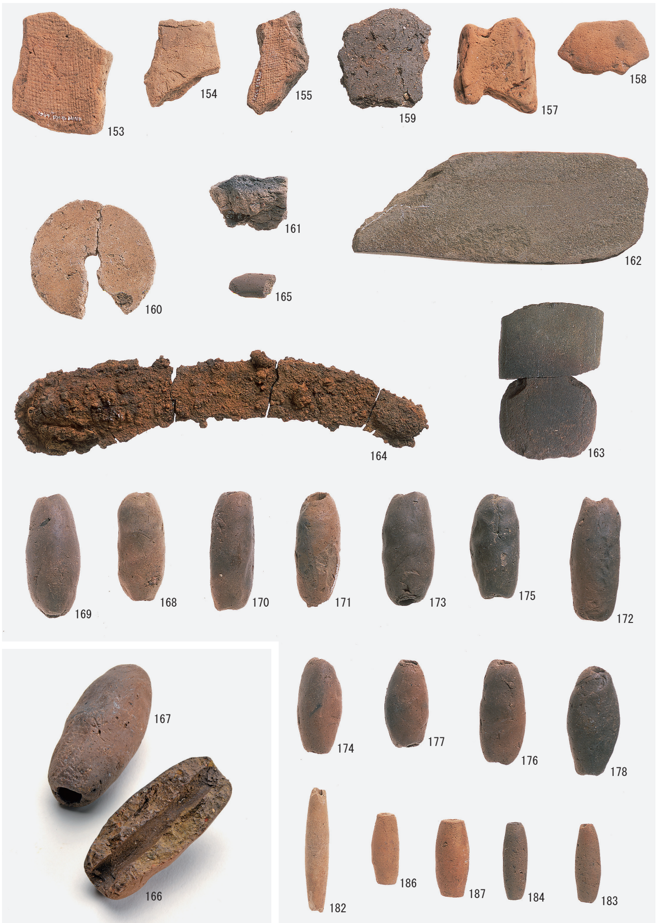
古代 I 期その他の遺物