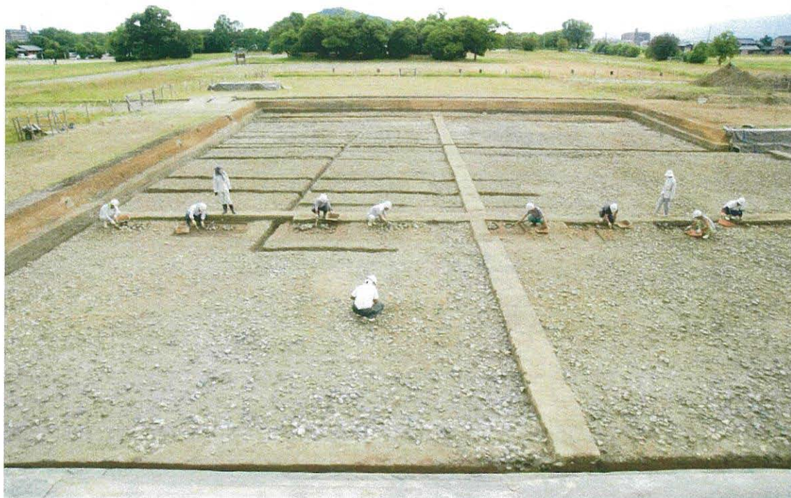
東西に並ぶ柱穴列（人が座って作業している場所）と大極殿(南から)

また、昨年の大極殿院南門の調査で確認した藤原宮造営時に資材を運んだ運河は、礫敷の下で調査区内を南北に通っていることがわかりました。これについては 7 月以降に調査を進めることとしており、詳細が判明した時点で改めて現地説明会を開催する予定です。