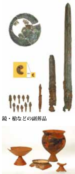
鏡・槍などの副葬品

発掘調査の際に剥ぎ取りを行った主体部や朱、主体部から出土した銅鏡などの副葬品、周溝などから出土した土器を展示するとともに、古墳の概要について解説しています。