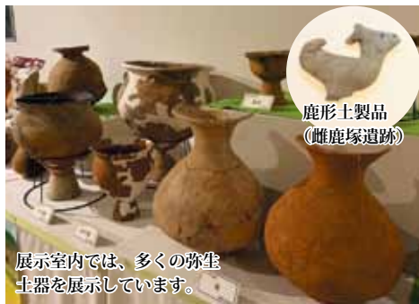
鹿形土製品 (雌鹿塚遺跡)

う。当センターに展示している鹿形土製品や鳥形木製品・鳥形土器もそのような願いを込めて作られていたのかもしれない。