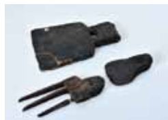
農耕具の鍬(くわ)や鋤(すき) (雌鹿塚遺跡)

沼津市では弥生時代の水田跡は発見されていませんが、西部の雌鹿塚遺跡からは稲作をしていたことを裏付け、鍬などの木製農耕具が出土しています。また、人々同士の争いが始まった時代でもあります。足高尾上遺跡群から出土した四角に溝を回した墓である「方形周溝墓」の出現などは、集団を統制した権力者のためのものと考えられ、後の古墳時代につながる権力者が誕生した時代でもありました。