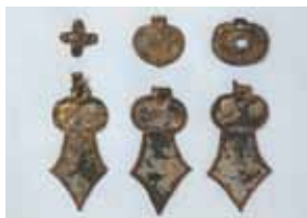
馬具（荒久城山古墳等）