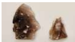
神津島産黒曜石製石器 (井出丸山遺跡)