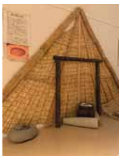
展示室内には竪穴住居をイメージしたものと当時の食糧事情について展示しています。

縄文時代も旧石器時代と同様、狩猟採集を生活基盤としていますが、この二つの時代を分ける特徴として、縄文時代からはじまる「土器」と「弓矢」の使用、そして「竪穴住居」の出現が挙げられます。沼津市内における縄文時代の遺跡にも、これらの特徴を示す多くの遺物や遺構が発見されています。