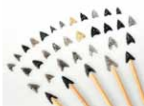
弓矢の矢先につけられた石鏃（せきぞく）