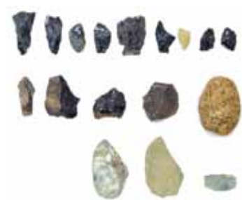
約 34,000 年前の台形様石器と斧形石斧