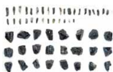
約 16,000 年前の細石刃と細石刃石核