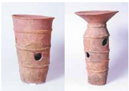
左：円筒埴輪 右：朝顔形円筒埴輪 (いずれも長塚古墳)

長塚古墳の円筒埴輪と朝顔形円筒埴輪は、被葬者を守護するように配列されていました。