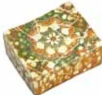
復元された唐三彩の陶枕 (上ノ段遺跡)