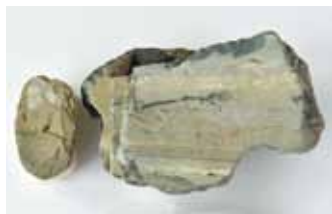
刃を磨いた緑色凝灰岩製石斧（左）丹沢山地産の緑色凝灰岩原石（右）

愛鷹山麓の遺跡で出土した石器を比較してみると、柄を取り付け単独で使用する単純なものから、加工して大量生産し、刃を取り換えて使用するものへ変化していることが分かります。