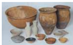
奈良時代の集落から出土する土器（藤井原遺跡）

千本遺跡、藤井原遺跡、下石田原田遺跡、御幸町遺跡、中原遺跡などから出土した土器や祭祀に伴う遺物、金属製品や鍛冶道具のほか、海産物加工に関連すると思われる遺物も展示しています。注目されるのは大きな埴形土器で、これで堅魚を煮ていたと考える研究もあります。生産された煮汁は、灰色の小さな壺に詰められ、遠く奈良の都まで運ばれました。