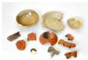
墨書や馬の人形など役所や儀礼に 関係する遺物（御幸町遺跡等）