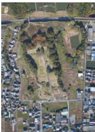
根古屋にある興国寺城跡

それから約200年経った15世紀後半、すなわち戦国時代になると、沼津は駿河国、伊豆国の境目の地であったことから、軍事的に重要な土地と認識され、多くの城が築かれるようになりました。