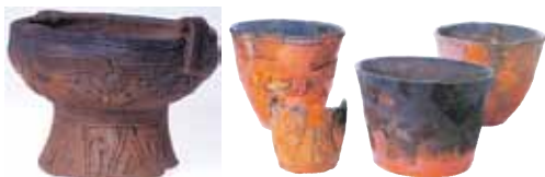
左：トロフィー形縄文土器（長井崎遺跡） 右：沼津最古の縄文土器（葛原沢第IV遺跡）

沼津市で最も古い竪穴住居は愛鷹山麓にある草創期の葛原沢第IV遺跡で発見されたものです。直径約3.5mで50cm程の深さの整った円形の跡です。竪穴住居により寒さや暑さに耐えることができるようになりました。