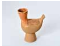
鳥形土器(植出遺跡)

う。当センターに展示している鹿形土製品や鳥形木製品・鳥形土器もそのような願いを込めて作られていたのかもしれない。