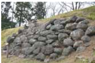
興国寺城跡伝天守台下の石垣