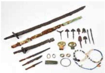
古墳から出土した大刀や装飾品（石川古墳群等）