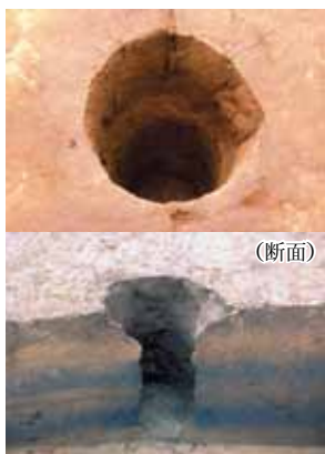
陥穴（澗ヶ沢遺跡）

仲間と打合せをして掘る場所を選んで穴を掘り、獲物を追いかけて、穴に追いつき落として狩りをしていたと想像できます。