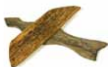
鳥形木製品(雌鹿塚遺跡)

弥生時代以前から人々は動物をかたどった製品を作る風習はありましたが、弥生時代になると鳥と鹿が目立つようになります。鳥は神話や風土記において農耕に関わる動物として登場しており、鹿は角の成長と稲の成長を重ね合わせて、土地の神としていたという説もあります。弥生時代の人々にとって、鳥と鹿は豊穡祈願の対象となっていたのです。