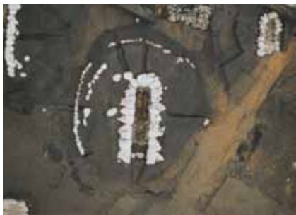
愛鷹山麓の古墳群の一つ 石川古墳群の石室

古墳時代の集落は主に平野部で見られ、御幸町遺跡や藤井原遺跡、豆生田遺跡などの集落が多数確認されています。