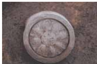
蓮の文様をした瓦の一部(日吉廃寺跡)

日吉廃寺跡で出土する瓦は、奈良県明日香村にある山田寺跡の瓦と同じデザインであり、この様式の瓦が使われてい