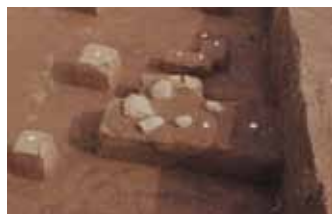
石囲炉跡（澗ヶ沢遺跡）

澗ヶ沢遺跡では、約1万8千年前の地層から、石で囲われた炉の跡が4基発見されました。周辺からナイフ形の石器が出土したので、旧石器時代の人々が使った炉の跡と考えられています。このような炉の跡は全国で40基ありますが、その内の17基が愛鷹山麓から箱根山麓に集まっています。