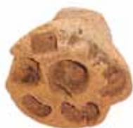
権力者が身に付けたであろうガラス勾玉を作る鑄型(いがた) (植出北Ⅱ遺跡)