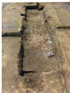
スルガの王が葬られた主体部

この銅鏡や主体部に塗布された朱などから、被葬者は高い経済力と権力があり、また副葬品の大半が槍や鉄鏃などの鉄製の武器であることから、武人的性格が強いことが想像できます。