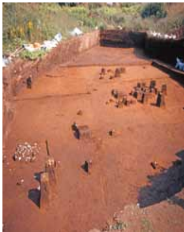
愛鷹山麓最古の遺跡 井出丸山遺跡

また黒曜石も数多く出土しており、その産地から当時の人々の移動の範囲が分かっています。