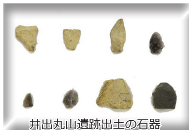
井出丸山遺跡出土の石器

市内で確認されている遺跡の中でも最古のもので、日本全体で見ても最古級の遺跡の一つです。