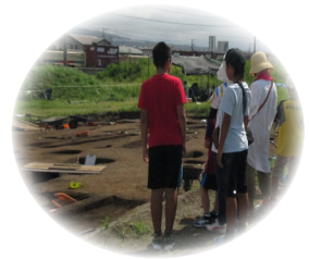
▲発掘調査の現場体験

文化財センターでは、史跡等の復元整備や説明板の設置、パンフレットの作成など、大切な文化財を守り、多くの人に文化財の素晴らしさを感じてもらえるよう取り組んでいます。