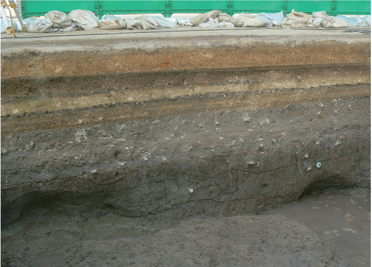
A 調査区北側電線間断面