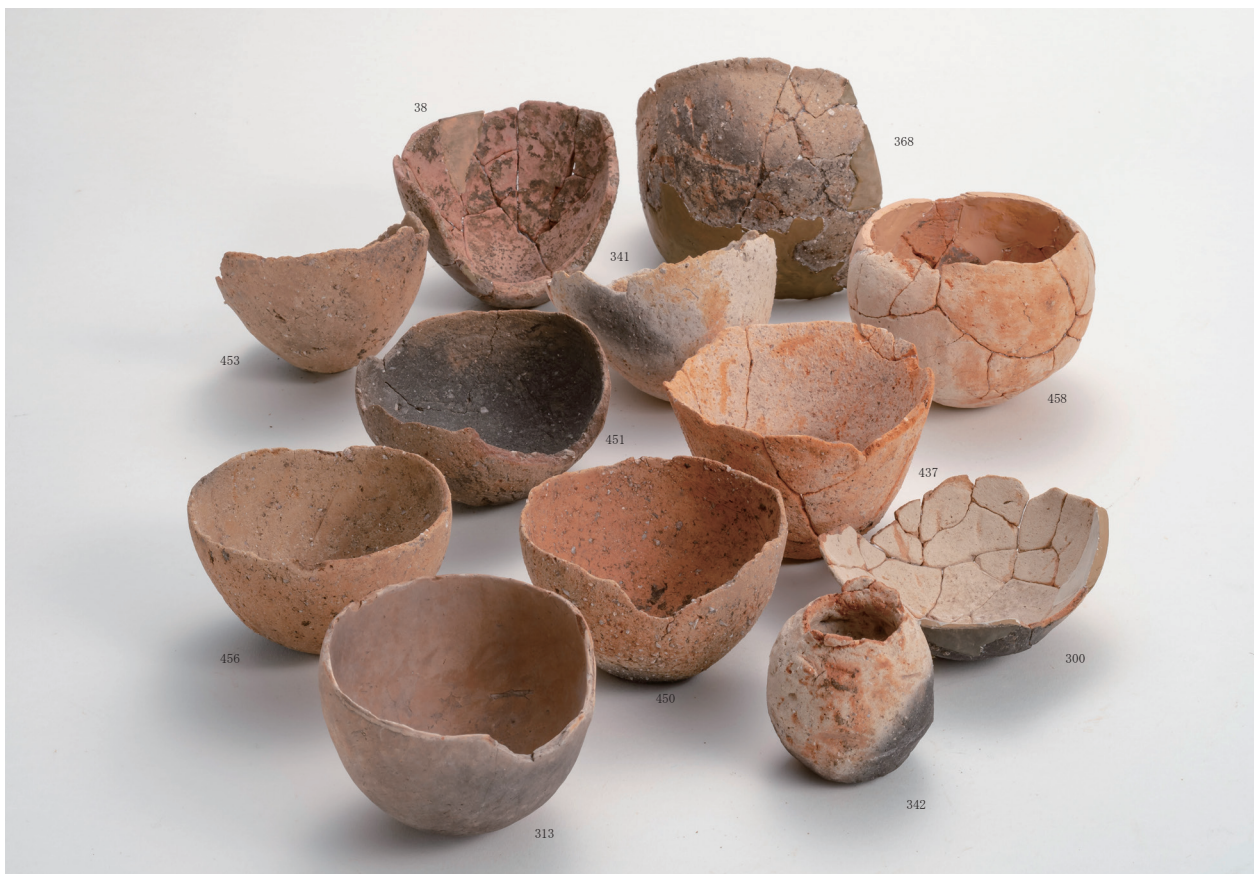
弥生土器鉢・手捏ね土器集合写真