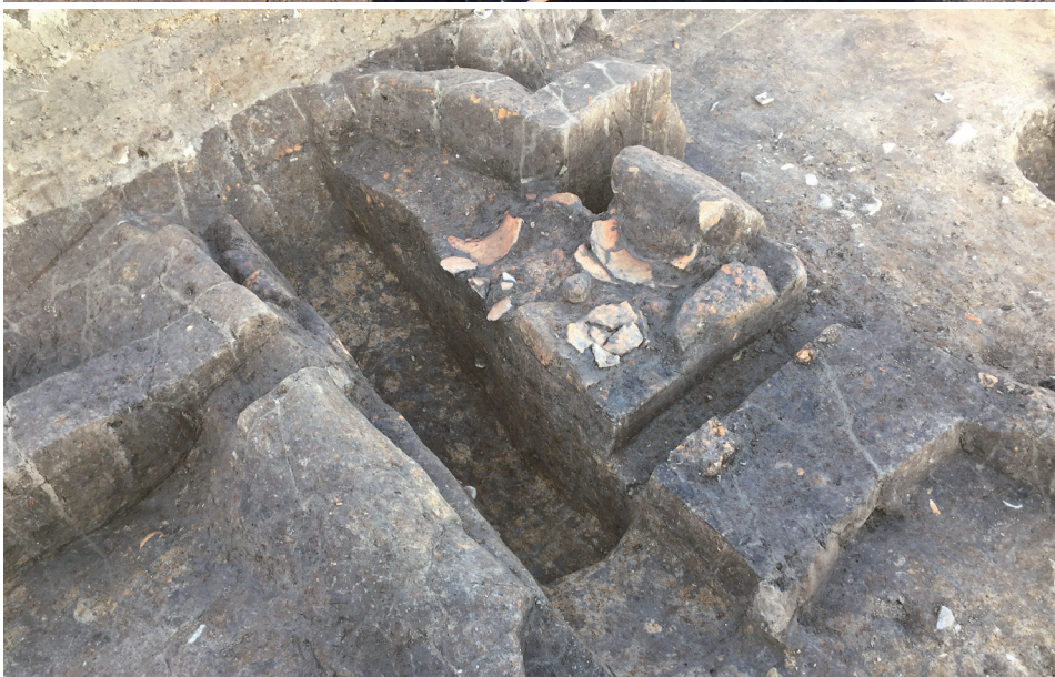
B-2SH1141 カマド 遺物出土状況