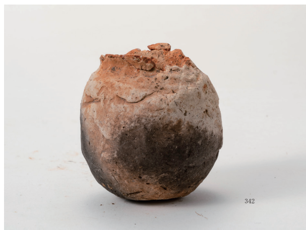
弥生土器手捏ね土器