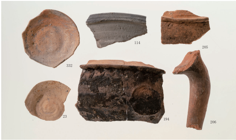
古代末～中世期の土器