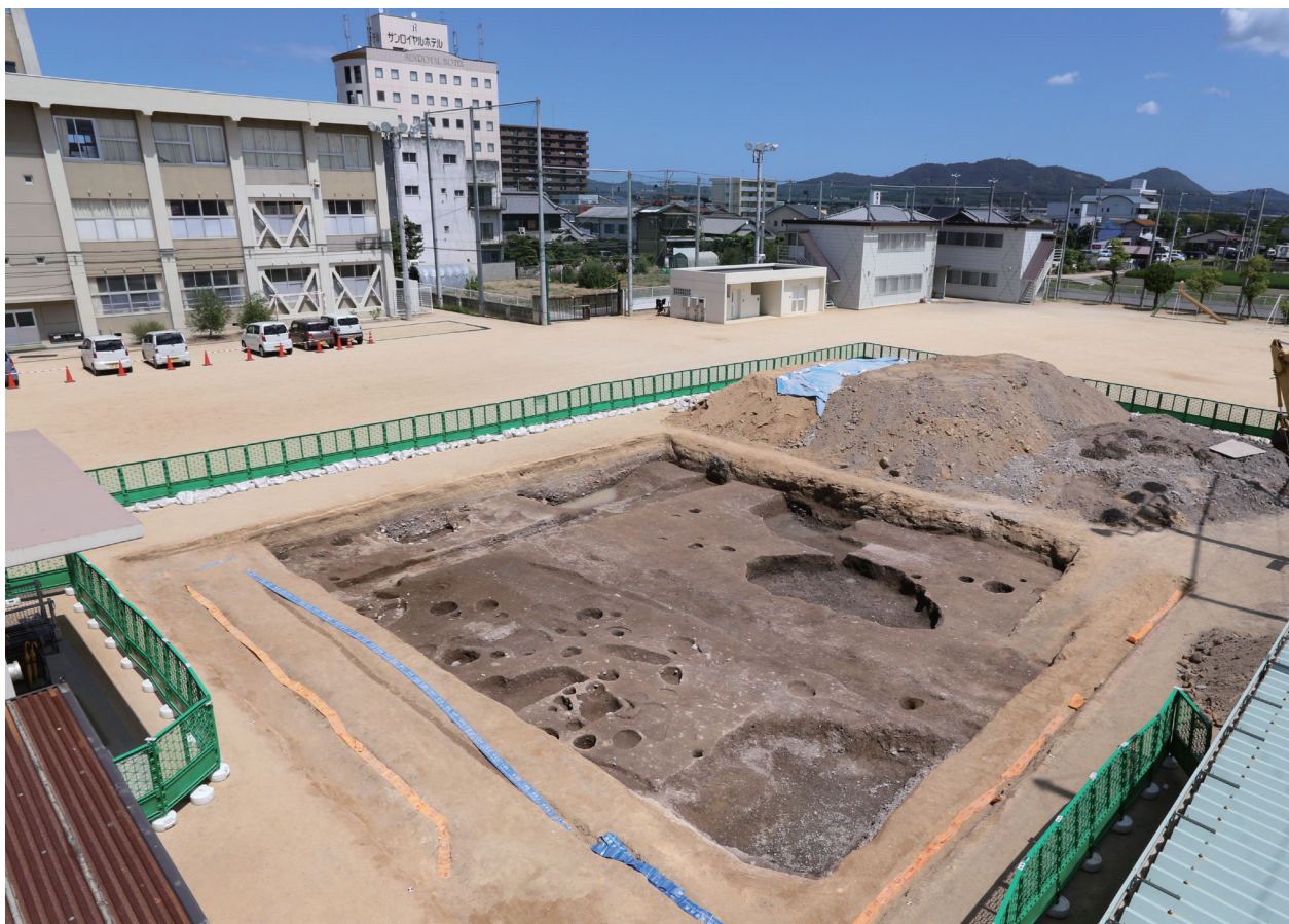
A- 1 調査時西側調査時全景