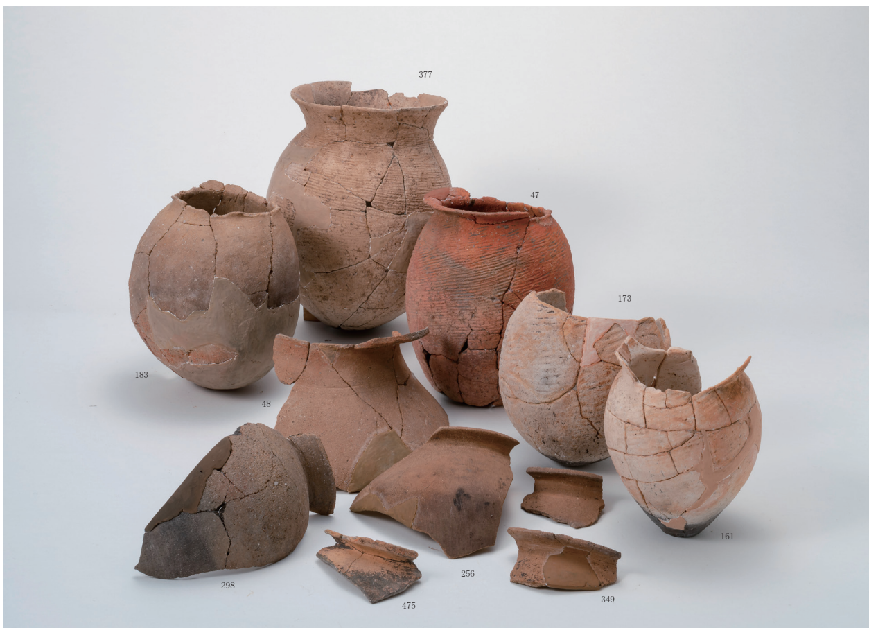
弥生土器甕・壺集合写真