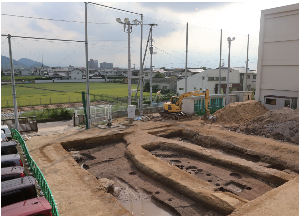
A-1 調査時東側調査時全景