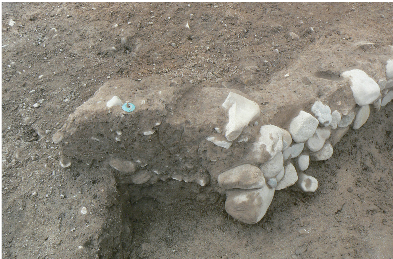
A-1SE1001 構築状況断面状況