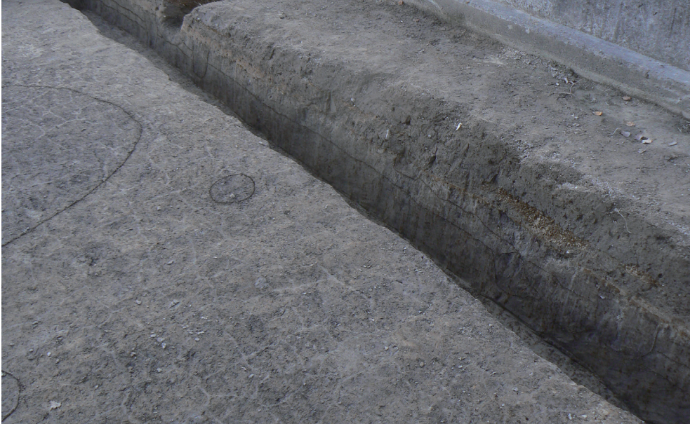
B-1 調査区西壁土層断面