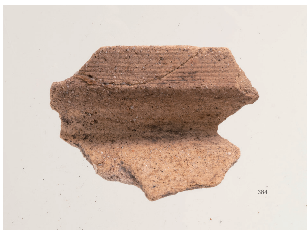
弥生土器吉備系甕