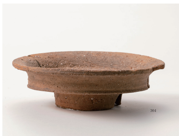
古式土師器二重口縁壺