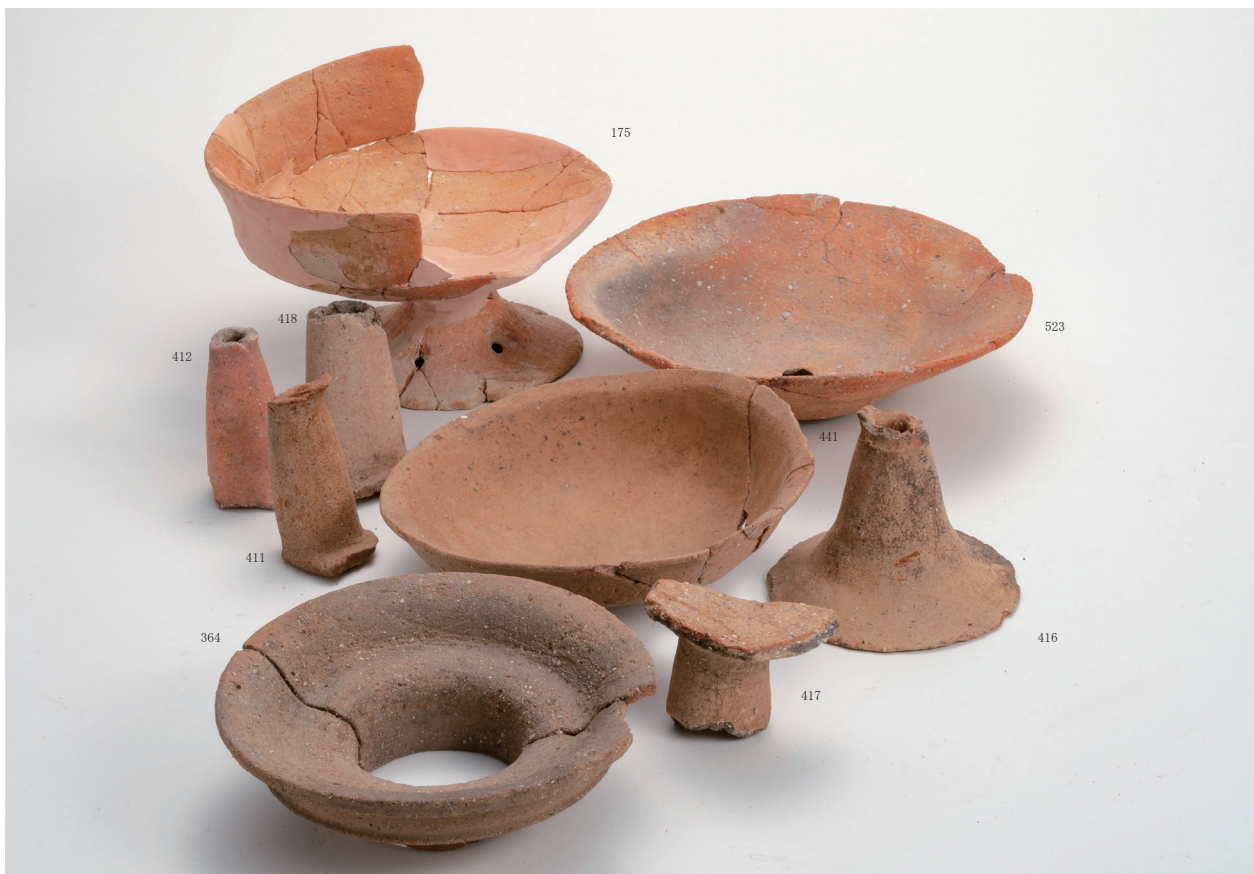
弥生土器壺・高杯集合写真