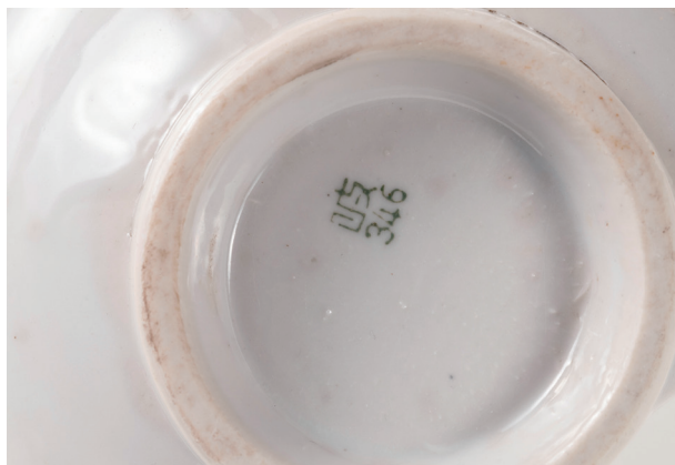
A-1 陶器印字「岐 346」