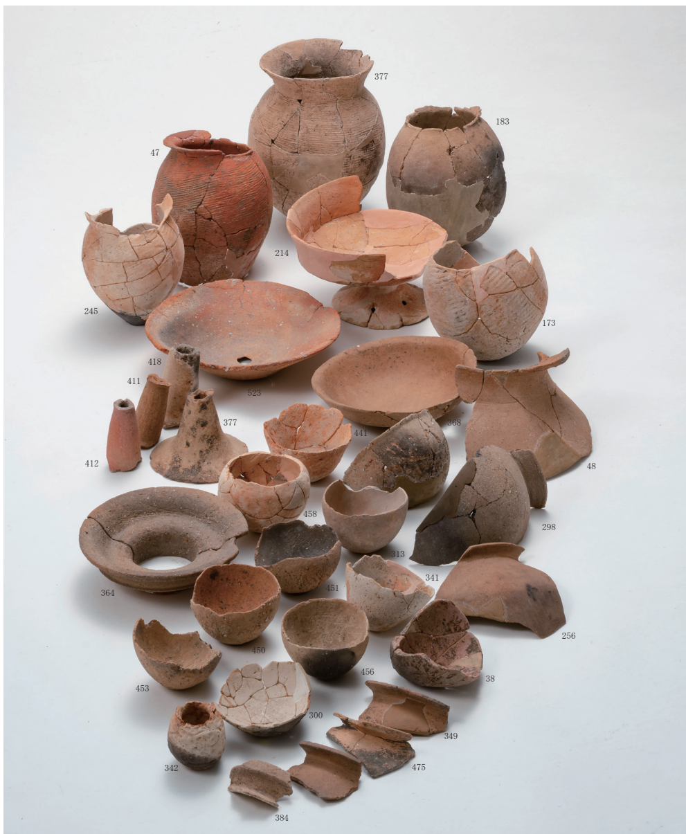
弥生土器集合写真