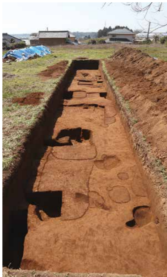
D-5T (北から)▶ 中世の遺構が多数重複して存在している。