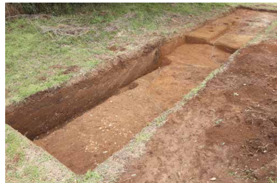
▲D-4T 堀 SD0301 (北西から) 右側(南側)から粘土を含む土砂が大量に流れ込んでいる。南側には土塁が存在しており、土塁の土砂によって埋め戻されていたのがわかる。