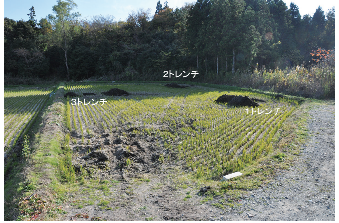
② 調査区全景2（西から）