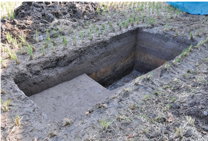
③ 1トレンチ全景（西から）