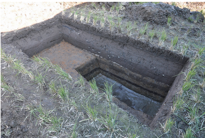
⑦ 3トレンチ全景（南から）