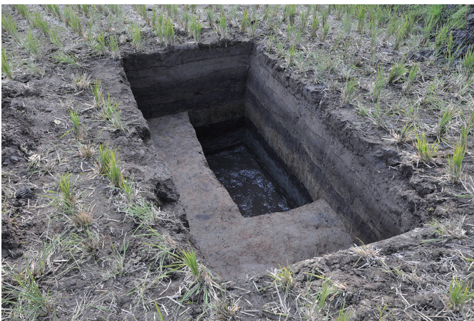
⑤ 2トレンチ全景（北から）