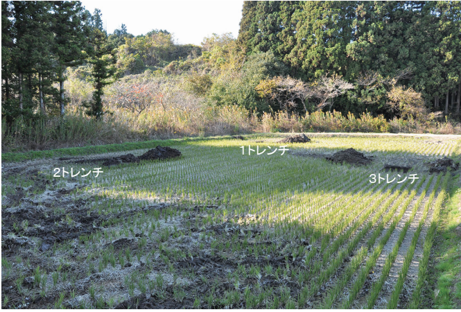
① 調査区全景1（東から）