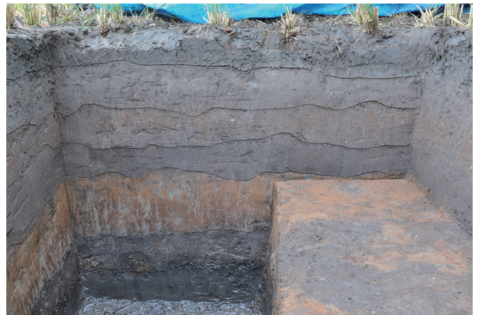
④ 1トレンチ南東壁断面状況（北西から）