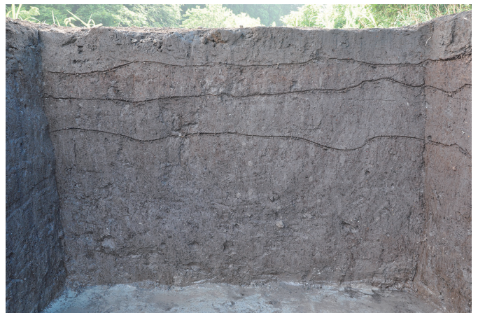
⑧ 4トレンチ南西壁断面状況（北東から）