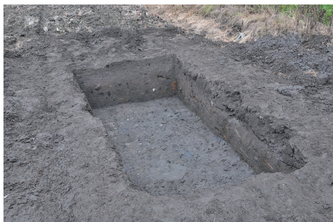
③ 1トレンチ全景 (西から)