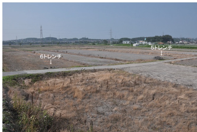
② 調査区全景2 (南から)