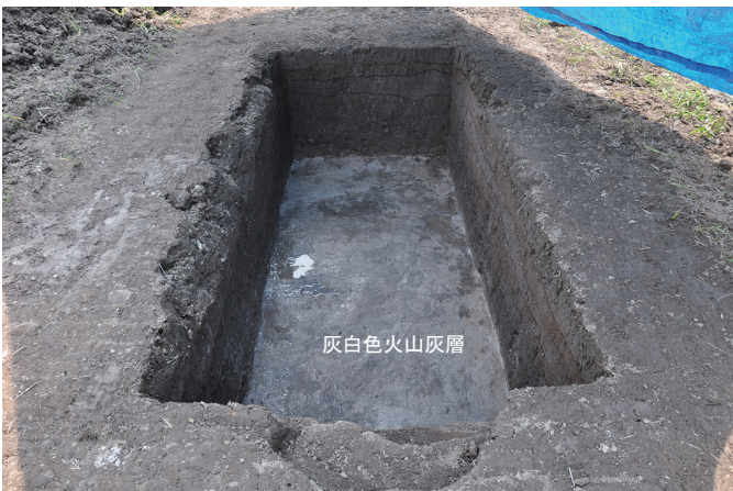
⑦ 4トレンチ全景（北東から）