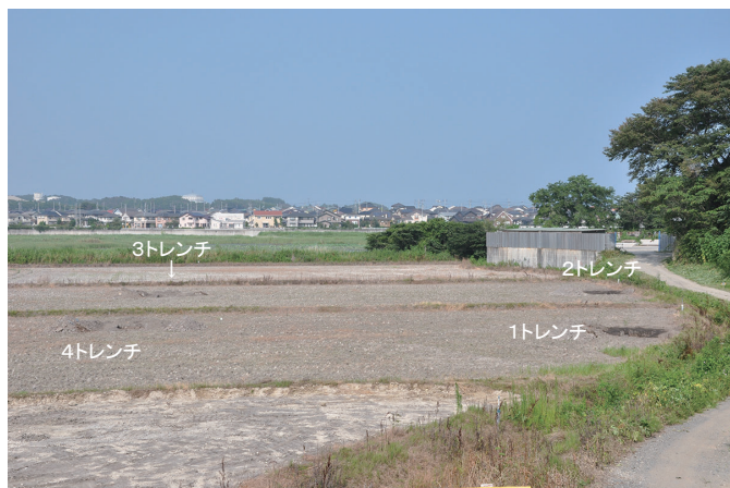
① 調査区全景1 (南から)