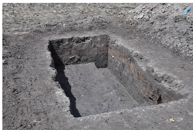
⑥ 4トレンチ全景 (東から)