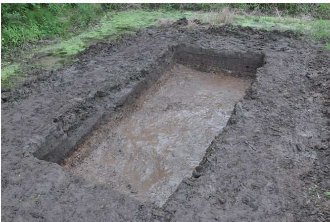
⑤ 2トレンチ全景（北から）