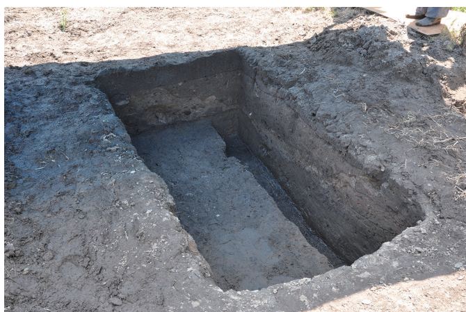
⑤ 3トレンチ全景 (東から)