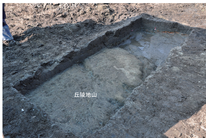
⑧ 6トレンチ全景 (南西から)