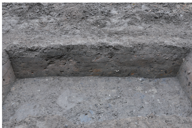
④ 1トレンチ北壁断面状況 (南から)