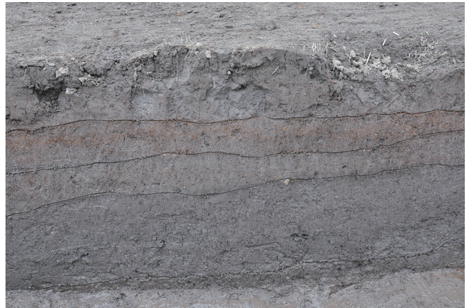
④ 1トレンチ南壁断面状況（北西から）