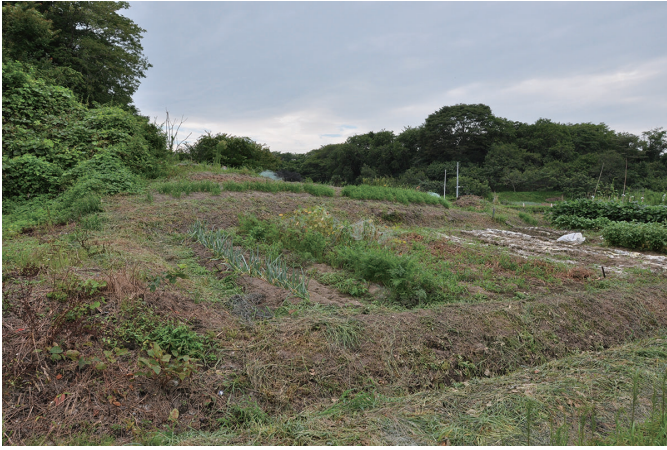
① 沢上貝塚近景（東から）