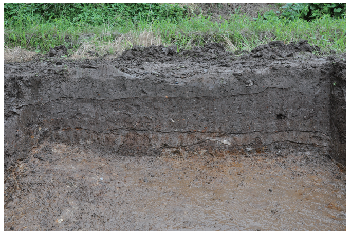
⑥ 2トレンチ西壁断面状況（北東から）