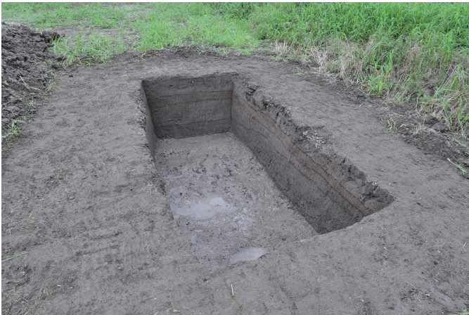
③ 1トレンチ全景（西から）