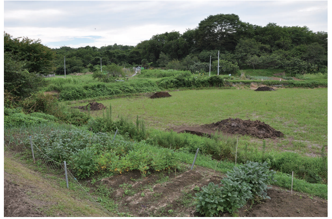
② 調査区全景（南東から）