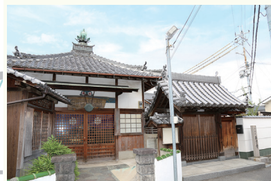
西方寺外観(右:山門、左:観音堂)

近鉄南大阪線河内松原駅下車。北方向へ1.9km。徒歩約24分。 ※駐車場はありません。 見学については、事前に文化財課にお問い合わせください(☎072-334-1550)。