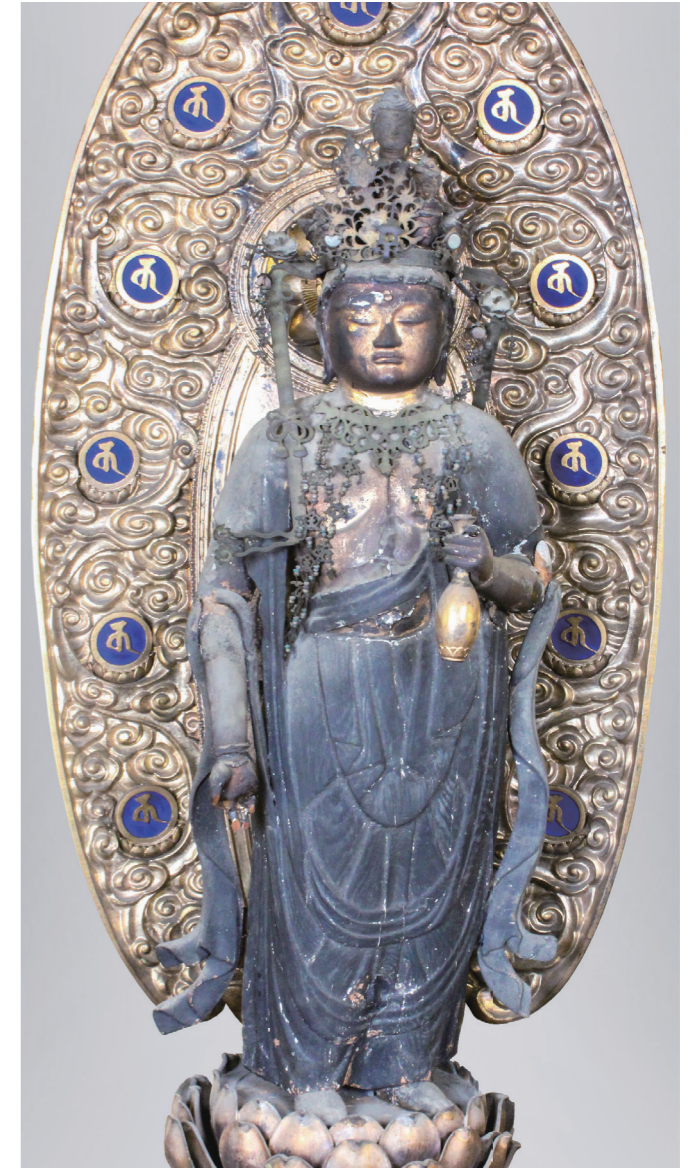
松原市指定有形文化財(美術工芸品 彫刻) 彫第4号

丸みのあるお顔に小さく目鼻を表したまとまりのよい穏やかな表情です。肩幅はやや大きく、少し下半身に重心が置かれていますが、ゆったりとした体つきは同じ時代の如来像に共通したものです。衣のヒダがお腹の所だけ鎌倉時代の仏像を思わせる整った大きな起伏で表現されています。