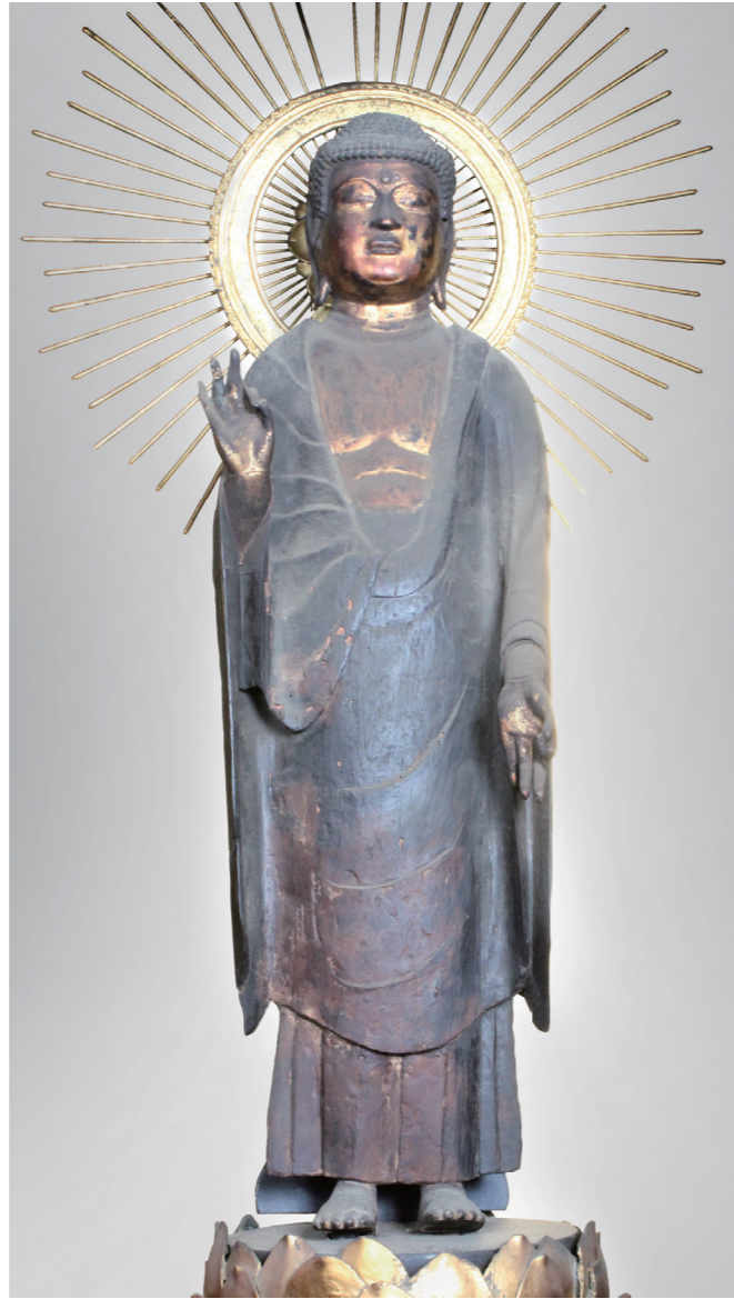
松原市指定有形文化財(美術工芸品 彫刻) 彫第2号

明治政府の神仏分離により梅松院が明治4年(1871)に無くなると、仏像など宝物の一部が西方寺に移されました。