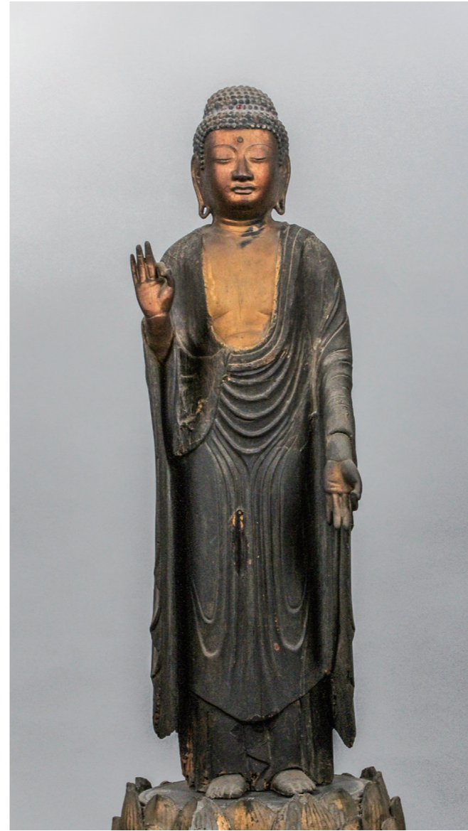
松原市指定有形文化財(美術工芸品 彫刻) 彫第3号

四角く面長のお顔に小さく目鼻を表し、撫で肩の体にヒダ(衣文)が緩やかに表された衣(衲衣と偏衫)をまとっています。下半身の衣のヒダが左から右に流れる表現はより古い時代の像に見られるもので、同じ時代に作られた仏像の多くは右の写真のようにヒダがY字状に表現されています。