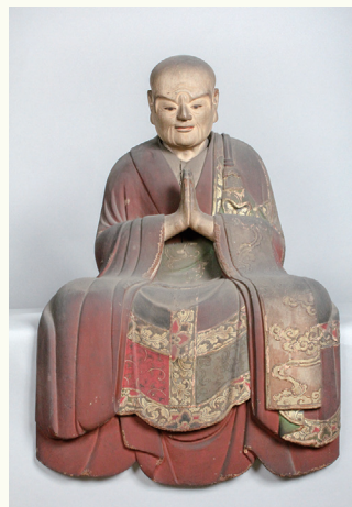
右:法明上人倚像(像高37.2cm)

江戸時代/西方寺蔵/寄木造 彩色 玉眼 法明上人倚像底裏面墨書銘 「宝曆七丑年正月吉日/大佛師/山口左膳」