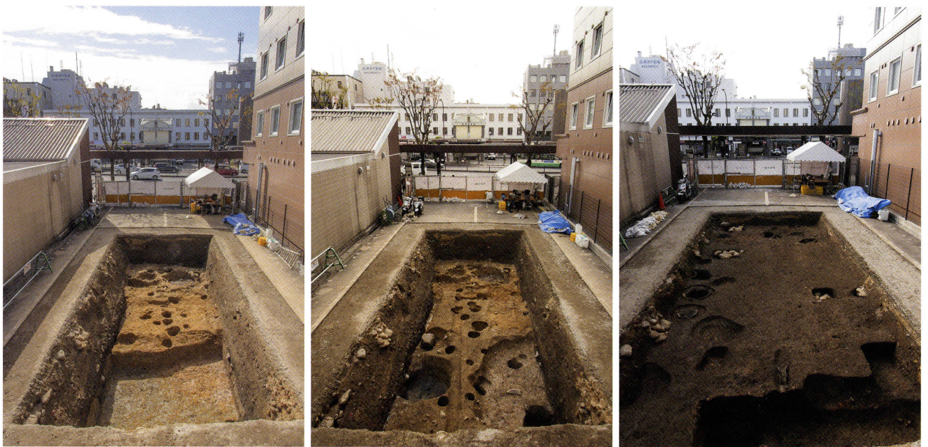
西御門町発掘現場の全景写真（北から）

あり、その上に厚さ約 0.2 m の平安時代後半の整地土があります。現地表下約 1.2 m のこの上面からは、平安時代後半～鎌倉時代の遺構が見つかります。径約 0.3 m の小柱穴が多数あり、建物が何度も建て替えられたことがわかります。また当時のゴミ穴からは、多数の土器（土師器・瓦器）が出土しています。ほぼ完全な形で出土するこれらの土器は、使い捨ての容器と考えられ、当時の神事や仏事に用いられた後に廃棄されたものと思われる。