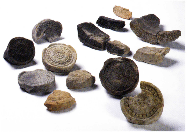
出土した古代の軒瓦

大安寺南大門は寛仁元年（1017）に焼失し、し ばらく後の13世紀半ば頃に再建が始まったこと が史料と発掘調査から判明しています。このよう なことから、中世の南大門再建とその周辺整備の 際に、溝1が掘削され、橋が架橋されたものとみ ることもできます。