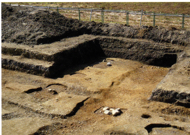
塔院北門と六条大路南側溝（北東から）