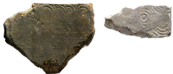
写真3 同心円の当て具痕跡のある平瓦