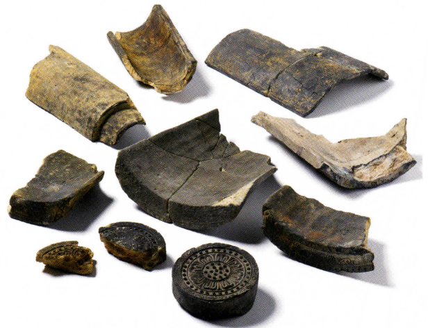
写真1 Aグループの瓦

今後さらに、製作技法や同范関係の調査を進めていくことにより、生産地や、他の遺跡との関係性を明らかにしていければ、寺名すら伝わらない平松廃寺の性格にも迫ることができると考えます。