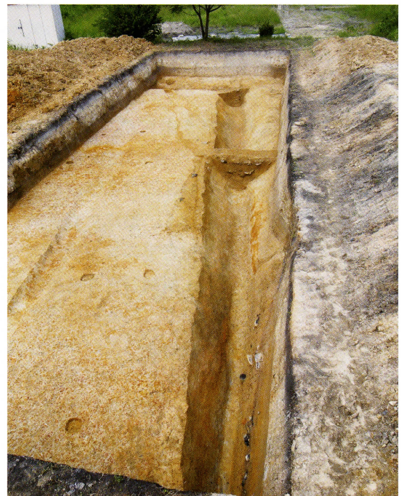
発掘区と検出した南北溝 (南から)

いずれにせよ、これから出土した瓦の調査を進め、今後も周辺の発掘調査を積み重ねていくことにより、平松廃寺の実態が解明されていくものと思われまます。