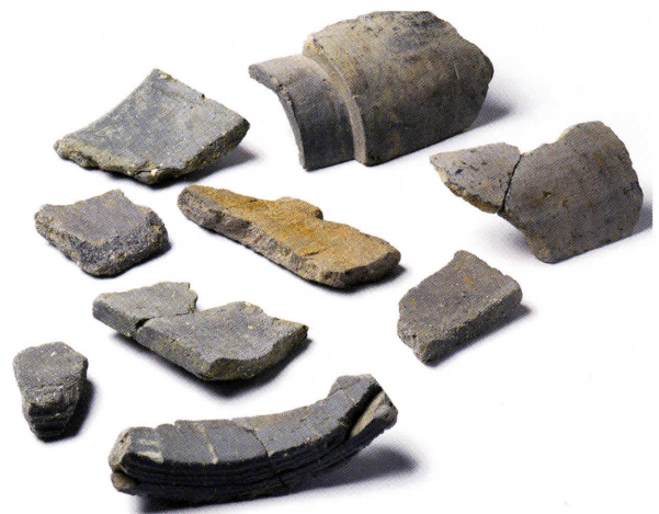
写真2 Bグループの瓦