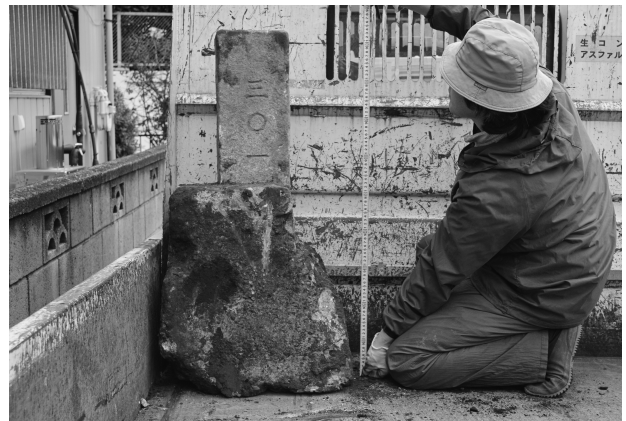
ハケ遺跡第 20 地点境界杭出土状況