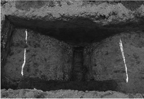
ハケ遺跡第 20 地点トレンチ 3 堀跡完掘