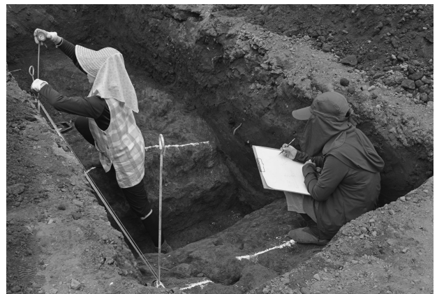
ハケ遺跡第 20 地点調査風景