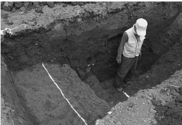
ハケ遺跡第 20 地点トレンチ 5 堀跡完掘