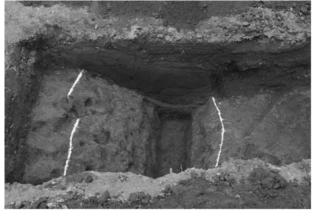
ハケ遺跡第 20 地点トレンチ 4 堀跡完掘