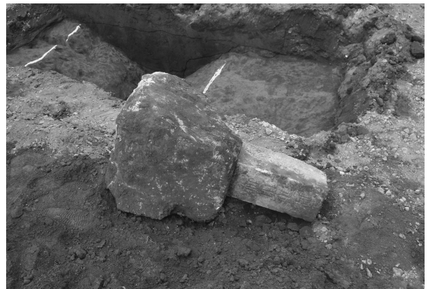
ハケ遺跡第 20 地点境界杭出土状況