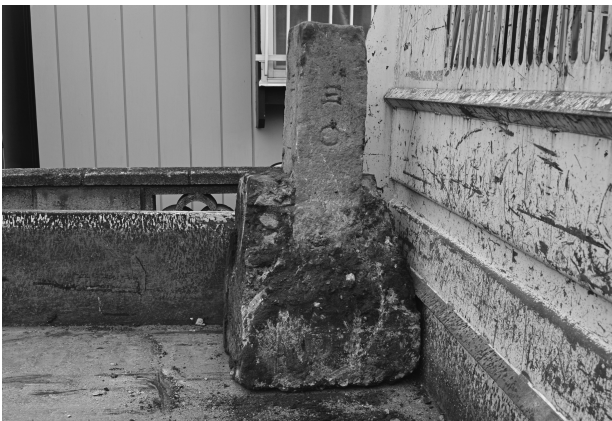
ハケ遺跡第 20 地点境界杭出土状況