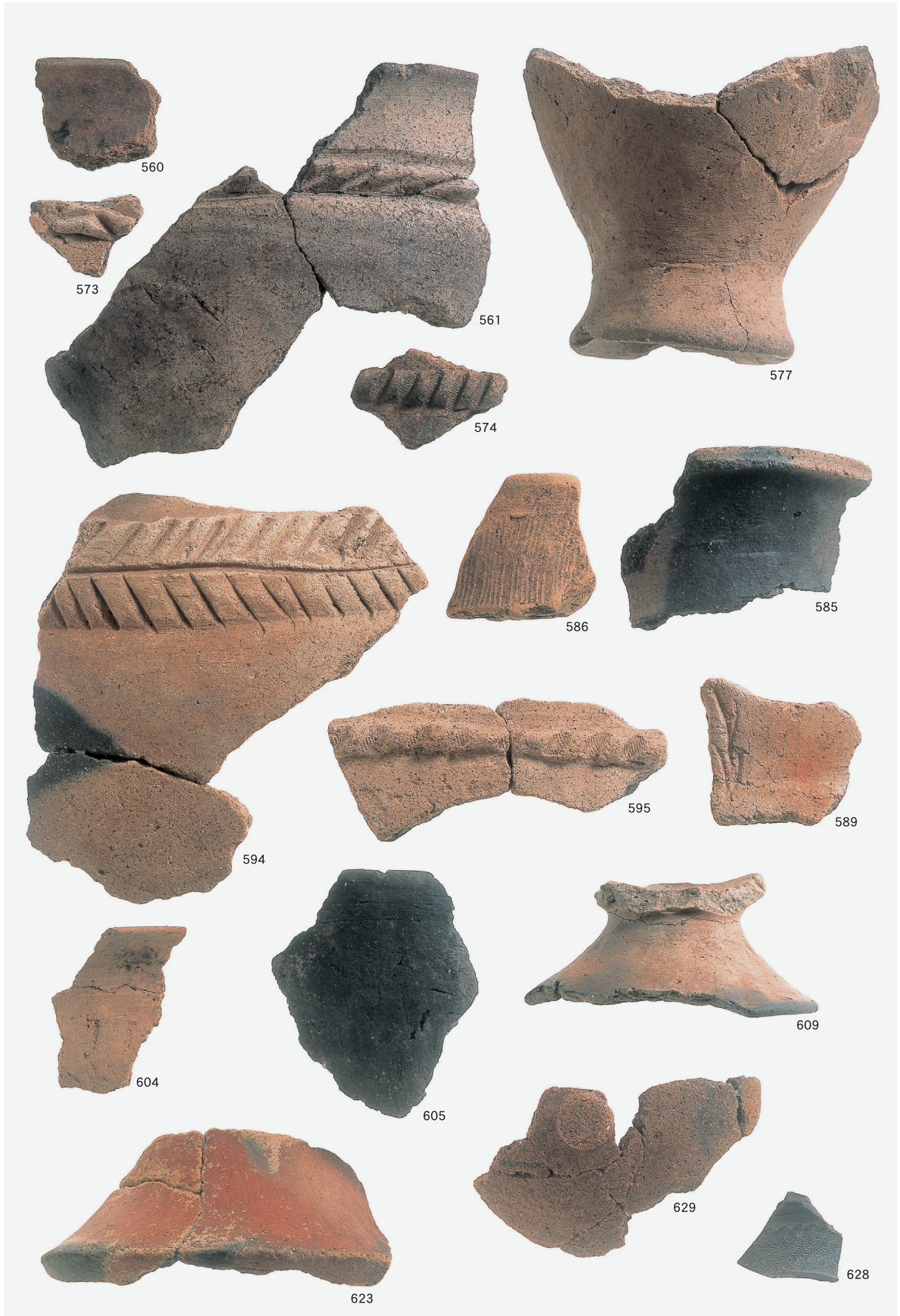
第2地点 古墳時代 包含層遺物