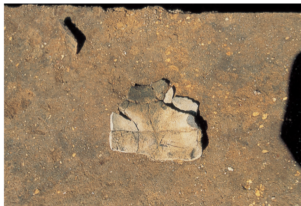
縄文土器出土状況（Ⅶ層）