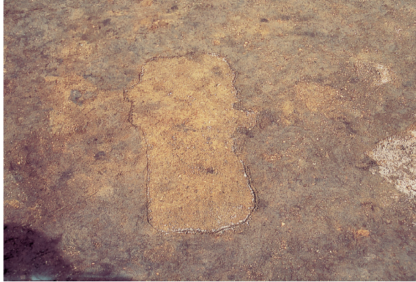
落とし穴 4号 (検出状況)