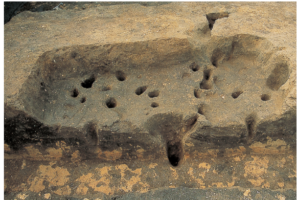
落とし穴 4号 (完掘状況)