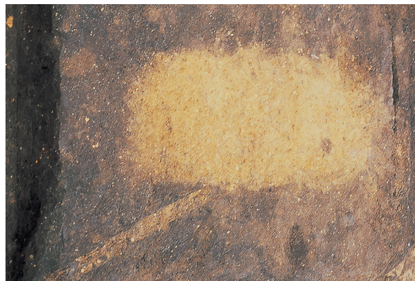
落とし穴 5号 (検出状況)