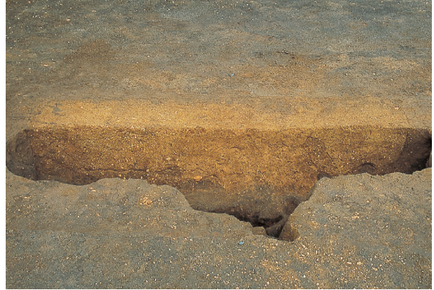
落とし穴 4号 (埋土状況)