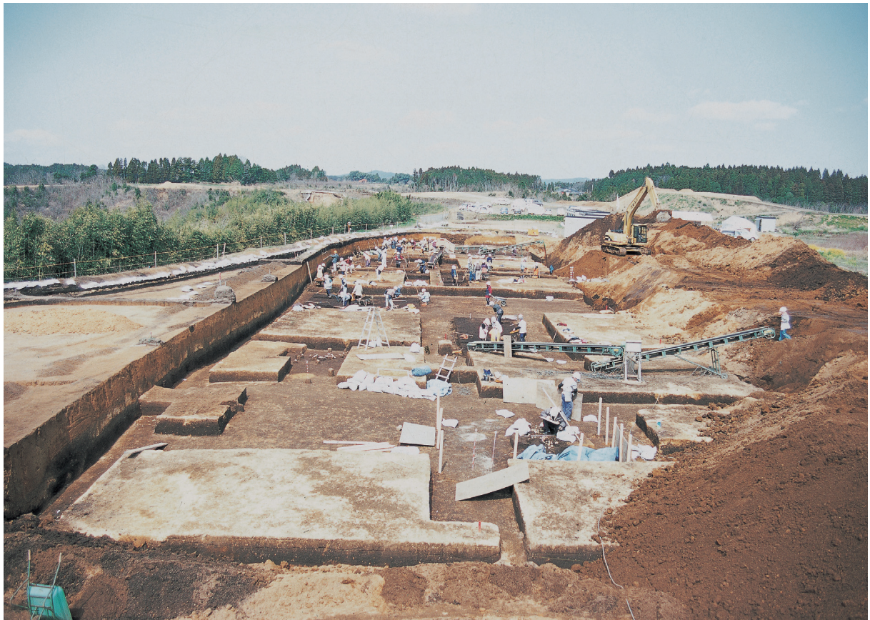
作業風景（中央部北側）