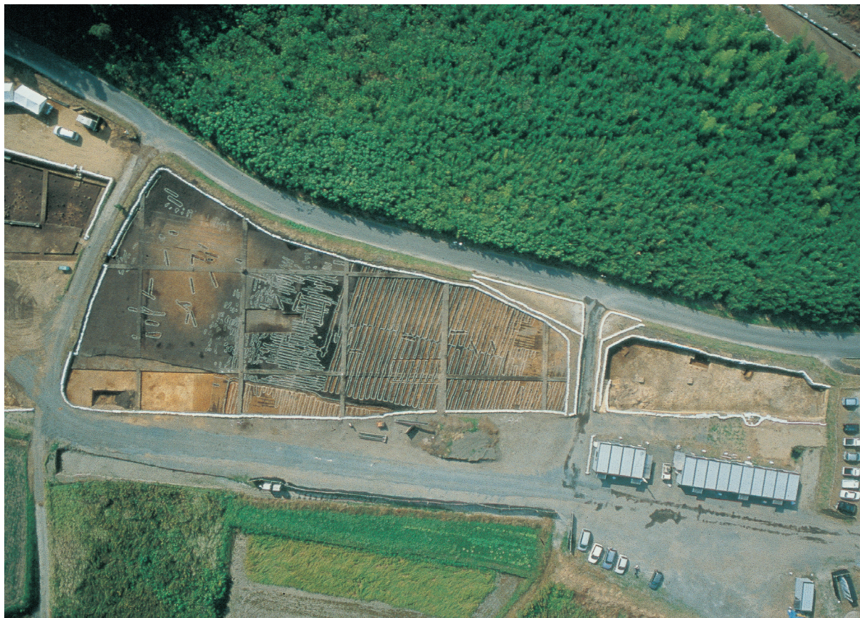
調査区遠景（中央部北側）