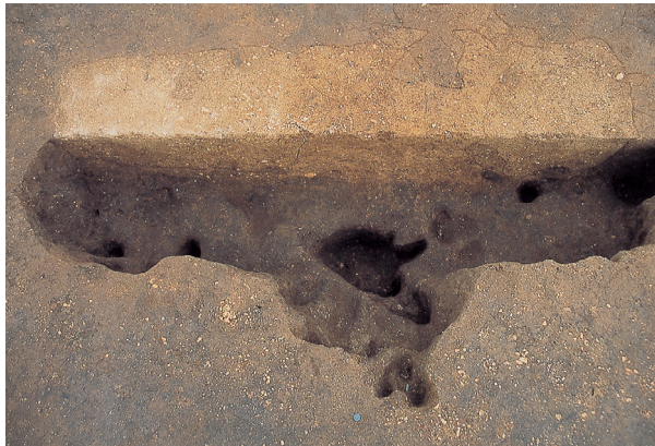
落とし穴 4号 (半掘状況)