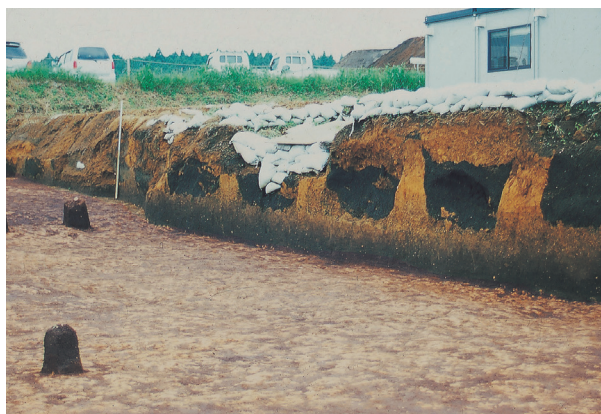
土層断面（天地返し）