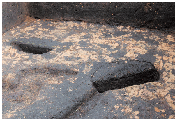
土坑 (130, 133)