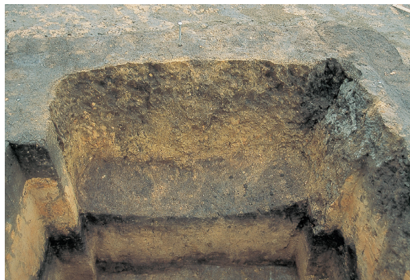
落とし穴 5号 (完掘状況)