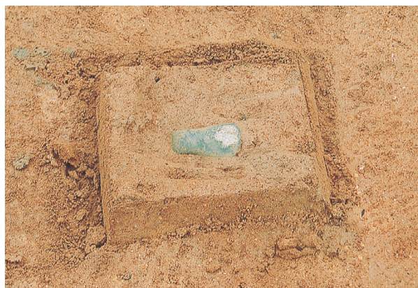
磨製石斧出土状況