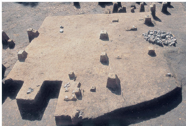
集石24号, 縄文土器集中