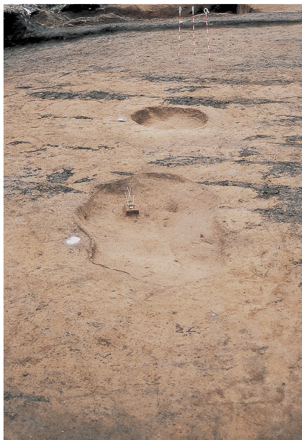
焼土 1, 2 (完掘状況)