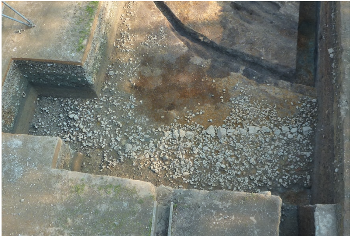
第15図 10-3調査区の東側造り出しの列石と石敷（拡張後・北西から）

東造り出しは、西造り出しと同じく地山を整地した後に盛土を行っているが、東側では周壕と接する斜面に石敷が巡り、石列内側の石敷付近で平坦となる。これより上面は耕作により削平されているが、石列内側の石敷は疎らであるが斜面の石敷と変わらない状態であることから露出していたと想定される。すでに石は失われているが、区画する石列を境にして壇状の高まりが設けられたものと推測される。