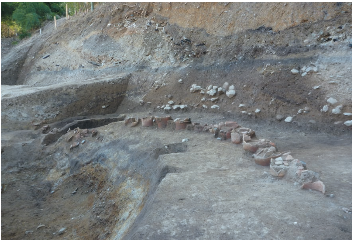
第 11 図 10-2 調査区くびれ部の埴輪列（北から）

で終息しており、当初はこれに続く南側の埴輪列は破片が遊離した状態で出土したことから崩れた可能性が高いと思われた。埴輪の個体は小破片も含めて 8 個体分と推測した。しかし、その後の調査でこの中には樹立した状態を保つものが二三あり、一部で掘形を確認したことからくびれ部の埴輪と同列ではない一段低い位置に埴輪を据えたものと判断した。また、この付近から南側は地山と古墳築造時の地表面に想定される黒色土が一段落ち込んだ状態で延びており、造り出しの築造に伴い整地されたことを示唆している。一方、東造り出しと前方部の納まり方については井戸に攪乱されて明らかでないが、前方部の埴輪列と後述する 10-3 調査区の東西方向の石列がほぼ直交すること、東造り出しが取り付く位置はくびれ部にかなり近いことが明らかとなった。