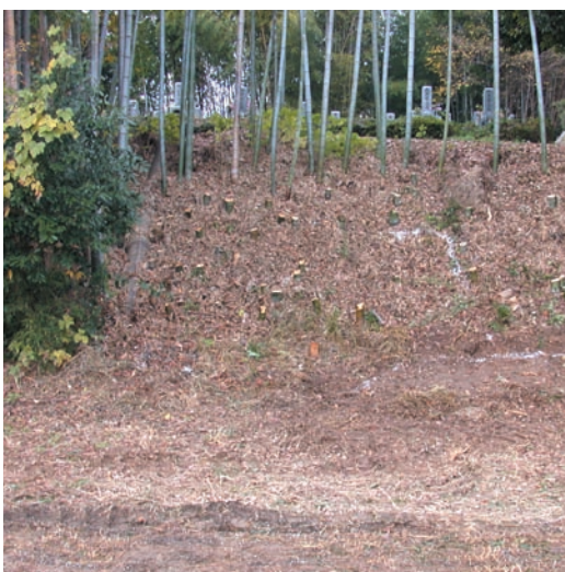
第8図 10-2 調査区掘削前の状況（北東から）

墳丘の東くびれ部を確認するために、第9次調査の第4調査区で確認された後円部第1段埴輪列の延長部分に約5m四方の調査区を設定した。現況は、高低差3m前後の急な斜面地の竹林となっているが、昔の地形図によると大きく内側に挟り取られていたことがわかる。調査では、竹やぶ表土の下は廃材を含む土で埋め戻されており、ほぼ埴輪列が検出された高さまで後円部墳丘が削平されていることが判明した。その後、本地点は南側に拡張してくびれ部から前方部の埴輪