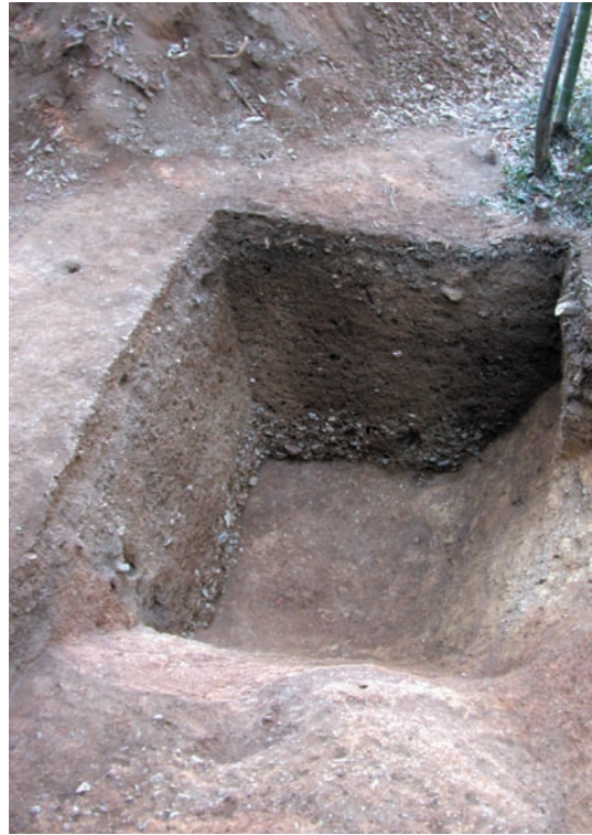
第7図 10-1 調査区の落ち込み（北東から）

黄白色系の粘質土と橙色系の小さな石礫を含む土で構成されており、深い落ち込みの壁面には縞状に堆積する古墳盛土層が観察できる。