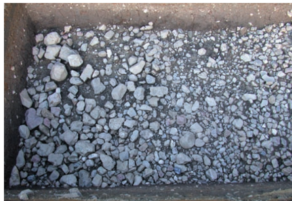
第21図 10-5調査区周壕内の転落石（南から）

調査と同じく、後円部の墳丘は段丘礫層の地山面まで削平されており、周壕内には人頭大ほどの石が調査区西端まで延びている。緩やかに立ち上がる地山斜面に残る石は、大きなものでもこぶし大程度であり、検出状況は部分的に崩れた残り方をしている。明確な基底石は確認できなかった。遺物は、形象埴輪を含む埴輪片が少量出土している。