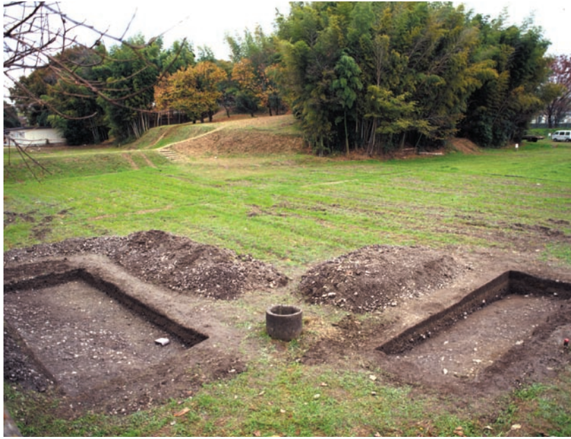
第22図 10-6調査区全景（南から）