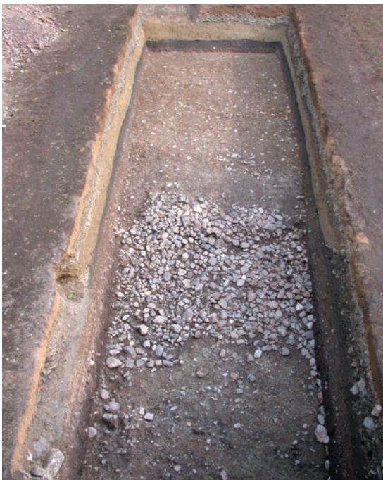
第18図 10-5調査区全景（西から）

後円部の葺石と基底石を確認するために長さ10m、幅3mの調査区を設定した。これまでの