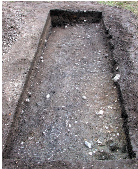
第24図 10-6南調査区全景（南西から）

恵器や瓦が出土しており、周壕が一部埋め戻されたことが判明した。本来の周壕外周部はこれより西側に想定される。