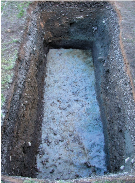
第16図 10-4調査区全景（南西から）