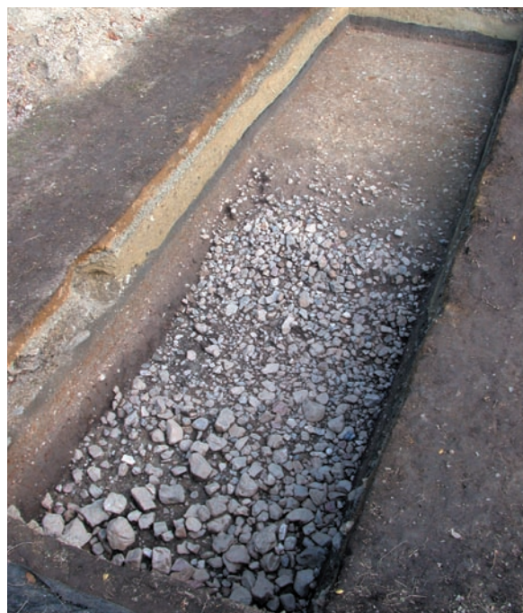
第19図 10-5調査区全景（南西から）