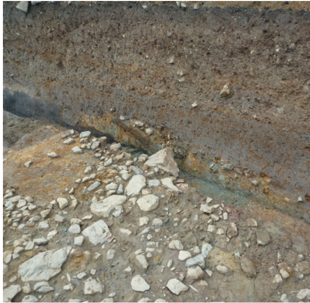
第14図 10-3調査区石敷の断割り（北東から）

また、造り出しは地山を整形した後に盛土を行っており、石列の内側に黄灰色系、褐色系と黒色系などの土を盛り、部分的に作業単位とみられる小さな土の固まりがわかる。石列外側の石敷面は、砂礫を含む土で周壕底まで傾斜を付け、その上に石をのせている。南辺については明らかにできなかったが、10-4調査区の東端に堆積する黒色粘土層は、造り出しの盛土に類似する点がやや気掛かりである。10-3と10-4調査区では転落した石が見当たらない状況は、造り出しに当たることを暗示するのかもしれない。なお、造り出しの上を通る東