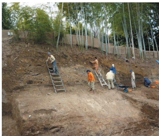
第9図 10-2 調査区拡張部（東から）