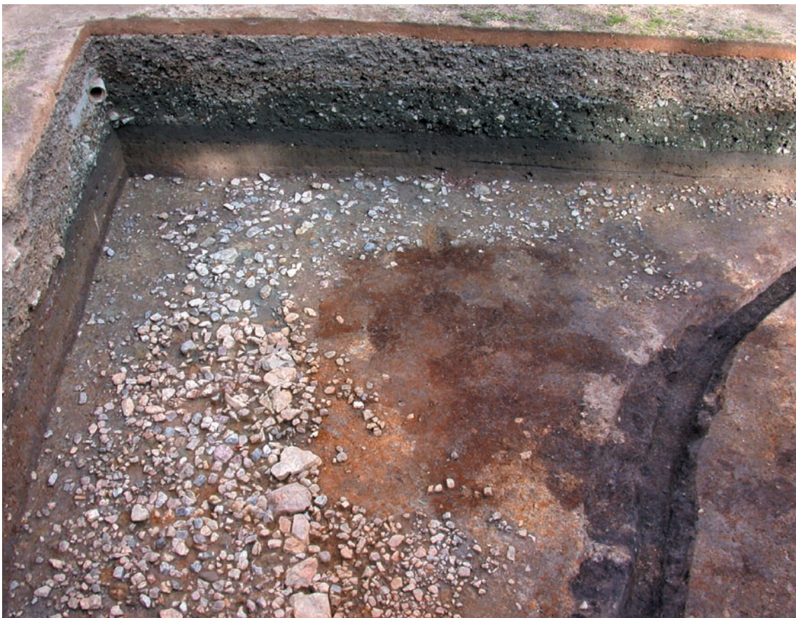
第13図 10-3調査区の東側造り出しの列石と石敷（南西から）

整地土以下、水田耕作関連の堆積層を除去すると、東西方向に一直線に伸びる石列と、周壕底に下る緩やかな斜面に細かな石を散らしたような石敷が現われる。部分的に石列の内側にも石敷はみられるが、拳より小さな石が大半であり、葺石のように貼付けた石ではない。石敷の東側では、耕作時に脱落した石がありやや疎らになるが、西側はほぼ旧状を保っているようである。石敷の輪郭は、石列が残らない東側でも盛土との違いから、西から南に折れる隅角が明瞭である。断割りによると、調査区南部の石礫は地山の一部が現われたものであり、造り出しの石敷とは異なる。