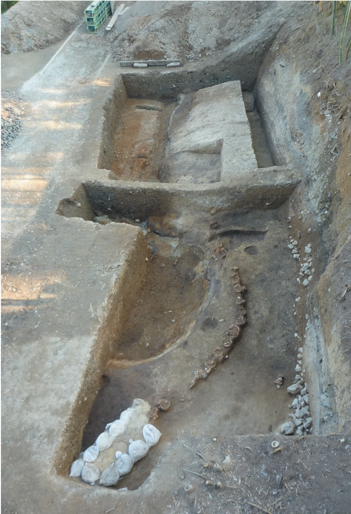
第1図 10-2調査区 くびれ部の埴輪列と転落石（北西から）