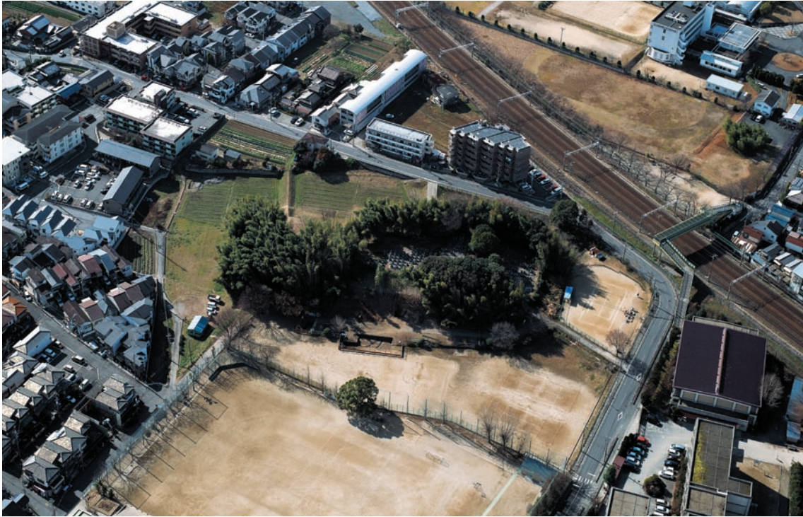
第 25 図 調査中の恵解山古墳（北東から）平成 22 年 1 月撮影

ち飾り部、綾杉文を施した草摺形埴輪などが出土している。なお、10-2 調査区の埴輪列は出土状態を保持したまま土嚢と砂で埋め戻している。