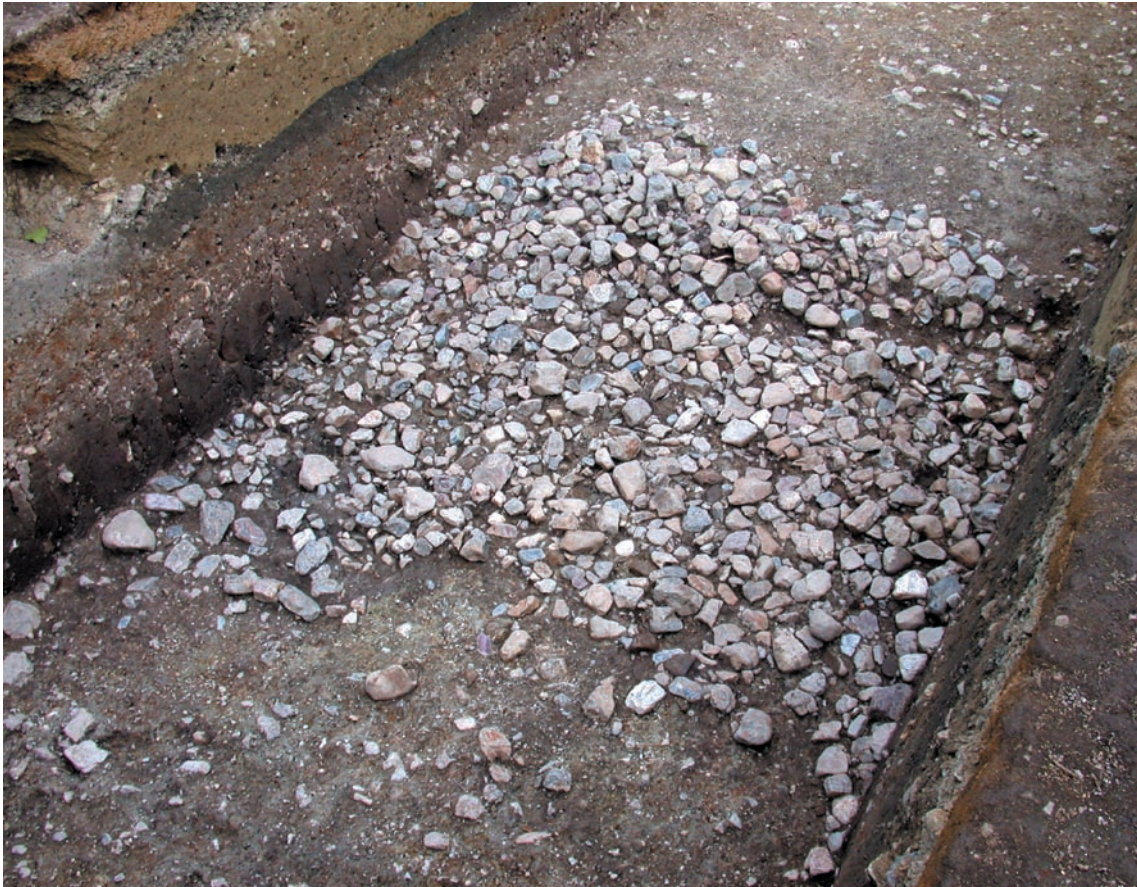
第20図 10-5調査区の葺石（南西から）

調査と同じく、後円部の墳丘は段丘礫層の地山面まで削平されており、周壕内には人頭大ほどの石が調査区西端まで延びている。緩やかに立ち上がる地山斜面に残る石は、大きなものでもこぶし大程度であり、検出状況は部分的に崩れた残り方をしている。明確な基底石は確認できなかった。遺物は、形象埴輪を含む埴輪片が少量出土している。