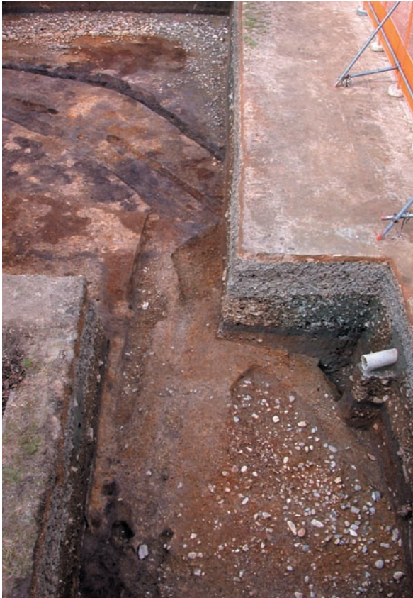
第12図 10-3調査区全景（南東から）