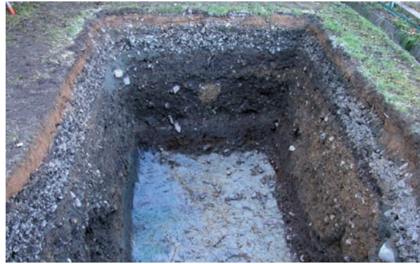
第17図 10-4調査区細部（北東から）