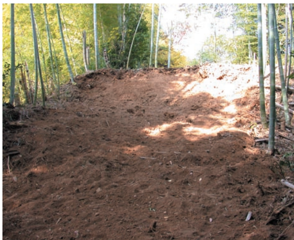
第4図 10-1 調査区掘削前の状況（南東から）

本地点では、前方部の墳丘盛土層を切り込む階段状の段差によって前方部は大きく改変されており、新たな埋納施設は確認することができなかった。鉄器埋納施設と階段状の段差上段の高さは、現況では本地点が0.7m程高くなっている。墳丘の盛土層は、