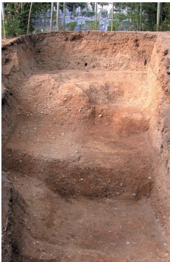
第5図 10-1 調査区全景（南東から）