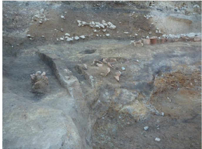
第 10 図 10-2 調査区段差のある埴輪列（東から）

拡張後の調査では、初めに近世以後の井戸掘形に辛うじて破壊を免れた円筒埴輪列の一部を発見した。これ以後、崩落した土砂と石の除去を進め、埴輪列がくびれ部に当たることが確認された。後円部の埴輪列は、昨年度の調査分 13 個体と合わせて 23 個体あり、さらに前方部側に 5 個体並ぶ。樹立した埴輪列は一旦ここ