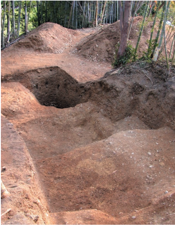
第6図 10-1 調査区全景（北から）