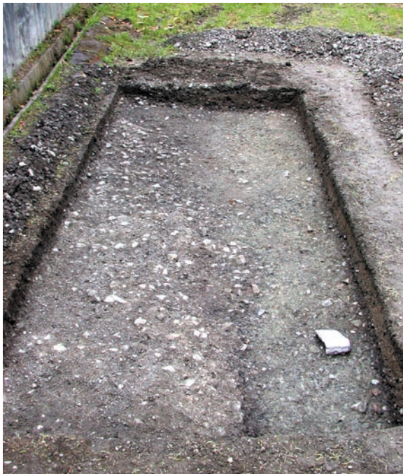
第23図 10-6北調査区全景（南東から）