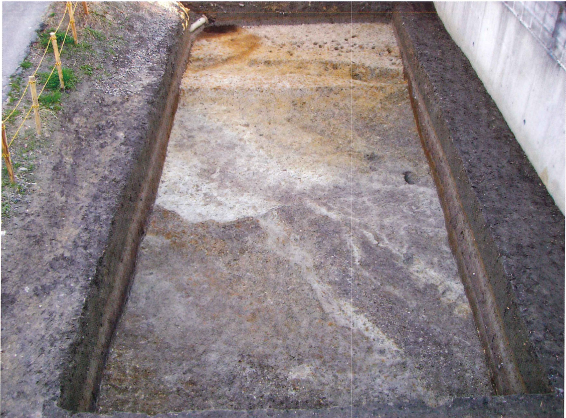
第15図 9-5 調査区全景（東から）

この南側周壕外周部の状況を把握するため9-5調査区の西24mに、南北2.5m、東西4mの9-7調査区を新たに設定した。その結果南から北に向かって緩やかに傾斜する南側周壕外周部が検出され、外周部がわずかに南に広がって行く状況が確認された。深さは0.3mと非常に浅く、ベースは青灰色の砂質土である。全体に礫が目立つが、規模が小さく葺石とは思われない。また部分的に深くなった個所には黒色粘土が堆積し、その上面には直径2～5cmの小さな石が集積している。これらの直上からは長岡京期～鎌倉時代の遺物が出土している。