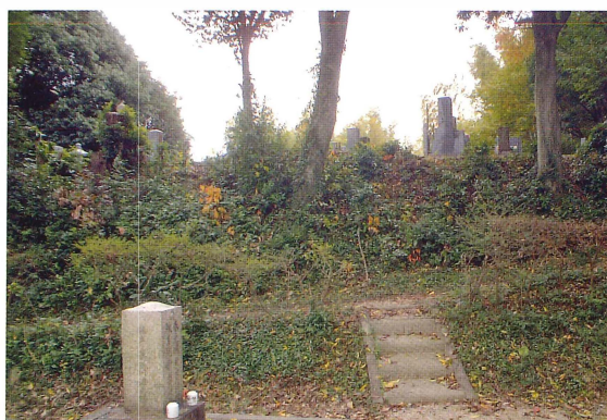
第4図 9-2調査区調査前風景（北から）