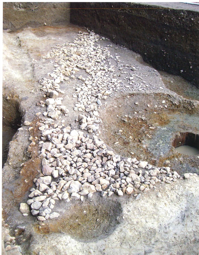
第13図 葺石検出状況（南西から）

北西部の墳丘はかなり削平を受けており、灰白色の地山の上に厚さ約0.4mの旧表土である黒色土があり、その上の盛土は西側にわずかに残るのみであった。この面でかろうじて後円部1段目の埴輪列が残っていた。削平されたものを含めて14個体分が確認できる。直径は確認できるものでは約20~24cmであるが、南から2番目の埴輪は直径27cmと一回り大きく、円筒埴輪とは異なる可能性もある。削平は南から北に向かって低くなっており、北側では3個分が完全に失われ、最も北側のものもわずかに底部片が残るのみである。南側の残りの良好なものでは高さ20cmほどあり、一段目突帯がかろうじて残るものがある。埴輪同士の間隔は約12~15cmで、これらは幅約0.4m、深さ0.1mの布掘りされた溝に設置されている。