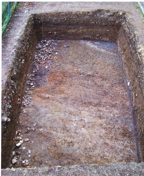
第10図 9-3 西調査区全景（北から）

西調査区では地表下1~1.2mまでは整地用盛土と西側からの近世堆積土で、その下に江戸時代の遺物を含んだ厚さ約0.1m水田耕作土があり、それを除去すると地山面および葦石と埴輪片が検出された。葦石・埴輪はほぼ後円部裾推定線に沿って調査区東辺で検出されており、葦石はいずれも拳大の小形の石で、出土状況もまばらで、大形の石が並ぶような状況も看取されないため、すべて転落したものと見られる。葦石の上面には同様に転落した埴輪が比較的まとまって出土しており、いずれも円筒埴輪である。この他に転落した葦石に挟まれるような状態で長岡京期の須恵器杯Bも出土している。調査区の南東隅では、葦石の下に灰色の粘質土と黒色粘土層が確認される。