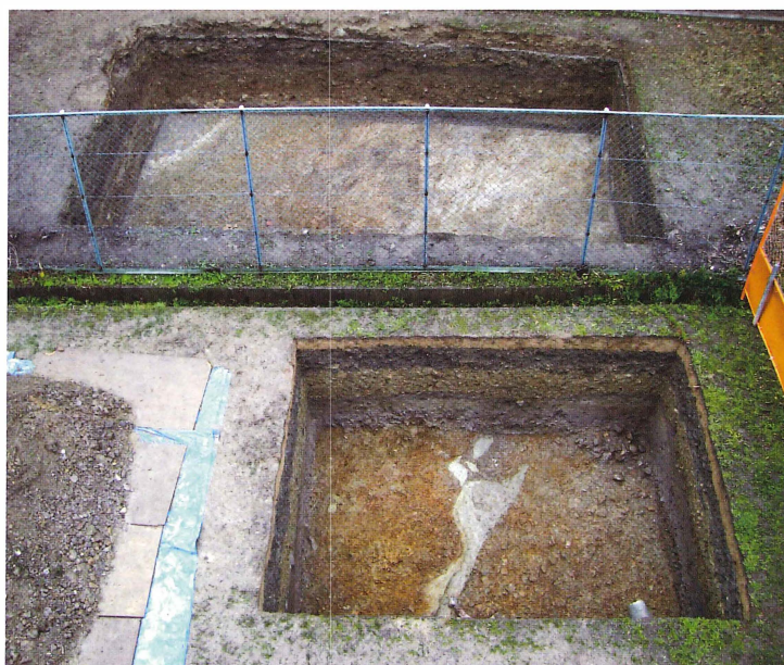
第11図 9-3 調査区全景（東から）

東調査区では、0.8mの中学校グラウンド整地土の下に約0.2mの水田耕作関連の堆積層があり、さらにその下に周壕内の堆積層である約0.4~0.5m礫を含んだ灰色粘土層が存在する。それらを除去すると灰オリーブ色シルトと明赤褐色礫からなる地山に至る。周壕堆積土はほとんど遺物を含まず、また葦石の転落状況も確認できなかった。これらのことから後円部裾はフェンス下付近に存在するものと見られる。この他に水田面からは直径0.7mの円形素堀井戸が掘り込まれていた。