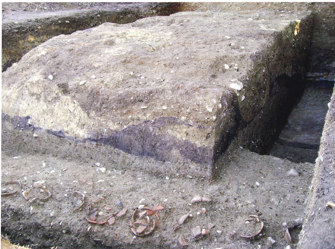
第8図 9-1 調査区埴輪列と盛土の状況（北西から）

また今回の調査では、調査区を設定した平坦部がすべて後世の盛土であることが新たに判明した。盛土は埴輪列や墳丘、葺石などを削平した後に、厚さ約1~1.5mにわたり灰色粘土、黄色粘土、黒色粘土、茶褐色砂質土を交互に堅く突き固めている。盛土の状況から、調査区南の一段高い墓地の北側崖面も同様の盛土であり、大規模な造成が行われていたことが明らかとなった。ただし盛土内からは、遺物の出土が無く、その時期や目的などについては今後検討を要する。