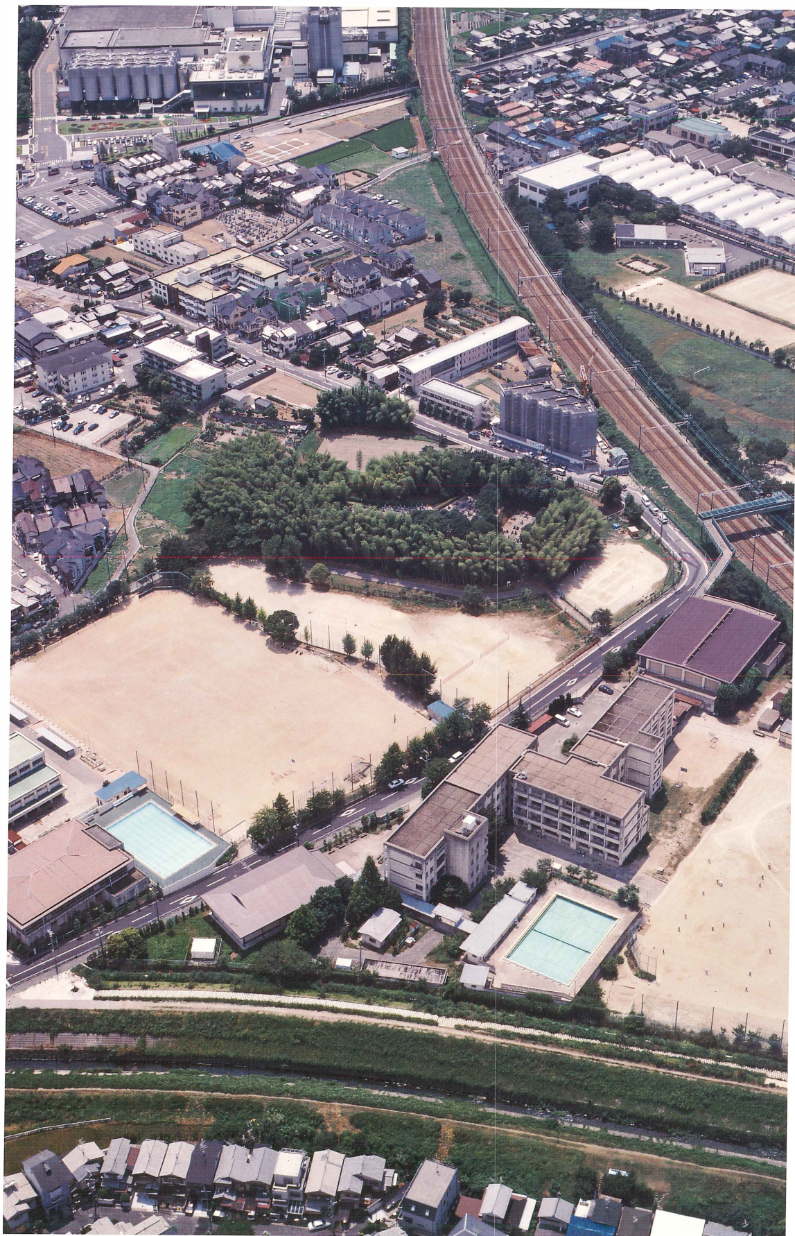
第1図 恵解山古墳全景（北東から）