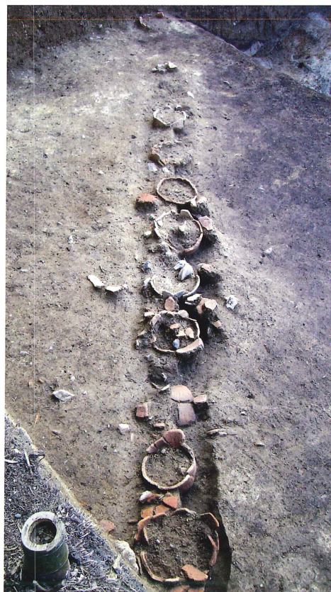
第14図 埴輪検出状況（南西から）