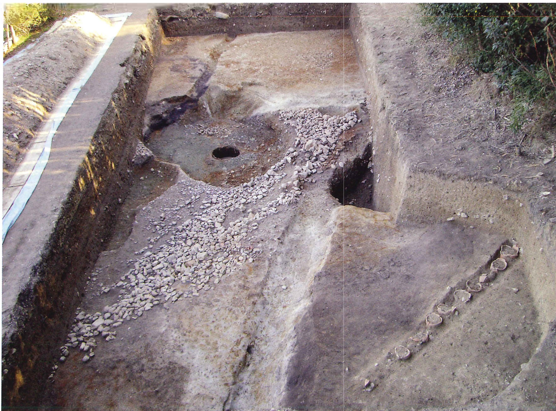
第12図 9-4 調査区全景（北から）

調査区内では、現地表下約1～1.2mまで近世以降の堆積土が続いており、それらを除去すると、灰色粘土の水田耕作土があらわれる。また調査区の北西隅には削平されずに残った後円部墳丘が高さ約1mの高さで残存しており、その崖面に沿って幅約1m、深さ約0.3mの溝と、その東に幅0.5～0.7m、高さ0.4mの断面半円形に盛り上げられた畦が作られている。溝内には砂の薄い堆積が見られることから水路と見られる。溝の南側には直径3.5m以上の井戸と見られる大きな落ち込みがあり、一連の施設と考えられる。昭和42年（1967）の京都府教育委員会作成の墳丘測量図ではこの部分では大きく墳丘をえぐられるように等高線が巡っており、かなり大規模な落ち込みが存在した可能性がある。これより東側が水田面となるが、この耕作土と床土を除去すると調査区の北と南では地山面となり、中央付近では灰色粘土層と転落した葺石が現れる。南側ではこの地山面を切り込む形で幅0.5m、深さ0.2mの蛇行する溝が、中央付近には水溜と井戸が検出された。いずれも江戸時代の遺物を含み、水田より以前のものである。水溜は直径1.6m、深さ0.8mの堀方内に直径1.3mの曲げ物の枠を納めたもので周囲は灰色粘土で埋めている。井戸は直径約0.8mの底を抜いた桶を倒立させて井戸枠としたもので、上部1段目まで確認している。この井戸の堀方は非