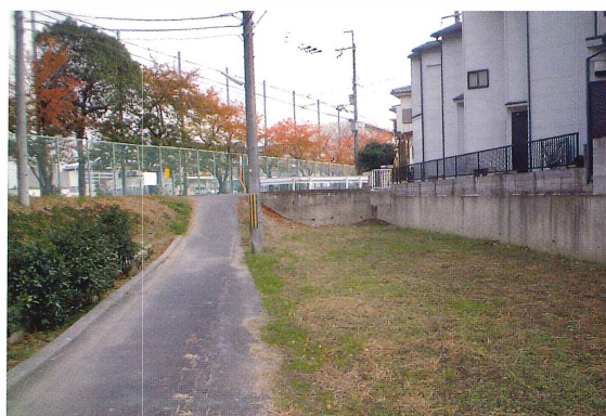
第6図 9-5調査区調査前風景（南西から）