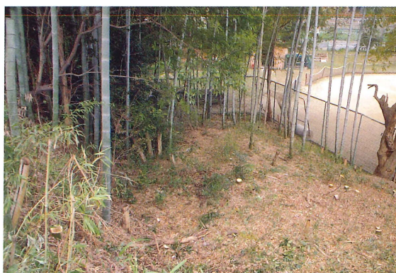
第3図 9-1調査区調査前風景（東から）

このように毎年新たな発見がなされ、保存整備のための貴重なデータが蓄積されている。本年度の調査では、後円部の正確な規模を把握するために、後円部の北側に9-1調査区、東側に9-3調査区を設けた。また中心埋葬施設の手がかりを得るために、後円部中心付近の斜面には9-2調査区を設定。そのほかに埴丘東側のくびれ部と東側造り出しの検出を目指して9-4調査区を、前方部南側周壕外周の確認のために周壕南東部に9-5調査区を設けた。その後、調査の進展に伴って新たに9-1調査区の東に9-6調査区、9-5調査区の西側に9-7調査区を設けた。