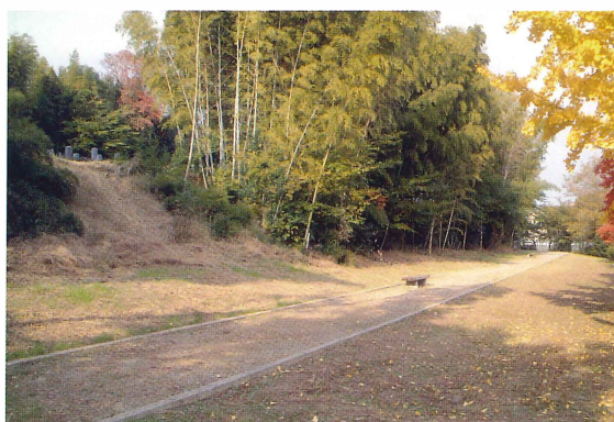
第5図 9-3・4調査区調査前風景（南東から）