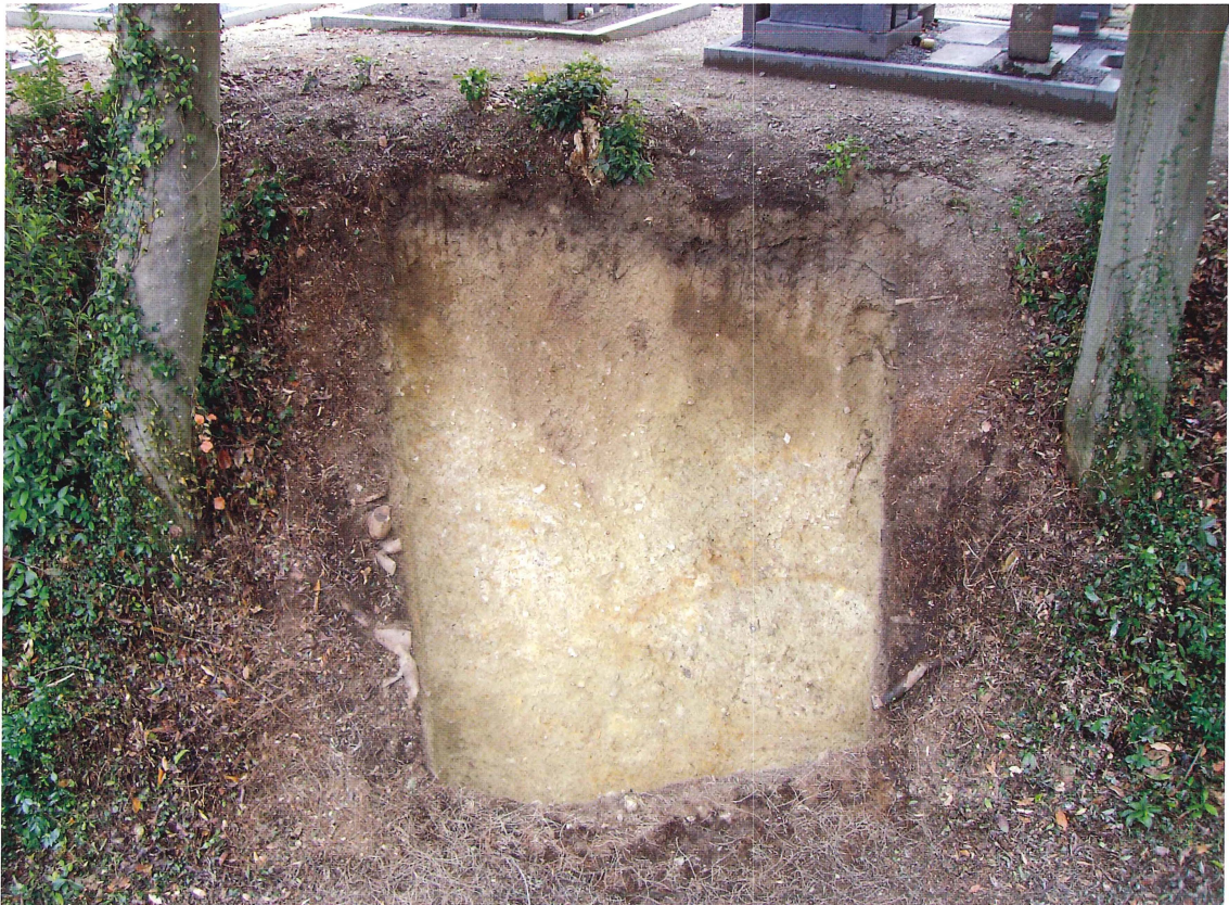
第9図 9-2 調査区全景（北西から）

当調査区は、恵解山古墳の主体部に関する手がかりを得るために、後円部のほぼ中央付近に設定したものである。恵解山古墳の主体部については、大正13年（1924）の踏査の段階で凝灰岩の板石が5枚出土したことが記されており、これらが竪穴式石槨の天井石と推定されている。その後恵解山古墳第2～4次、6～8次の各調査では結晶片岩が多数出土しており、おそらく竪穴式石槨の壁体で使用された物と考えられている。また恵解山古墳第6次調査では、地中探査レーダーにより、後円部中央付近で古墳の主軸に直行する東西約10m、南北約5m長方形の落ち込みが存在する事が判明した。今回の調査区はこの長方形の落ち込みの北側約3mにあたる墓地内の道に面した崖面に当たる。調査区は崖面に生えている木の間に南北2.3m、東西2.5mで設定した。表面から約0.5mには腐植土の堆積があり、さらにその下には南側からの堆積土と見られる黄褐色砂質土が約0.3m堆積していた。この堆積土内からは土師器の皿が出土している。これらを除去すると墳丘を構成する盛土の一部と見られる比較的強く締まった灰白色砂礫土が確認された。直上に墓地があるためこれ以上掘り進むことはできなかったが、観察では竪穴式石槨や粘土槨に関連するような土層・土質の明確な変化や石材、遺物などは確認する事はできなかった。