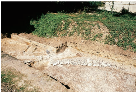
6. 第4次調査 (4-2 調査区)