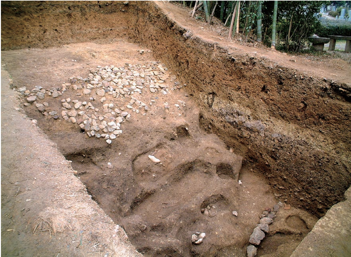
14. 7-2 調査区の全景（東から）

能性がないとはいえないが、傾斜面と平坦面とのほぼ境目に位置していること、比較的大振りの石材を横方向に用いてほぼ直線的に配していることなどから、ここでは基底石と判断しておきたい。次に傾斜面の上部に残存する葺石は、おもに拳大ほどの大きさの礫を墳丘に差し込むように小口積みしていることを確認できたが、盛土との間に裏込めなどは認められなかった。葺石に使用された石材種は、おもにチャート、砂岩、頁岩～粘板岩などであり、これらは古墳の南西約900mの地点を流れる小泉川から採取されたものと推察されている。この他、転落石の中から、結晶片岩の小片が1点ではあるが出土している。