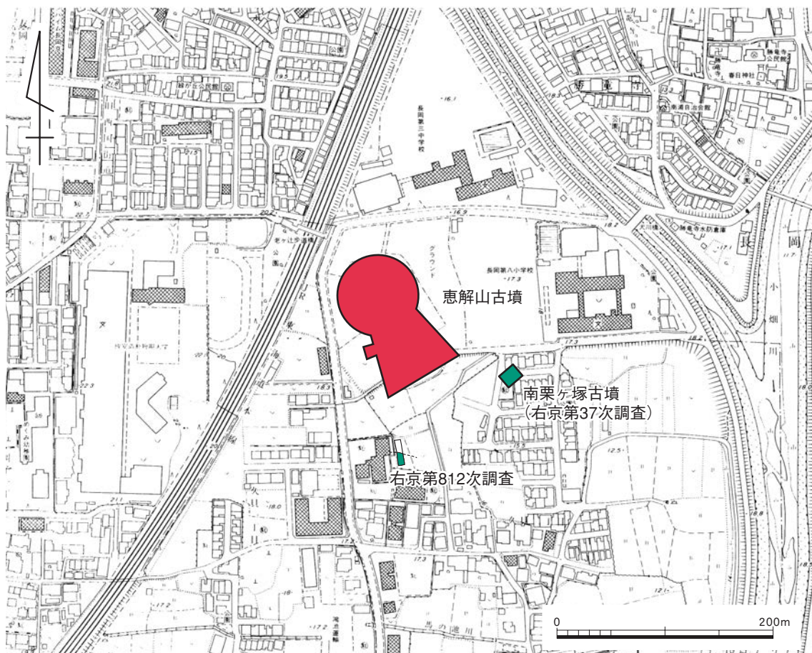
2. 恵解山古墳の位置 (1/5000)

古墳のすぐ南東部の調査（右京第37次調査）では、一辺17×14mの方墳である南栗ヶ塚古墳が発掘され、周溝から円筒や朝顔、家形などの埴輪が出土している。また、南西部すぐの調査（右京第812次調査）では、大きな落ち込みが確認され、その内部に堆積した整地層から埴輪片がまともに出てきたことから、付近に古墳の存在した可能性が推察されている。このようにみると、前方部の前面に近接して埴輪を伴う古墳が複数存在していることは間違いなさそうである。これらの埋没古墳は、主墳としての恵解山古墳に従属する陪塚の可能性が考えられるだけに、重要であろう。