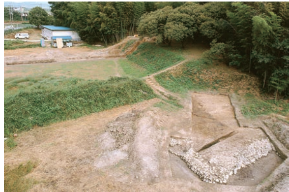
8. 第5次調査 (5-2 調査区)