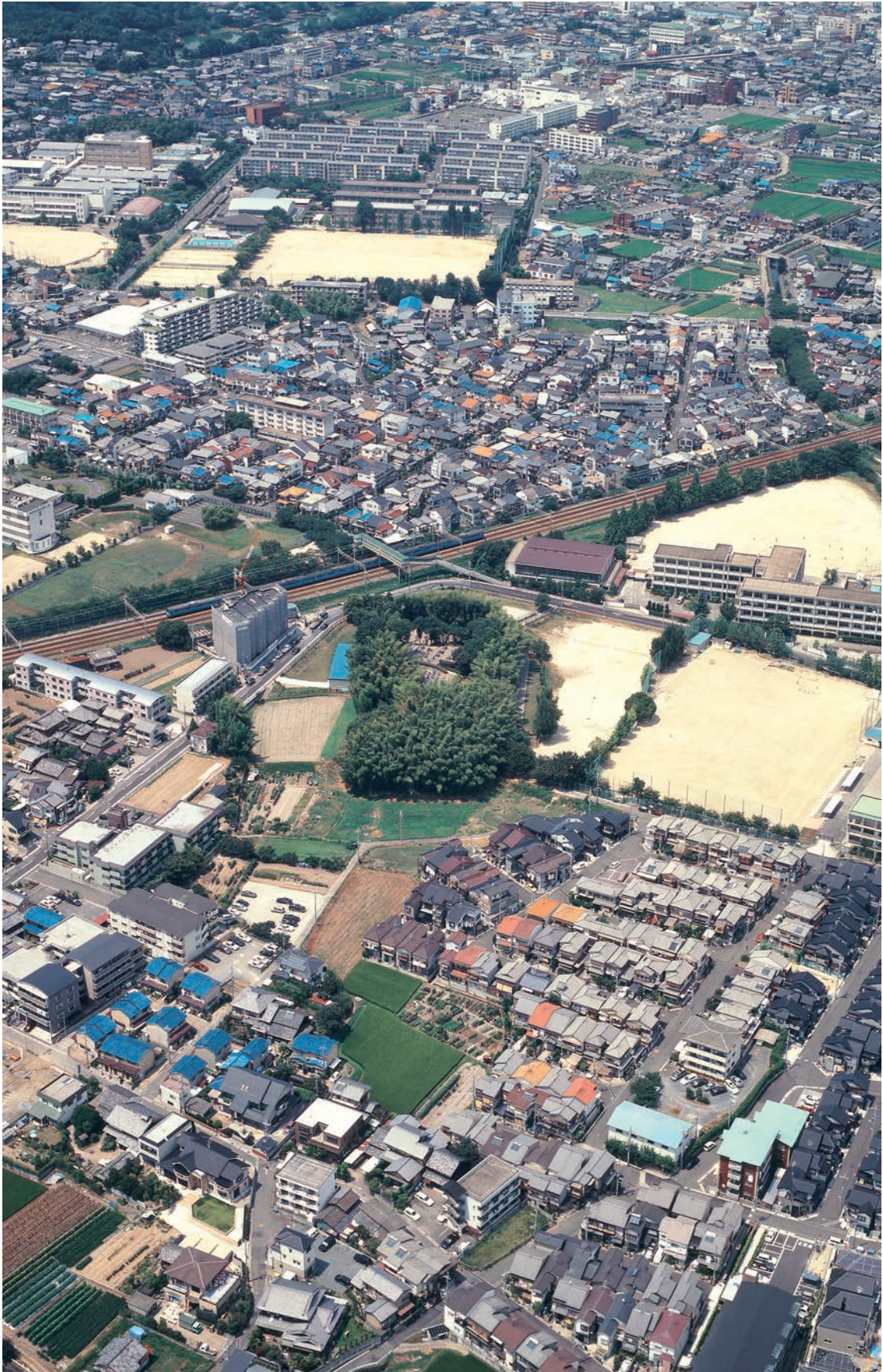
1. 南東上空から見た恵解山古墳