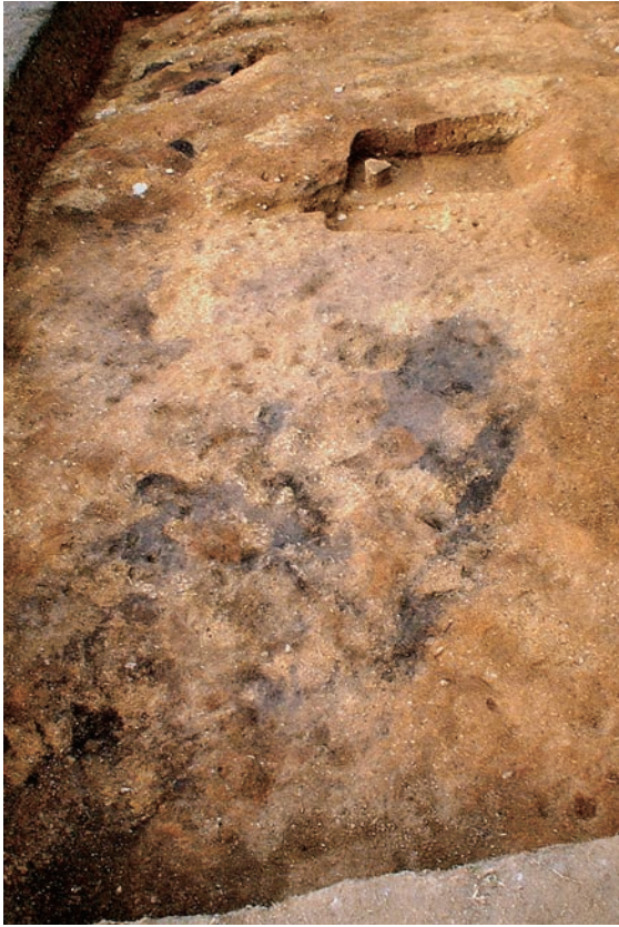
12. 墳丘盛土の堆積状況1（南から）