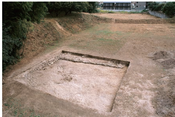
9. 第6次調査 (6-1 調査区)