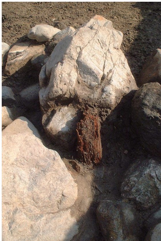
19. 葺石内の角杭検出状況（西から）