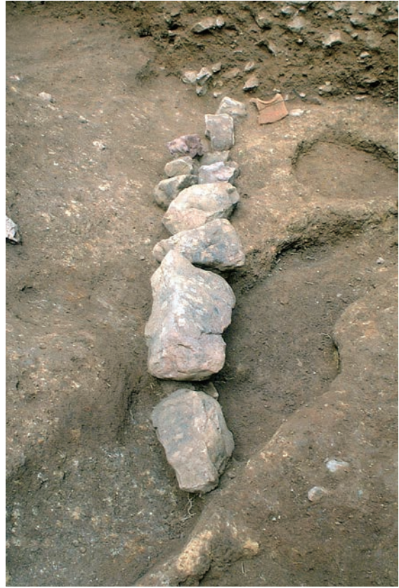
16. 基底石出土状況（南東から）