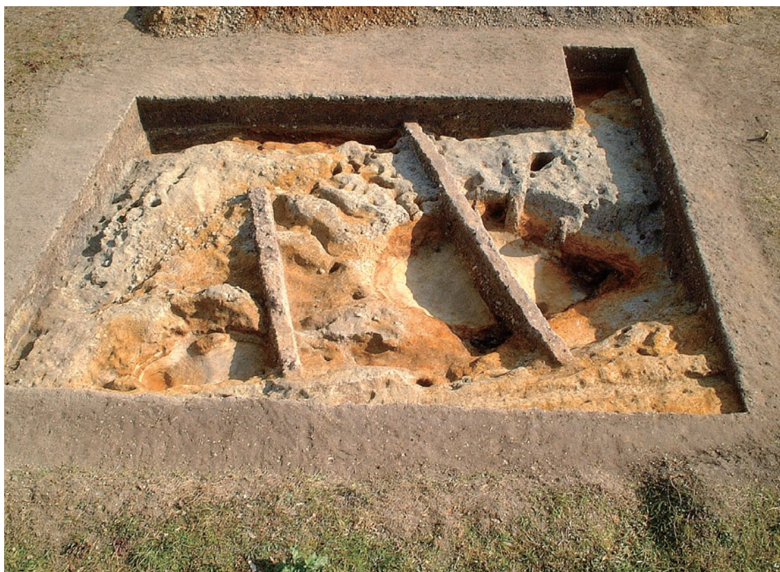
20. 7-5 調査区の全景(南西から)

なお、地山を構成する土層は、緑灰色系ないしは黄灰色系を呈する粘土層や砂層であり、これらは大阪層群であることが判明した。