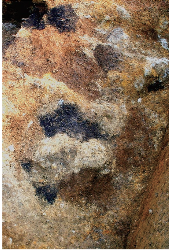
13. 墳丘盛土の堆積状況2（北西から）