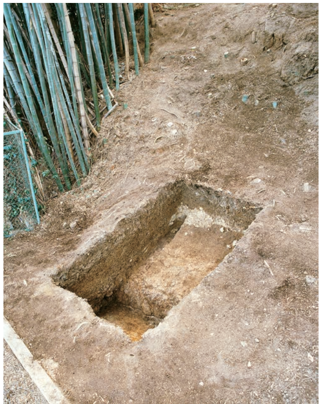
17. 7－3 調査区の全景（北から）

地山は、灰白色を呈した硬質の砂礫層であり、上面の標高は15.4m前後である。盛土は、おもに地山起源の黄灰色系の粘質土などを用いており、おおむね水平に堆積する2、3層の単位を確認することができた。