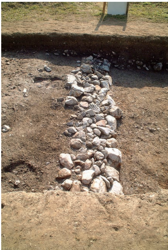
18. 葺石検出状況（北東から）

なお、葺石が途切れた東側では、埴輪片や5cm前後の小礫が散乱した状態で出土していることから、平坦面の存在を想定することができそうである。