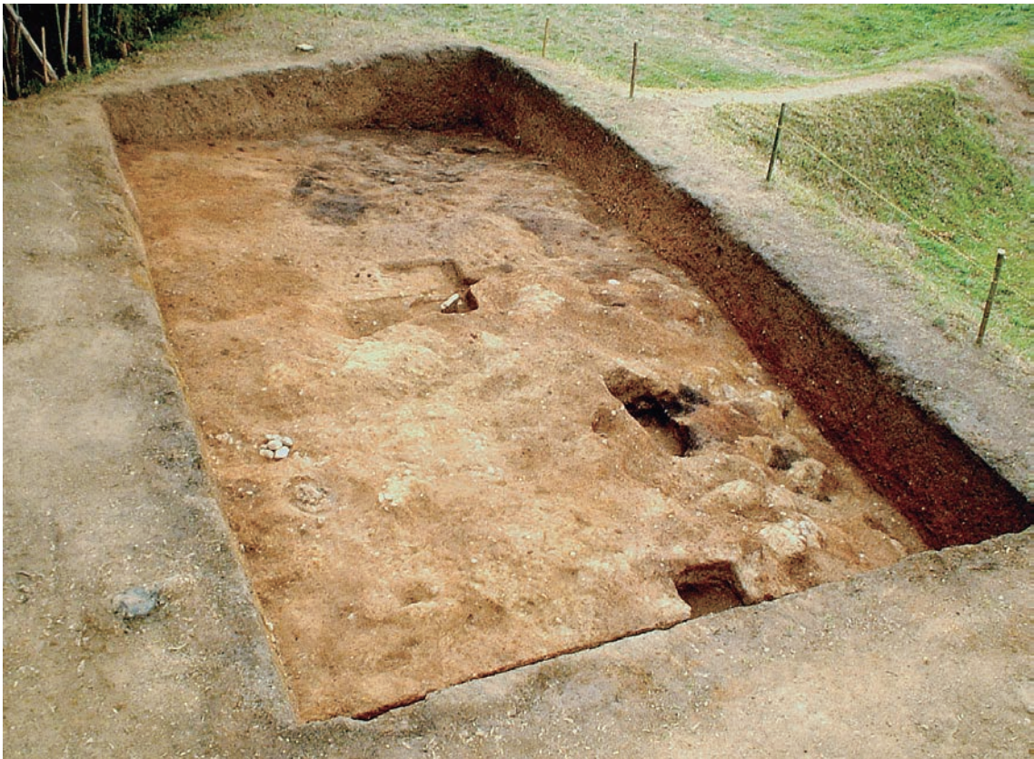
11. 7-1 調査区の全景（北から）

土葬墓群 平坦状に削平を受けた墳丘盛土の上面で、近世以降と考えられる土葬墓を6基確認できた。土葬墓は、方形、長方形、楕円形などの平面形を呈し、人骨の遺存するものが多く、上部にいくつかの礫を据え置いて墓標とするものが1基ある。