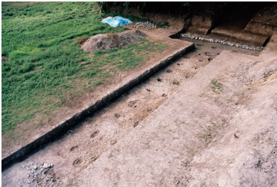
5. 第4次調査 (4-1 調査区)