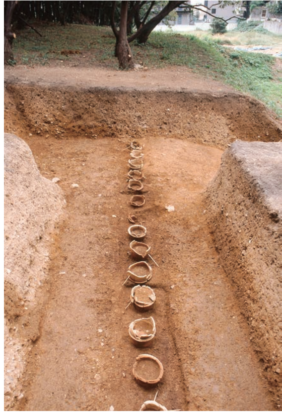
7. 第5次調査 (5-1 調査区)