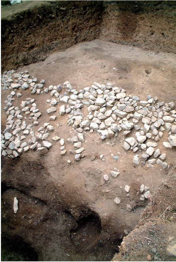
15. 傾斜面の葺石出土状況（北から）