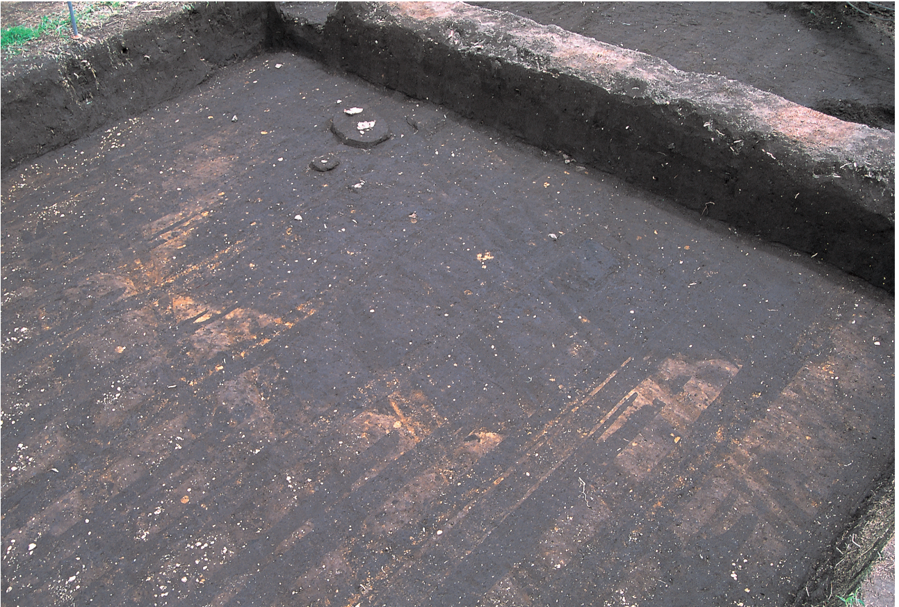
豎穴住居跡1号 (検出状況)