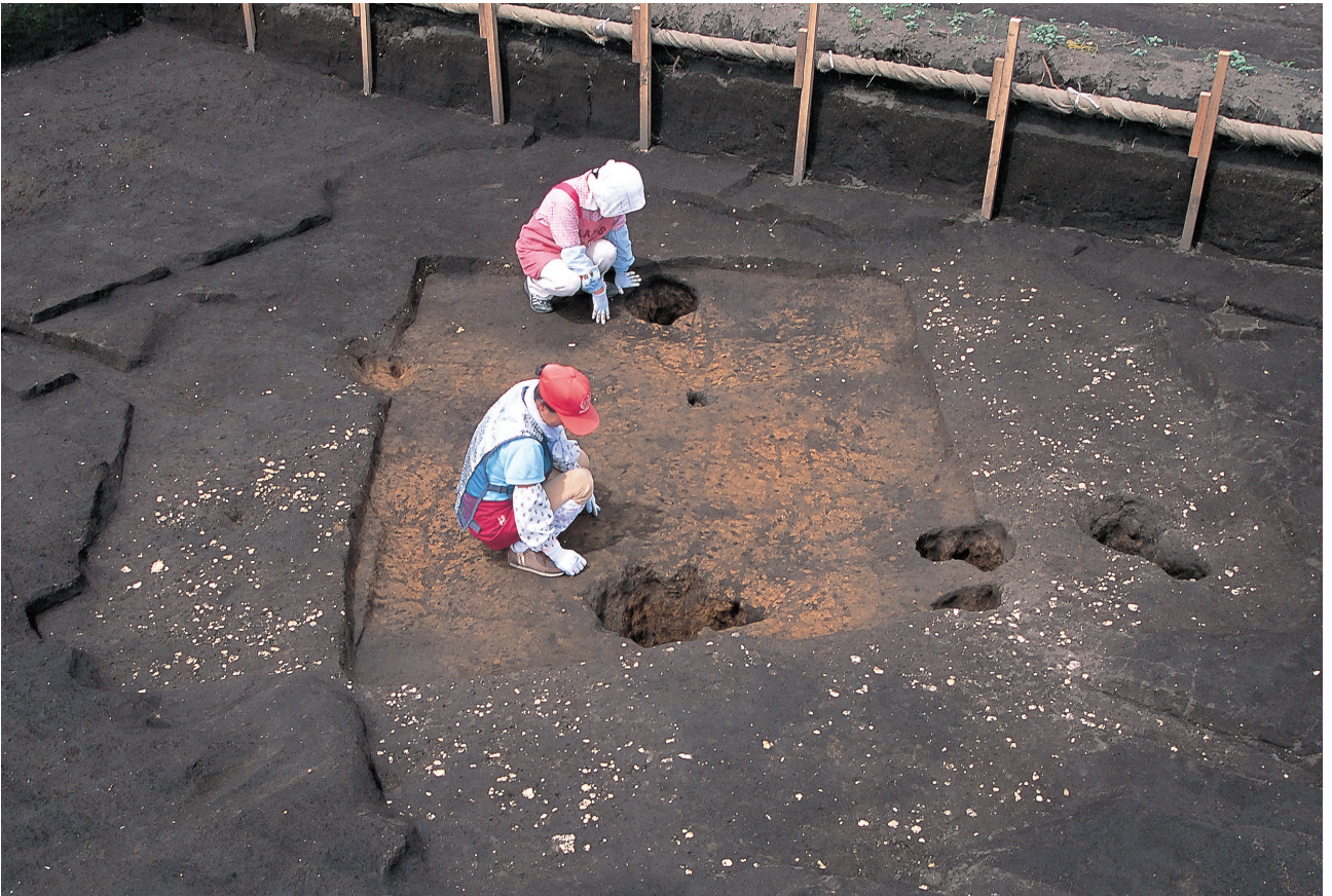
遺構掘り下げ状況