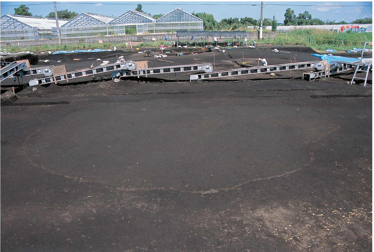
豎穴住居跡12号 (検出状況)