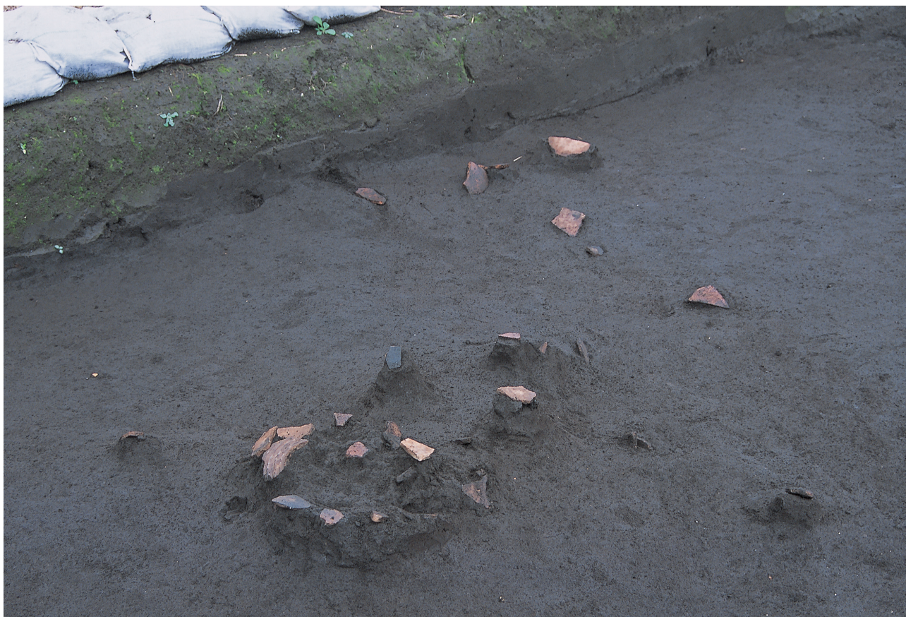
弥生土器出土状況