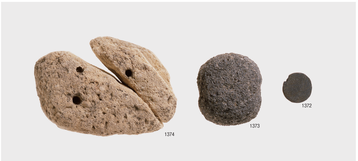
石槍・石匙・削器・搔器・楔形石器・異形石器・その他