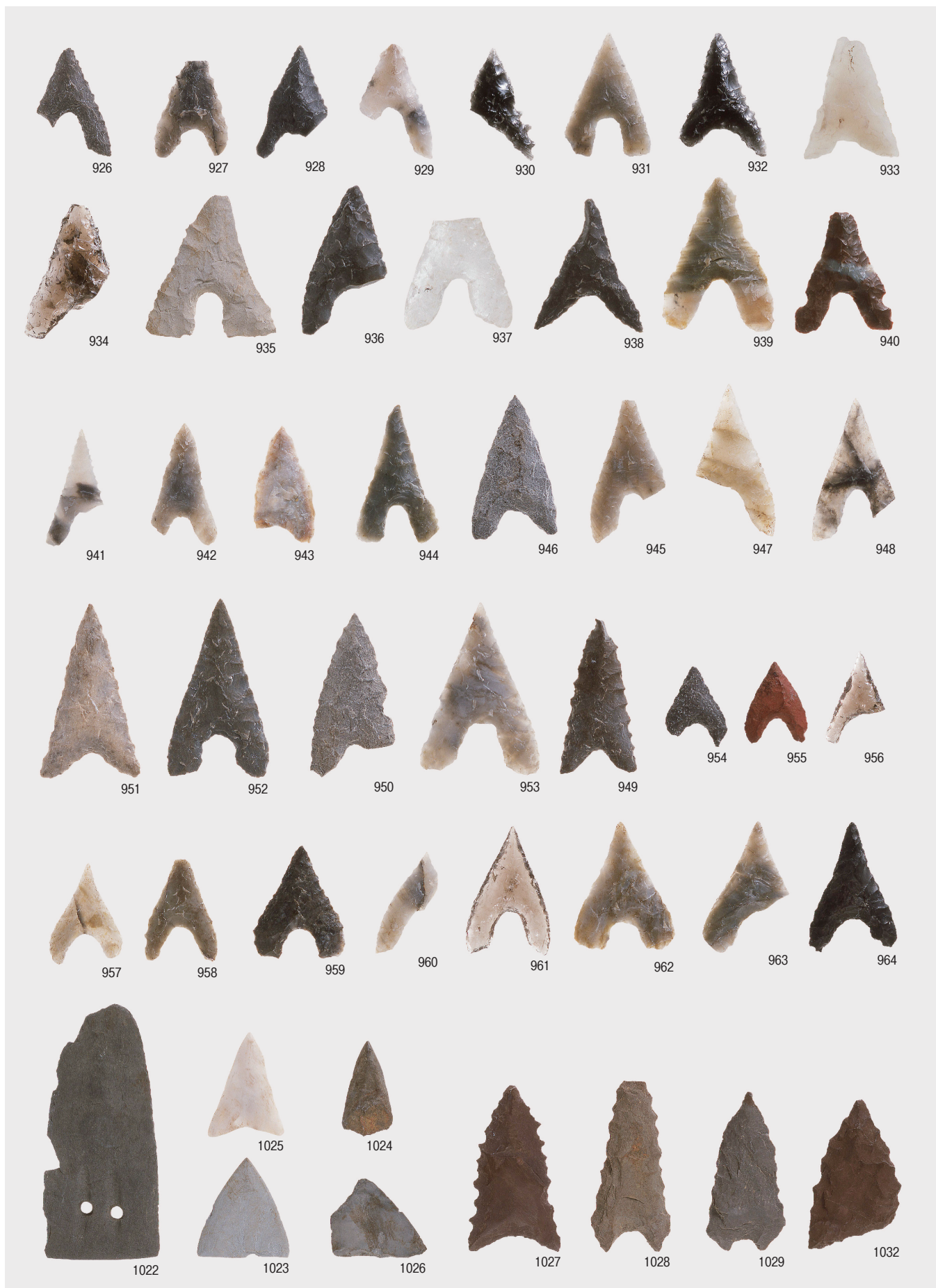
石鏃 IIIb 類・IV 類・VIIa 類・VIII 類